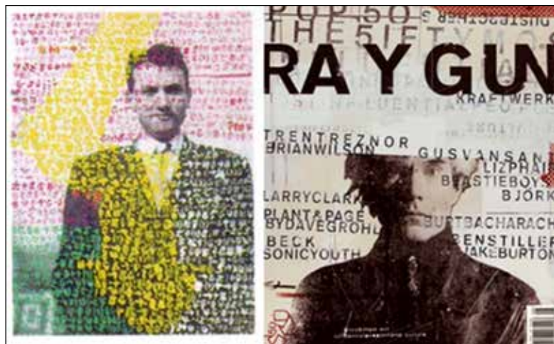
تصویر ۵. سمت راست: جلد مجله ری گان، طراح دیوید کارسون (۱۹۹۸) (همان)؛ سمت چپ: خودنگاره ایزیدور ایسو (۱۹۵۲) (URL23).

آشفته را به تصویر درآورده است. پیچیدگی اثر که با استفاده از عناصر نوشتاری ایجاد شده، مخاطب را در تلاش برای خواندن و درک معنای حروف و واژگان مایوس می‌کند. تعدد فونت‌های مختلف (که گذر زمان از ابتدای انقلاب صنعت چاپ تا دوران معاصر را به نمایش می‌گذارد) و عدم وجود ساختار مشخص و سازمان‌دهی تصادفی اثر، در کنار دشواری ایجاد ارتباط با پوستر، آن را مرموز ساخته و مخاطب را به کشف معنا دعوت می‌کند.