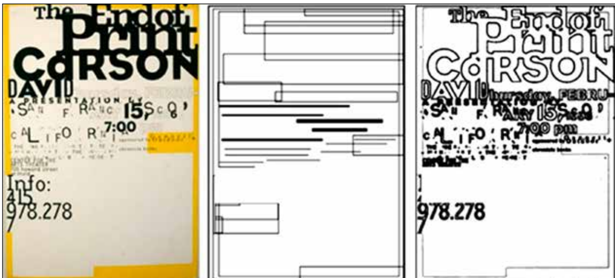
تصویر ۶. دیوید کارسون (۱۹۹۶)، پوستر رویداد «پایان چاپ» ۵۴ (URL24).