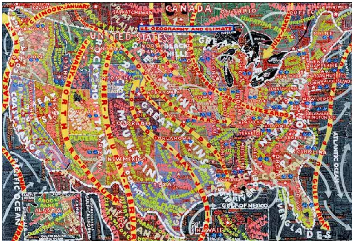
تصویر ۸. پائولا شر (۲۰۰۶)، نقشه (URL27).

نوشتار، بهره‌مندی از رنگ‌های گرم و خالص، پیچ و تاب حروف و کلمات هماهنگ با فضای کادر، اغلب با کاربرد حروف در جنبش شهودی لتریسیم، مشترک است.