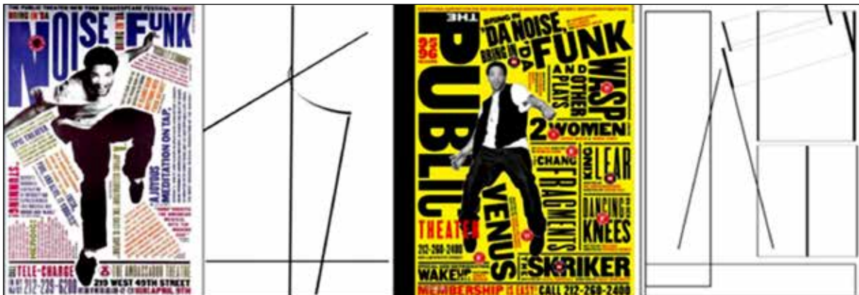
تصویر ۷. پائولا شر (۱۹۹۵)، پوستره‌های کمپین تبلیغاتی رویداد موسیقایی (URL26).

به مخاطب منتقل می‌کنند. شر خود در مصاحبه‌هایش بارها به شهودی عمل کردن و تمایلش به خروج از چارچوب‌های سنتی مشخص شده برای کاربرد حروف نوشتاری اشاره کرده‌است (همان). از نظر او ویژگی‌های تصویر حروف نوشتاری، فضای پر و خالی این عناصر، بهره‌مندی از امکانات تجسمی گوناگون در یک‌جا را برای طراح گرافیک به ارمغان می‌آورد. این دل‌بستگی به جلوه تجسمی و زیبایی‌شناسی حروف نوشتاری، در مجموعه نقشه‌های طراحی شده توسط شر، به‌خوبی نمایان است (تصویر ۸). نقشه‌های دیدنی و خواندنی پائولا شر، یادآور فضای تجسمی ساخته شده توسط حروف نوشتاری لتریسیم در هایپرگرافی‌هاست.