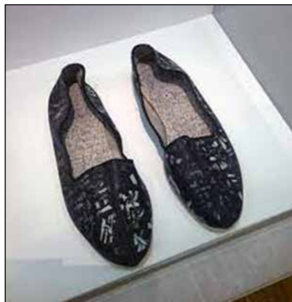
تصویر ۳. ایزودور ایسو (۱۹۶۴)، مجسمه هایپرگرافی (URL18).

ایزیدور ایسو، احیای رسمی هنر و زندگی را از طریق تجسم و