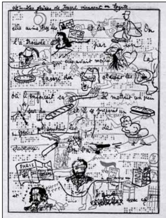
تصویر ۲. ایزودور ایسو (۱۹۵۰)، ژورنال خدایان (شوبرگ، ۲۰۱۵، ۹۸).

ایسو طی جریانات سیاسی و آزار و کشتار یهودیان توسط نیروهای فاشیست در رومانی، در اوت ۱۹۴۵، به‌طور مخفیانه با چمدانی حامل نسخ خطی ارزش‌مند (که به احتمال قوی متون کابالایی باستانی بخشی از آن‌ها بوده است)، رومانی را ابتدا به مقصد ایتالیا و سپس فرانسه ترک کرد. او در مقصد اولیه خود، ایتالیا، نزد شاعری تجربی به نام جوزپه اونگارتی ۳۴ مدتی ماند و پیش از سفر به پاریس، از او درخواست کرد تا معرفی نام‌های خطاب به ژان پائولان ۳۵ ، نویسنده فرانسوی بنویسد. این معرفی نامه از جانب اونگارتی، ورود ایسو به دنیای ادبی پاریس را بسیار آسان ساخت (خالفا، ۲۰۲۱، ۳۱۹). ایسو در سال‌های اولیه اقامتش در فرانسه، هم‌چنان از زبان بیدیش ۳۶ (زبانی محلی رومانیایی و یهودی) استفاده می‌کرد. این زبان امکان محاوره‌های پاره پاره و آواگونه را به کاربر خود می‌داد و ایسو از آن چنین یاد