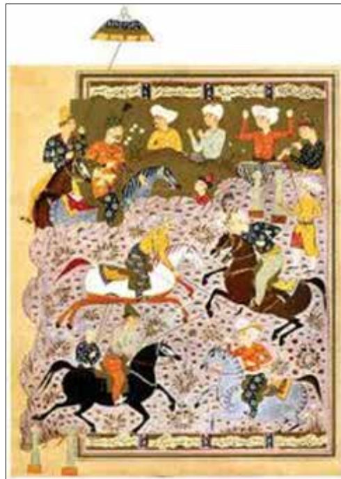
تصویر ۱: نسخه خطی قرن نهم ه. ق، (آذرنوش، ۱۳۹۲، بدون شماره صفحه).

گر ایدونک فرمان دهد شهریار / بیارم از ایران به میدان سوار مرا یار باشند بر زخم گوی / بر آن سان که آیین بود بر دو روی سپهبد چو بشنید ازو داستان / بدان داستان گشت همداستان سیاوش از ایرانیان هفت مرد / گزین کرد شایسته کارکرد