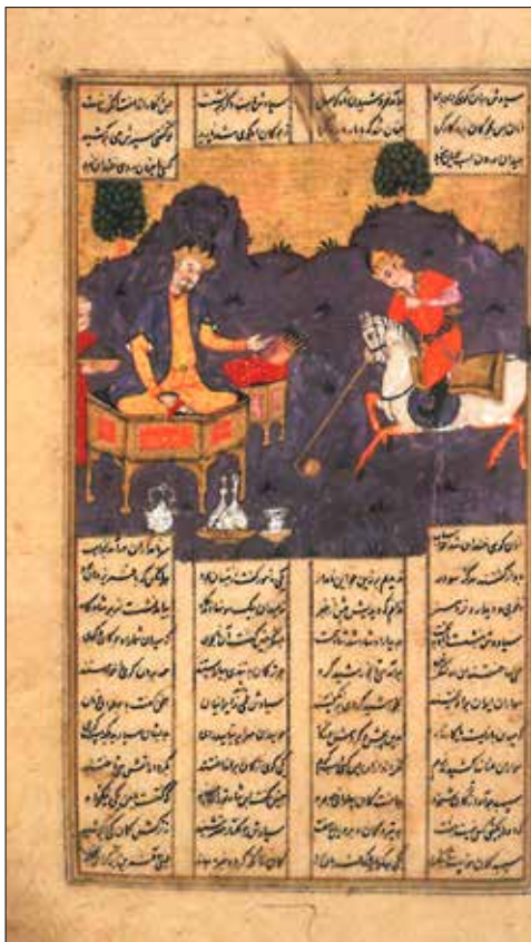
تصویر ۵: نگاره‌ای از نسخه خطی شاهنامه دانشگاه پرینستون به شماره G59، برگ ۱۱۲.