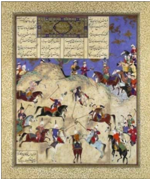
تصویر ۲: نگاره‌ای از شاهنامه شاه طهماسبی، اثر قاسم بن علی، بین سال‌های ۹۲۶-۹۳۶، (آذرنوش، ۱۳۹۲، بدون شماره صفحه).