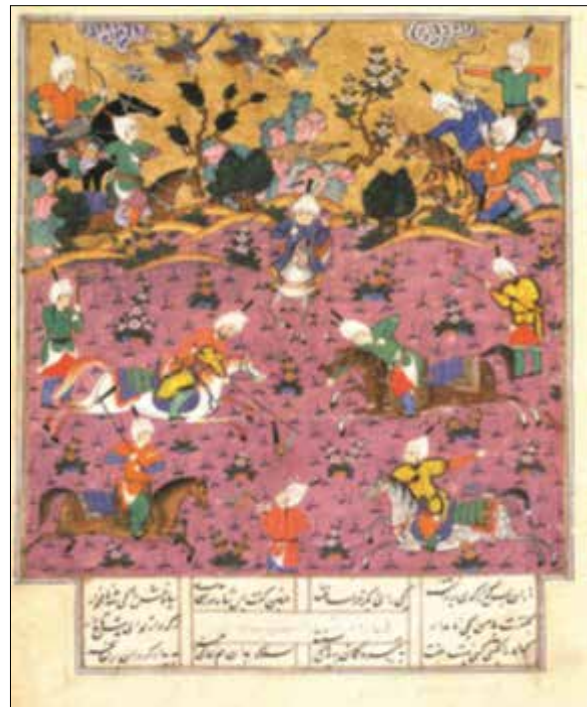
تصویر ۳: نگاره‌ای از شاهنامه شاه طهماسبی، منسوب به سلطان محمد تبریزی، بین سال‌های ۹۴۷-۹۱۶، (آذرنوش، ۱۳۹۲، بدون شماره صفحه).

در زمین بازی پنج نفر سوار بر اسب مشغول بازی هستند که