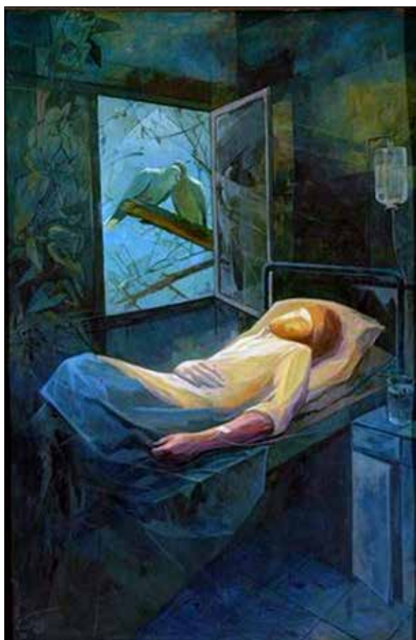
تصویر ۲. ایرج اسکندری، عیادت، ۱۳۶۵، رنگ روغن روی بوم، ۱۰۰ در ۱۵۰ سانتی‌متر (URL1).

خصوصاً که نگاه زن به تخم‌های کبوتر دوخته شده و از سوی دیگر کودک را با همه وجودش در آغوش گرفته‌است.