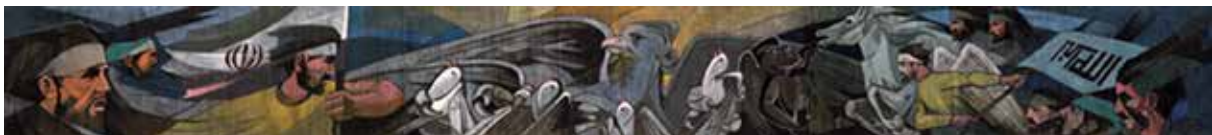
تصویر ۵. ایرج اسکندری، دفاع مقدس، ۱۳۶۶، رنگ روغن روی دیوار و بوم، ۱۰۰ در ۹۰۰ سانتی‌متر (URL1).

این تابلوی پرگو، پر از عناصر تصویری و رنگ با طراحی دقیق، برگشت هنرمند به آثار اولیه و فیگوراتیوش را نشان می‌دهد. اثر «دفاع مقدس» اثری روایی-نمادین است که با عقاب و کبوترهای در چنگالش به روشنی تقابل خیر و شر (هم‌چون دو اثر دیگر که ذکر آن رفت) را روایت می‌کند. رزمنده‌ها با