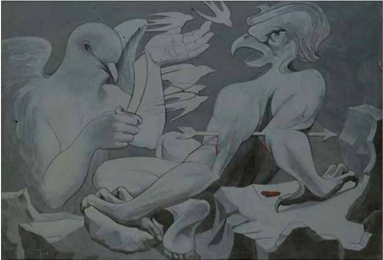
تصویر ۳. ایرج اسکندری، دفاع مقدس، ۱۳۶۵، رنگ روغن روی بوم، ۱۳۰ در ۱۶۰ سانتی‌متر (URL1).

پیشانی‌بند و پرچم در دست از سمت راست به سمت مرکز و به سوی عقاب می‌روند. اسب سفیدی در کنار رزمنده‌های سمت راست دیده می‌شود.