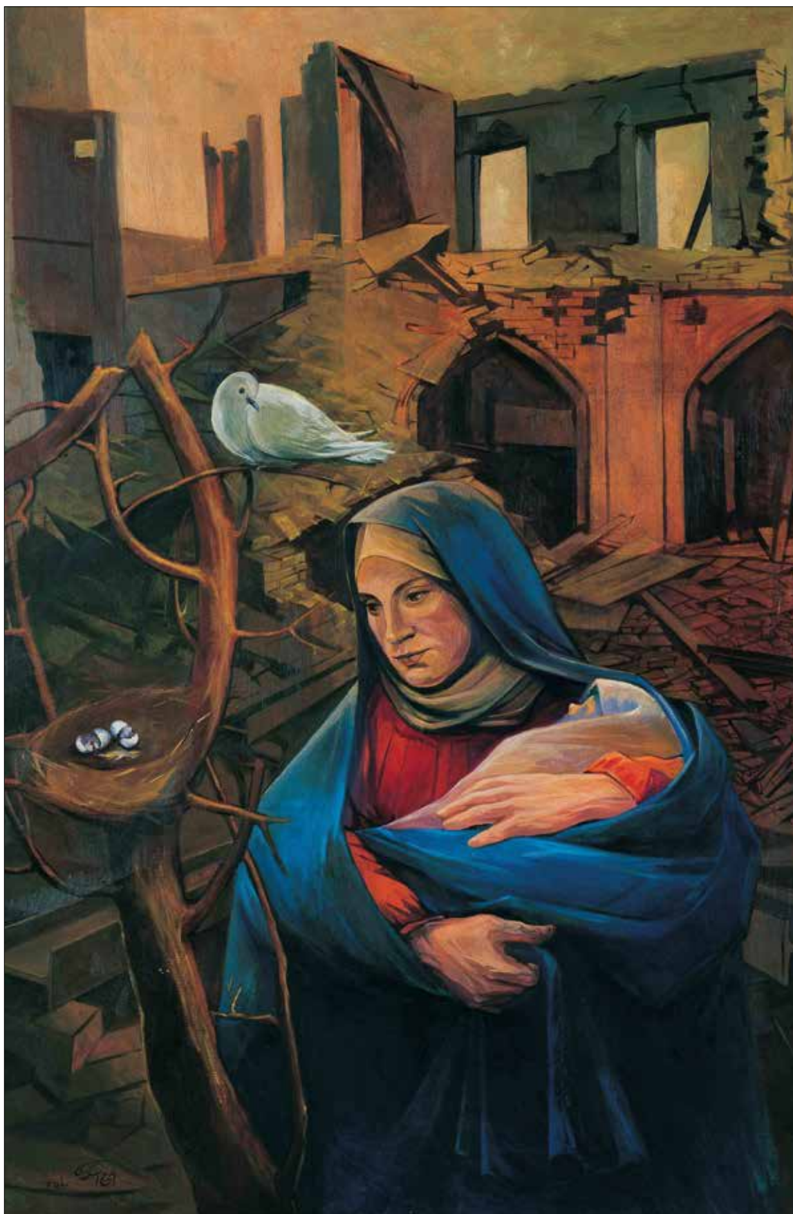
تصویر ۱. ایرج اسکندری، بمباران، ۱۳۶۴، رنگ روغن روی بوم، ۱۰۰ در ۱۵۰ سانتی‌متر (URL1).