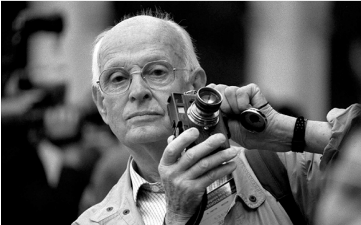
تصویر ۱. هانری کارتیه برسون، (۱۹۰۸-۲۰۰۴)، (۲۰۰۴×۱۲۵۰×۲۰۰۰) (URL).

می‌کرد. یکی از مفاهیم کلیدی که او مطرح می‌کرد، عبارت «لحظه قطعی» بود که به‌طور مکرر در آثارش به آن اشاره داشت (همان: ۱۱۹). برسون در بخش مقدمه کتاب معرف خود با نام «لحظه قطعی» به بررسی مفهوم لحظه قطعی ۲۰ در عکاسی پرداخته و بر اهمیت ثبت لحظات گذرا و تعاملات انسانی تاکید می‌کند. به‌ویژه در صفحه ۱۶ این کتاب، او به تبیین این مفهوم پرداخته و بر ضرورت درک و ثبت آنی موقعیت‌هایی که در یک لحظه شکل می‌گیرند، تاکید دارد: «عکاسی مستلزم تشخیص یک ریتم در دنیای واقعی است. آنچه چشم انجام می‌دهد، یافتن و تمرکز بر موضوع خاصی در میان انبوهی از واقعیت‌هاست؛ آنچه دوربین انجام می‌دهد، صرفاً ثبت تصمیمی است که توسط چشم گرفته شده‌است» (Bersson, 1952: 16). این بیان، نشان‌دهنده نگاه او به ثبت لحظات انسانی در بستر تحولات بزرگ تاریخی و تاکید بر اهمیت لحظه قطعی است. تجهیزات عکاسی او اغلب سبک و ساده بود: یک لنز ۵۰ میلی‌متری و در صورت نیاز، یک لنز