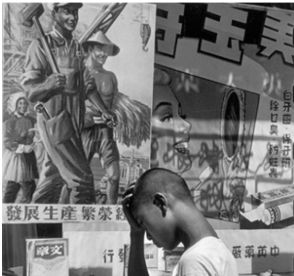
تصویر ۳. هانری کارتیبه برسون، شانگهای، چین، ۱۹۴۹ (URL2).

طریق نشانه‌ها درونی می‌شود» (Barthes, 1957, 109). قفسه‌های کتاب، نماد محدود اما موجود دانش، و حالت تامل برانگیز پسرک، فضایی خلق می‌کنند که تماشاگر را نه تنها به مشاهده، بلکه به پرسش و درنگ وامی‌دارد. او در مرکز تضادی قرار دارد که بازتاب‌گر کشاکش میان اسطوره‌های متضاد دوران خویش است.