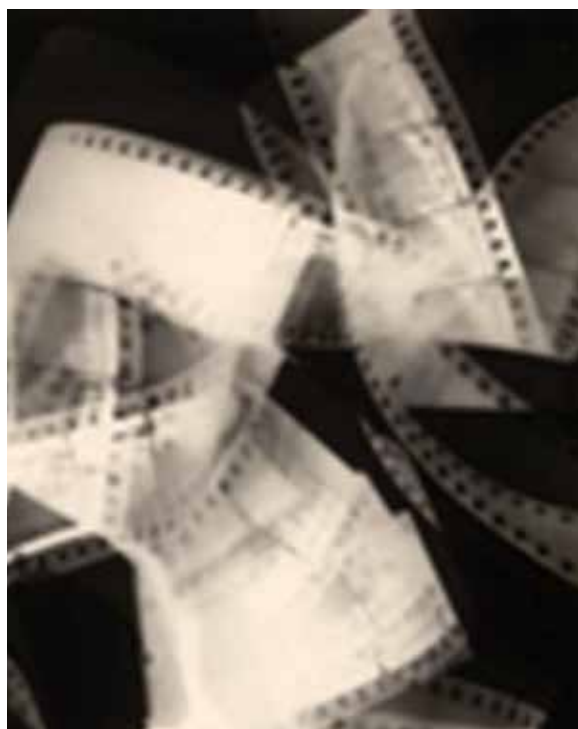
تصویر ۲. من ری، ریوگرافی، ۱۹۲۳ (URL2).

هوش مصنوعی که برگرفته از تکنولوژی است و جای اذعان نیست که عکس نیز زاینده تکنولوژی است؛ جایی که علم فیزیک و شیمی در کنار هم باعث خلق و ابداع وسیله‌ای می‌شود که بعدها نه تنها تکنولوژی خارق‌العاده‌ای بود، بلکه به جرگه هنر پیوست و بنیان‌گذار چند هنر نوین دیگر چون سینما و ویدئو آرت برای بستر پر فعل و انفعال هنر شد که از قرن نوزدهم تا عرصه هنر مدرن با خود به همراه کشیده‌است. ژیزل فروند ۲۰ ، عکاس و نویسنده مقالات و کتاب‌های مرتبط با عکاسی، ادعا می‌کند که «آن‌چه به لایف چنین اعتباری می‌دهد، استفاده گسترده و وسیع از عکس‌ها بود». در نگاه مردم عادی، عکاسی که نمایشی صرف از واقعیت است، نمی‌تواند دروغ بگوید. او توضیح می‌دهد که تعداد انگشت‌شماری از مردم متوجه می‌شوند که می‌توان معنای یک عکس را با نوشتن توضیح روی آن، کنار هم قرار دادن آن با عکس‌های دیگر، یا با عکاسی از رویدادها یا افراد به‌طور کلی تغییر داد. امروزه رسانه‌های خبری الکترونیک و فضای مجازی نیز بر صحت عکس‌های ثبت شده توسط دوربین تکیه دارند (برت، ۱۴۰۳: ۲۱۸). موضوع بحث برانگیزی که در پایان قرن بیستم آغاز شد، درک ساده‌انگارانه از پیش‌رفت هنرمندان در عرصه فن‌آوری به‌عنوان یک جنبش است که برداشتی اشتباه و غیرمنطقی است. استفاده از پیش‌رفتهای فن‌آوری مانند رسانه‌های جدید در خلق هنر یکی از دلایل اصلی ایجاد چنین سوءتفاهمی است و پیشرفت بی‌وقفه جهان به سمت فرهنگ دیجیتال و هوش مصنوعی، خود فرآیند