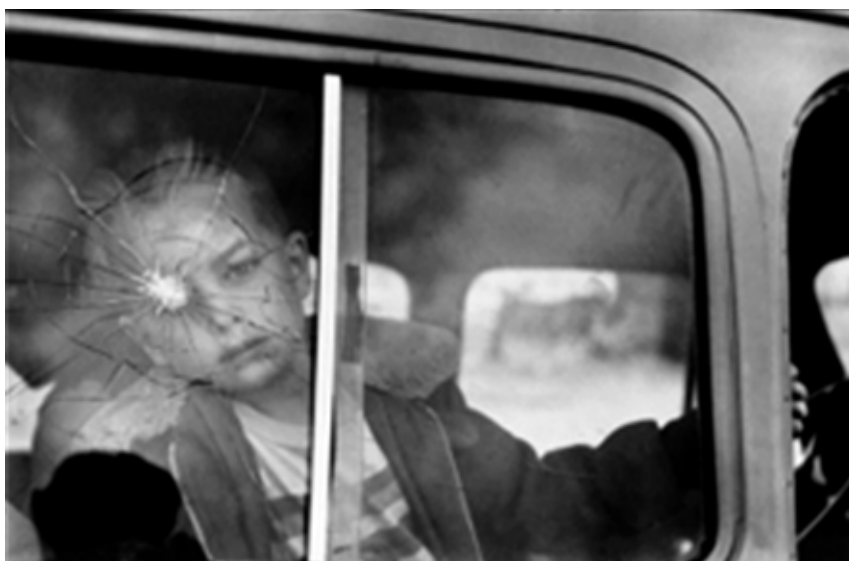
تصویر ۱۰. اليوت اريت، بدون عنوان، ۱۹۵۵ (URL10).