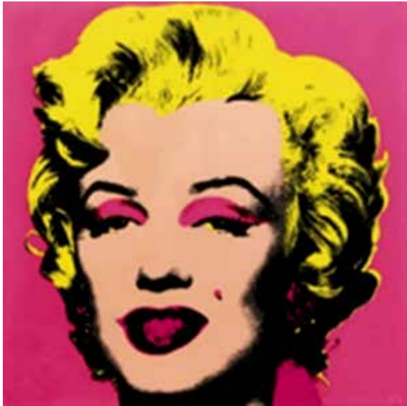
تصویر ۷. اندی وار هول، ۱۹۶۴، پرتره دیجیتال مریلین مونرو (URL7).