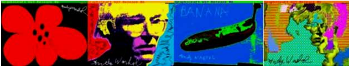
تصویر ۹. اندی وار هول، بدون تاریخ، نقاشی دیجیتال (URL9).

هوش مصنوعی را علم مهندسی ساخت سیستم‌های هوش مند به‌ویژه برنامه‌های کامپیوتری می‌داند (MacCarthy, 2007: 2). فتوشاپ از این حیثه مستثنا نیست. سال‌هاست که فتوشاپ در حیثه عکاسی جایگاه بسیار محکمی دارد، شاید نه به‌عنوان هوش مصنوعی ولی با همان دقت در حال کمک به عکاسان است. مک کورداک ۴۱ ، در جایی چنین می‌گوید: «هوش مصنوعی، مطالعه شیوه‌ای است برای تبدیل رایانه به ماشینی که بتواند اعمال و رفتار انجام شده توسط انسان را بازسازی کند (Maccor-duck, 1991: 48). کامپیوتر از بدو تولید نرم‌افزار فتوشاپ، قدرت ادیت و آسان‌سازی تغییرات و تکمیل عکس خام به عکس نهایی را به‌عنوان یک وظیفه خیلی خوب انجام داده‌است. این امر باعث گردید تا بزرگ‌ترین مشکل عکاسان از تاریخ اختراع عکاسی تا آن موقع رفع گردد. این ابزار، باعث شناخت و ارزیابی کلیت‌های عکاسی است و در تحقق این پروسه به‌طور مداوم بر اساس دانش و اطلاعات رو به پیش‌رفت است. تحولات اخیر در صنعت عکاسی کاملاً دیدنی است، مثل تغییرات بنیادین در فرمت خام عکس بعد از عکاسی و حتی تنظیمات اولیه دوربین. فن‌آوری‌های نوین ابزارهای تازه برای هنرمندان هستند که به هنر و فرهنگ سرزندگی می‌بخشند، فقط در هر فن‌آوری، چه عکاسی، چه فیلم‌برداری، فن‌آوری‌ها و الگوریتم‌هایی که استفاده می‌شود ابزارهای اساسی هستند، درست مانند فن‌آوری‌های دوربین. این مورد در دستورالعمل‌های جدید مبتنی بر هوش مصنوعی نیز صادق است و نتایج اغلب شگفت‌انگیز و لذت‌بخش هستند، اما همیشه قابل پیش‌بینی نیستند. هیچ دلیل و منطقی