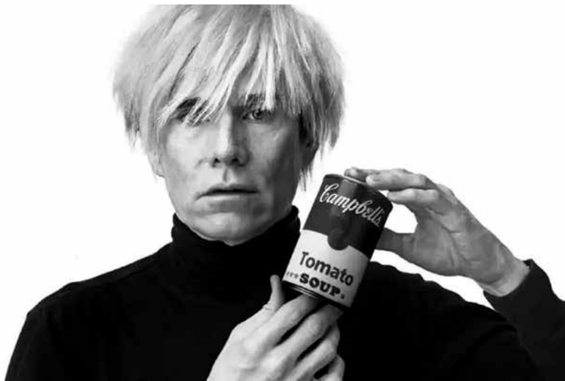
تصویر ۶. اندی وار هول، بدون عنوان، ۱۹۶۲ (URL6).

حال حاضر می‌توانیم با رایانه انجام دهیم، اما هوش مصنوعی فعالیت‌هایی است که آرزو می‌کنیم با رایانه انجام دهیم. به عبارت دیگر، به محض این که متوجه شدیم چگونه کاری را با کامپیوتر انجام دهیم، از حیطة هوش مصنوعی خارج و وارد حوزه اتوماسیون می‌شویم. باید خاطر نشان کرد از اختراع کامپیوتر و استفاده از تکنولوژی‌های مرسوم ما هوش مصنوعی را وارد اتوماسیون زندگی کرده‌ایم، همان‌طور که گفته شد هوش مصنوعی یک مقوله جدا و کامل نیست. شاید از زمان به‌کارگیری کامپیوتر به‌عنوان یک وسیله عمومی به‌گونه‌ای نامحسوس آن را در حیطة هنر وارد کرده‌ایم و به آن اجازه بازسازی و کمک به هنرمند را داده‌ایم (تصویر ۵).