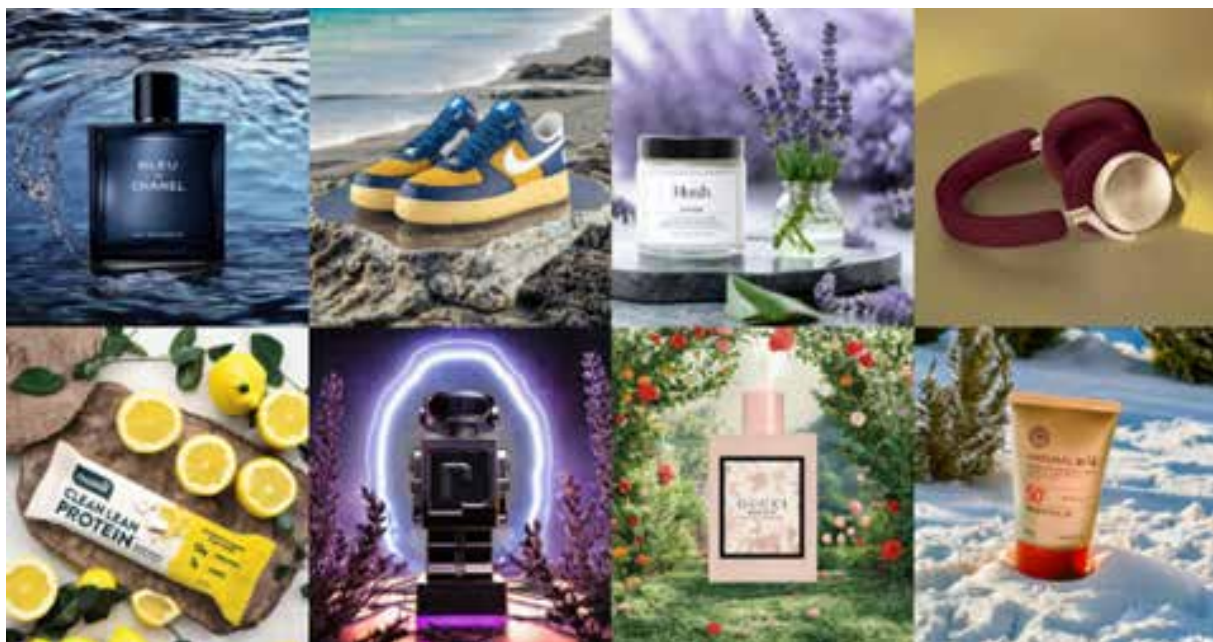
تصویر ۵، (URL5). (2023).

هوش یعنی توانایی دستیابی به اهداف پیچیده و