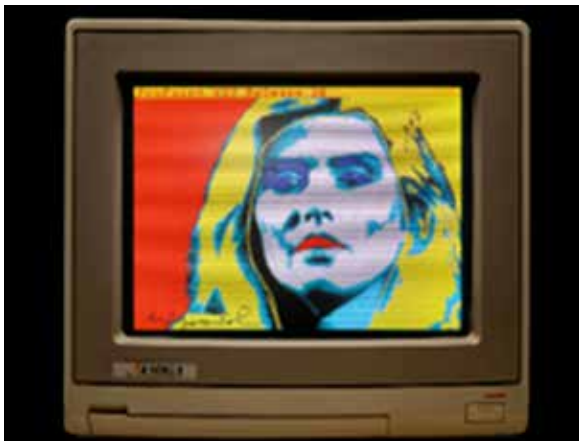
تصویر ۸. اندی وار هول، ۱۹۸۵، پرتره دیجیتال دیی هری (URL8).