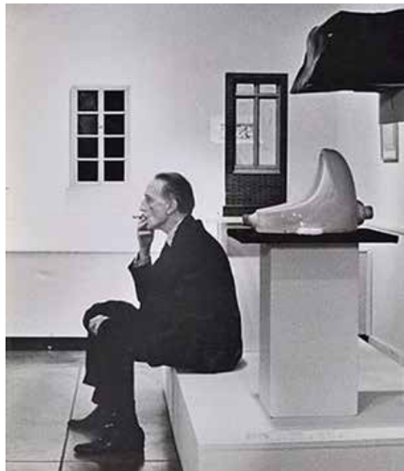
تصویر شماره ۴. مارسل دوشان، چشمه، ۱۹۱۷ (URL4).

در واقعیت مجازی ۲۹ ، تماشای منفعلانه یک تصویر جای خود را به غوطه‌ور شدن کامل در دنیایی می‌دهد که واقعیت آن هم‌زمان با دنیای ما وجود دارد. به این معنا که، هر چیزی که در رایانه دیده می‌شود، بخشی از دنیای «مجازی» است. تصاویر و متون فقط در دنیای الکترونیکی وجود دارند، جایی که با سویچ‌های الکترونیکی محو می‌شوند. اصطلاح «واقعیت مجازی» به یک تجربه سه بُعدی اشاره دارد که در آن کاربر «دیگر نمی‌تواند از اصطلاحات ساده