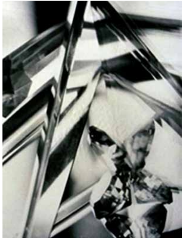
تصویر ۱. لانگدون کابرون، بدون عنوان، سال نامشخص (URL1).

آیا عکاسی در مقایسه با هوش مصنوعی یا دیگر شکل‌های تجلی یافته آن به حقیقت نزدیک‌تر است؟ پاسخ‌های مختلفی به این سوال داده شده که اخیراً بر اساس نظریه‌های مختلفی صورت گرفته است. این بحث را گاه «بحث هستی‌شناختی» می‌نامند، یعنی به هستی‌شناسی تصویر، ماهیت یا وجود فلسفی آن می‌پردازد. جواب‌های مختلف را می‌توان در دو گروه مهم دسته‌بندی کرد که عبارتند از: واقع‌گرایی و قراردادی‌گرایی. عکاسی به دلیل رابطه خاصش با واقعیت رشد کرد و شکوفا شد. در سال ۱۸۳۹، همان سالی است که اختراع عکاسی اعلام شد، دومینیک فرانسوا آراگوا ۱۵ با بیان این‌که این اختراع متعلق به فرانسه است، عکاسی را فراتر از آن چیزی که بر اساس دقت، دقت غیرقابل تصور و وفاداری آن به واقعیت است، گرفت. داگر در جایی می‌گوید که «هنر نمی‌تواند از دقت و کمال جزییات تقلید کند». ادگار آلن پو ۱۶ ، یکی از اولین طرفداران این رسانه نیز می‌گوید که «داگرئوتایپ ۱۷ ، در مقایسه با هر نقاشی که به دست انسان خلق شده، از نظر بازنمایی، بی‌نهایت دقیق است». او حقیقتی قطعی‌تر از آن‌چه قبلاً در