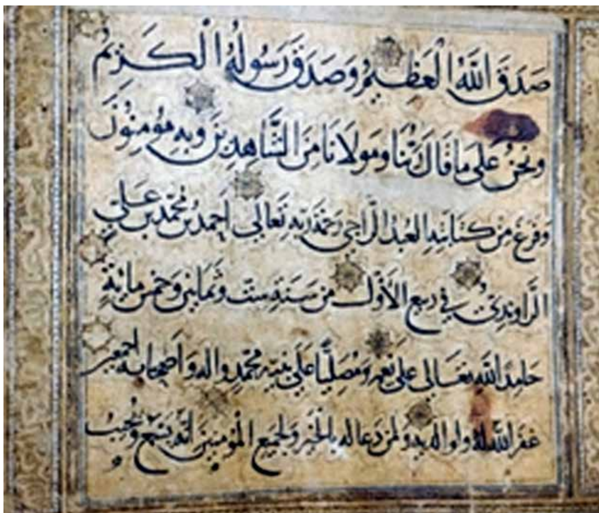
تصویر ۱. انجامه، قرآن کریم به خط احمد بن محمد بن علی الراوندی، تذهیب محمد بن علی بن سلیمان راوندی، سده ششم، کتابخانه آستان قدس رضوی (نامه بهارستان، ۱۳۹۲، ۱۴۸).

فرهنگ در بلادی بود که بر آن حاکم بودند. به طور کلی نه تنها در دربار، بلکه در شهرهای بزرگ هم «سلاجقه و شخصیت‌های بلندپایه آنان، عزمی قوی در ایجاد مدرسه‌ها داشتند. دانشکده‌هایی که علوم سنتی اسلامی در آن‌جا آموخته می‌شد و کارگزاران سلجوقی در آن‌ها به تحصیل می‌پرداختند» (هلین برند، ۱۳۹۱، ۸۶). این مدارس به تالیف کتب و گسترش علم می‌انجامید و برای تکثیر این کتاب‌ها، کاتبان و مذهب‌بان و تصویرسازان به کار و فعالیت گماشته می‌شدند و این فعالیت چه به صورت داخل منزل و در حجره‌ها کاتبان و نسخه‌پردازان و چه به صورت درباری یا در مکتب و مدارس بزرگ یا در گوشه‌ای از منزل، انجام می‌پذیرفت. از این روی