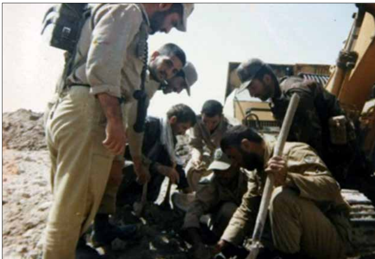
شکل ۶. عکس یادگاری هنگام تفحص شهیدا، منطقه طلاییه، ۱۳۷۵، ۱۰×۱۵ سانتی‌متر.

شکل گرفتن این میدان، این منطقه دارای اهمیت ویژه‌ای شد و بافت شهری در این منطقه متراکم شد. آن چه که پیداست ظهور واژه‌ها، مفاهیم و ارزش‌های جدیدی مانند آزاده، دفاع مقدس، جانباز، ایثارگر و... است. مفاهیمی که نوجوانان دهه ۶۰ با آن‌ها بزرگ شده‌بودند و اینک جوانی آن‌ها پر بود از خاطره شهیدان و آزادگان، قهرمانانی که اجازه تجاوز و تعرض به خاک وطن را به دشمن نداده بودند. عکس‌های یادگاری در کنار این میدان در آلبوم‌های دیگر خانواده‌های همشهری نیز دیده می‌شود. مصرف این نماد در عکس‌های یادگاری دیگر همشهریان با توجه به وجه نمادین آن تنها در آن دهه رخ می‌دهد. شاید به این دلیل که این میدان تنها خاطره خوش آن سال‌ها و رهایی از جنگ در این شهر جنگ‌زده بود. اما به سبب گذشت زمان و فرآیند عادی شدن نمادها، معنای این نماد و خاطرات مربوط به آن نیز روزبه‌روز کم‌رنگ‌تر می‌شود و شوق عکس گرفتن در کنار این یادمان از بین رفته‌است.