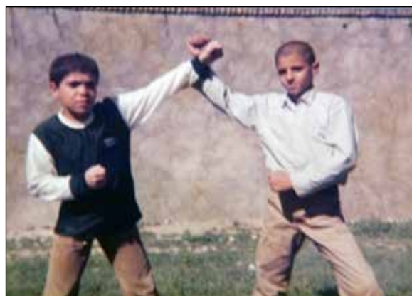
شکل ۳. عکس یادگاری مربوط به آلبوم خانوادگی، شهرستان دورود، ۱۳۶۰.

مشغول گرفتن ژست‌هایی بیشتر شبیه ورزش کاران رشته بدن‌سازی هستند که قدرت‌نمایی و عرض‌اندام می‌کنند. برای اولین بار دوربین دست گرفته و آزادانه روبه‌روی آن ژست گرفته‌اند. عکس‌های آن‌ها نمایش دنیای مردانه‌ای است که هنوز در آن قدم نگذاشته‌اند. بازتاب مفاهیم فرهنگی اجتماع خود هستند. عکس‌ها نمایش مردانگی و قدرت فیزیکی است. مفاهیمی که در آن سال‌ها بسیار بر آن تأکید می‌شد. جنگ، دنیای مردانه‌ای بود که تمام ذهن آدم‌های آن دوره را به خود مشغول ساخته بود. کشور به نیروی مردان برای مقابله با دشمن نیاز داشت. سیاست‌های حکومت هم‌راستا با ارزش‌هایی بود که در پس این عکس‌ها قابل مشاهده‌است. دولت والدین را به داشتن فرزندان بیشتر برای تأمین نیروی انسانی برای ادامه جنگ ترغیب می‌کرد. تعدد فرزند خصوصاً از جنس پسر برای جامعه آن روز مایه فخر و مباهات محسوب می‌شد و دولت هم در شکل گرفتن این الگو بی‌تأثیر نبود. شاید به نوعی بتوان عکس‌های این نوجوانان را با عکس‌هایی که رزمندگان در جبهه می‌گرفتند و برای خانواده‌های‌شان ارسال می‌کردند، یکی دانست. رزمندگان نیز جلوی دوربین ژست گرفته‌اند و اغلب یک سلاح که نشانه قدرت است در دست دارند و با ژستی توأم با اقتدار در مرکز کادر ایستاده‌اند. علاوه بر تأکید بر آن‌جا بودگی، این عکس‌ها برای چه چیزی گرفته شده‌اند؟ همان‌طور که هرش می‌گوید عکس‌های سردستی برای پاسخ به این پرسش که چرا گرفته شده‌اند، مهم هستند! شاید برای آن گرفته می‌شدند که با نمایش قدرت، نوید پیروزی را بدهند. خانواده‌ها با دریافت این اقتدار در عکس‌ها پیروزی و برتری رزمنده‌های ایرانی را حتمی می‌دیدند. عکس سمت راست