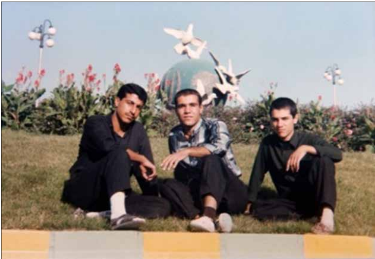
شکل ۵. عکس‌های یادگاری در کنار میدان آزادگان، شهرستان دورود. مربوط به ۱۳۷۰-۱۳۷۵، ۱۰×۱۵ سانتی‌متر.

برای خانواده‌هایشان می‌فرستادند صاحب صورت و اندام می‌شدند. عکس‌های رزمنده‌ها شمایل جدیدی از قهرمان بودند که با قهرمانان اسطوره‌ای و تاریخی از لحاظ ظاهری فرق داشتند. این قهرمان‌ها از قشرهای ضعیف‌تر جامعه بودند. ساده می‌پوشیدند به همین دلیل دست‌یافتنی‌تر بودند و یک نوجوان نیز می‌توانست شبیه یک قهرمان باشد. چه بسا تعریف قهرمان از نظر رهبر انقلاب ۳۳ و فضای حاکم بر جامعه این تصویر را در ذهن نوجوان ساخته باشد.