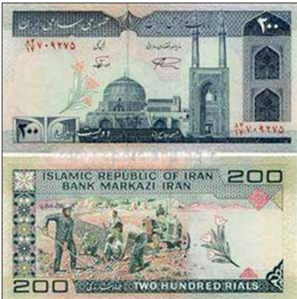
شکل ۸. تصویر اسکناس ۲۰۰ ریالی با تصویری از مسجد جامع یزد، جهادگران جهادسازندگی. چاپ اسکناس دهه ۷۰، ۶،۹×۱۴،۶، ۷۰ سانتی‌متر (URL2).

به این دلیل که هیچ تصویر ذهنی از فضای عکس نداشتیم و آدم‌های عکس برایم ناآشنا بودند. خصوصاً ماشینی که نمی‌دانستم چه کاربردی دارد. تنها چیزی که شبیه آن دیده بودم تصویر تراکتوری روی اسکناس بیست تومانی بود. تعدادی اسکناس بیست تومانی نوراً که از اقوام عیدی گرفته بودم در آلبوم عکس‌های کودکی‌ام گذاشته بودم. این عکس و این اسکناس هر دو متعلق به دهه ۷۰ هستند و در بستر آن زمان تولید شده‌اند.