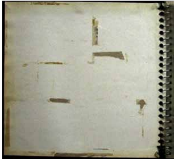
شکل ۱. پشت جلد آلبوم خانوادگی نگارنده، چسب‌های جای الصاق کارت‌پستال‌هایی از خوانندگان قبل از انقلاب است.

آلبوم عکس متعلق به خانواده من (نویسنده مسوول) است. خانواده‌ای مذهبی بدون هیچ‌گونه صبغه سیاسی نه در دوران انقلاب و نه در دوران جنگ، البته شهر دورود به‌طور مستقیم با مساله جنگ روبه‌رو بود و بارها مورد حمله هوایی قرار گرفت. اولین عکس خانوادگی آن یک پرتره استودیویی دسته جمعی است و متعلق به سال ۱۳۵۳ و آخرین عکس آن در سال ۱۳۸۵ عکاسی شده‌است. این آلبوم به دو آلبوم اصلی و چندین آلبوم فرعی دیگر تقسیم شده‌است که با رسیدن فرزندان خانواده به سن نوجوانی و ازدواج آن‌ها از آلبوم اصلی جدا شده‌اند. آلبوم‌های اصلی ساختاری جنسیت یافته دارند و به دو آلبوم زنانه و مردانه تقسیم شده‌اند. عکس‌های خصوصی خانواده به دلیل تقیدات مذهبی در آلبومی دیگر و نیز در آلبوم‌های شخصی اعضای خانواده قرار گرفته‌اند. آلبوم مورد مطالعه اسنپ‌شات با جلد چرم مصنوعی و صفحه‌هایی با کاور پلاستیکی است که ۹ عکس ۱۰×۱۵ در آن جا می‌گیرد. ترتیب قرارگیری این عکس‌ها در آلبوم دارای منطق زمانی نیست و در یک صفحه از آن عکس‌های مربوط به سه دهه ۱۳۶۰-۷۰- و ۸۰ دیده می‌شود. چیدمان عکس‌ها چندین بار به دلیل تعویض آلبوم توسط اعضای خانواده تغییر کرده‌است. آنچه که در این تغییرات مهم است، حذف برخی از عکس‌های این آرشیو است. همان‌طور که آنت کون می‌گوید نحوه قرارگیری و عکس‌های پنهان یا حذف شده به اندازه عکس‌های نمایش داده شده، مهم هستند. در این آلبوم جای چسب‌هایی که محل الصاق عکس در پشت جلد آلبوم است، قابل مشاهده است. عکس‌ها تا قبل از سال ۱۳۸۶ در این صفحه وجود داشتند. در واقع آن‌ها کارت‌پستال‌هایی از خواننده‌های مشهوری بودند که با استقرار دولت جمهوری اسلامی پس از انقلاب ۱۳۵۷ از ایران مهاجرت کردند و فعالیت خود را در کشورهای