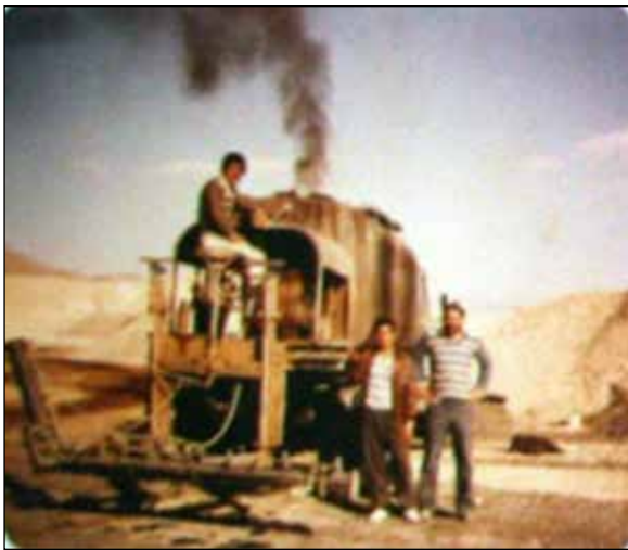
شکل ۷. عکس مربوط به آلبوم خانوادگی، دهه ۷۰، زنجان، مربوط به شرکت راهسازی پارادیس، ۹×۱۱ سانتی‌متر / رنگی.