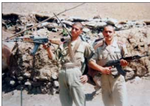
شکل ۴. منطقه عملیاتی جنوب، اواخر دهه ۱۳۶۰.