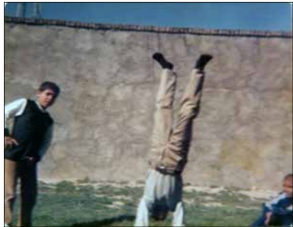
شکل ۲. عکس اسنپ‌شات از آلبوم خانوادگی، شهرستان دورود، ۱۳۶۰ ش. اندازه ۱۳×۹ سانتی‌متر با حاشیه گرد.

دین دو نوع کارکرد اجتماعی و کلی دارد؛ یکی تنظیم رفتار فردی برای خیر همگان، و دیگری برانگیختن احساس اشتراک و وحدت اجتماعی. از این‌رو، مناسک دینی همانند آیین عکاسی خانوادگی، بیان تکراری وحدت و کارکردهایی است که اشتراک اجتماعی را تحکیم می‌بخشد.