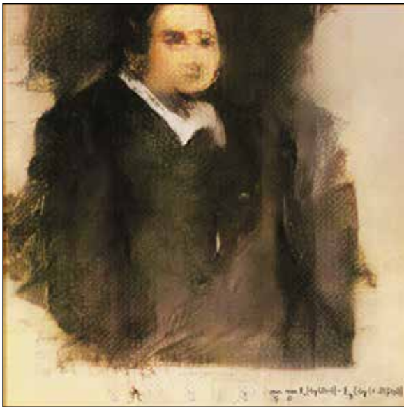
تصویر ۶. گروه واضح، پرتره ادموند دی بلامی (URL10).

آثاری پویاتر و تعاملی‌تر خلق می‌کند. فرایند تولید هنر توسط هوش مصنوعی بدین صورت است که ابتدا الگوریتم ماشین مجموعه داده‌هایی از آثار هنری را دریافت می‌کند سپس بر روی این مجموعه داده‌ها الگوریتم‌های یادگیری