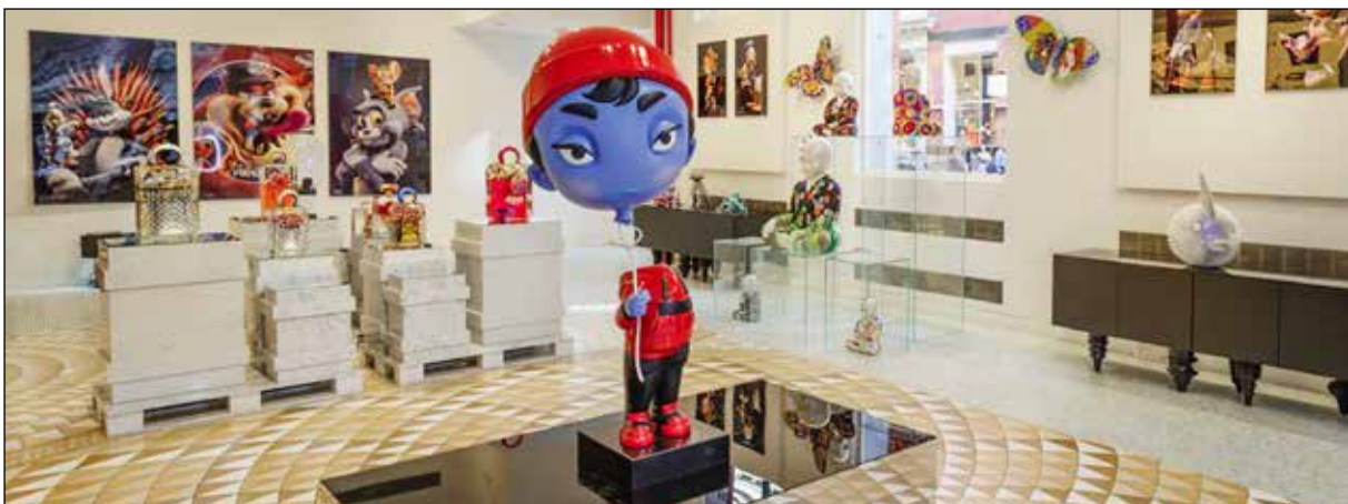
تصویر ۱۳. گال یوسف، نمایشگاه گالری ادن (URL19).

در واقع، نفی اصالت در هنر توسط سبک‌های پذیرفته شده، ارتباط تنگاتنگی با ساختارهای قدرت دارد که جهان هنر را شکل می‌دهند. دنیای هنر تحت تسلط قانون غربی است که هنر هنرمندان مرد سفیدپوست را بر هنر زنان، رنگین‌پوستان و هنرمندان فرهنگ‌های غیرغربی برتری می‌دهد. با توجه به جدول یک استراتژی ساختارهای قدرت در راستای حذف صداها و دیدگاه‌های هنرمندان به حاشیه رانده شده‌است. این به نوبه خود، این فرض را تداوم می‌بخشد که هنر تولیدشده توسط هنرمندان