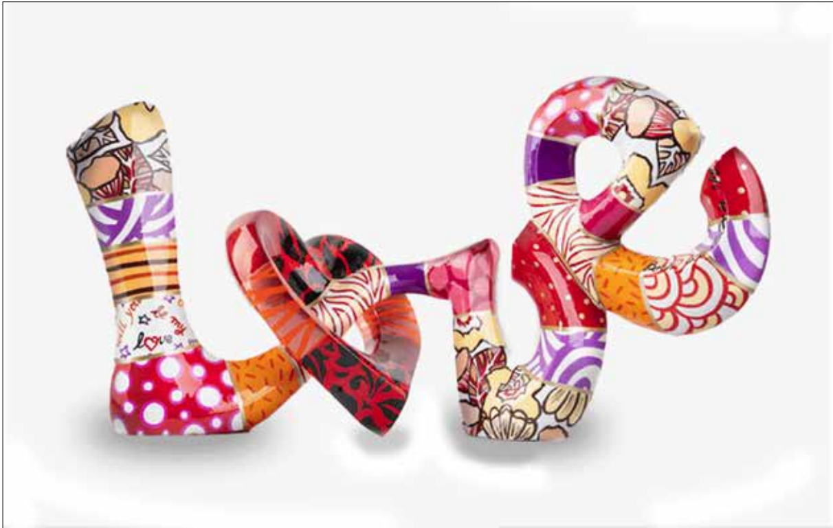
تصویر ۱۲. دوریت لوینستین ۳۴ ، مجسمه عشق جدید صورتی (URL18).

مرد سفیدپوست جهانی و جاودانه است، در حالی که هنر تولیدشده توسط هنرمندان دیگر نژادهای غیرغربی محدود به بافت فرهنگی آنان است (جدول ۱).