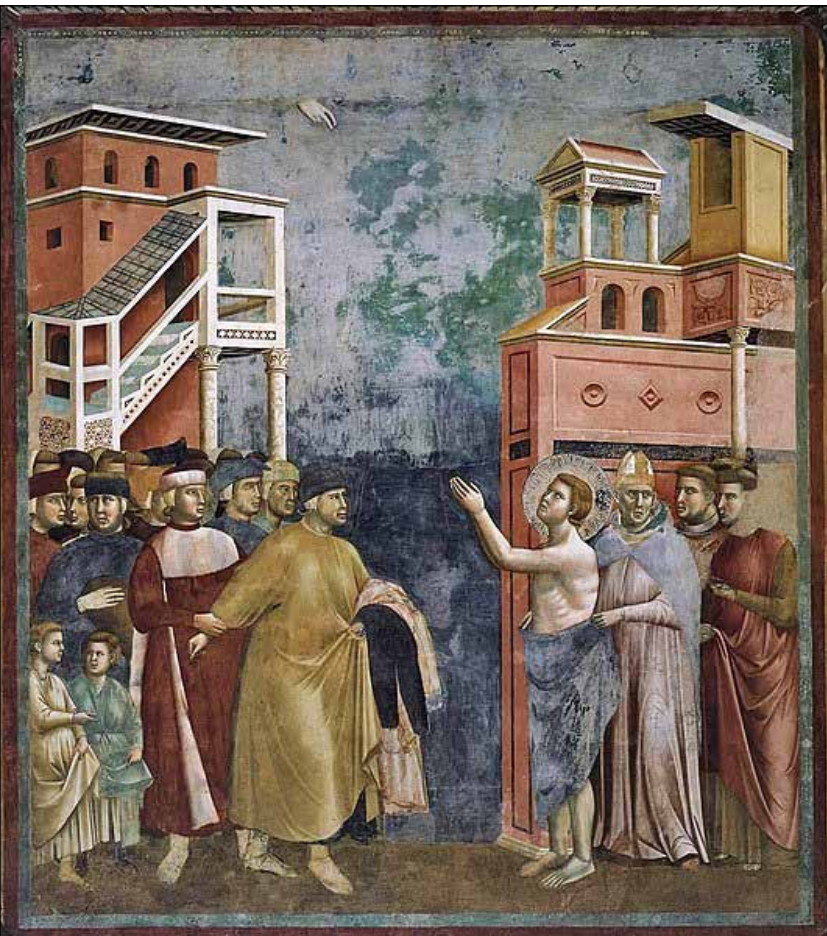
تصویر ۲. جوتو، افسانه سن فرانسیس در شهر آسیزی (URL2)