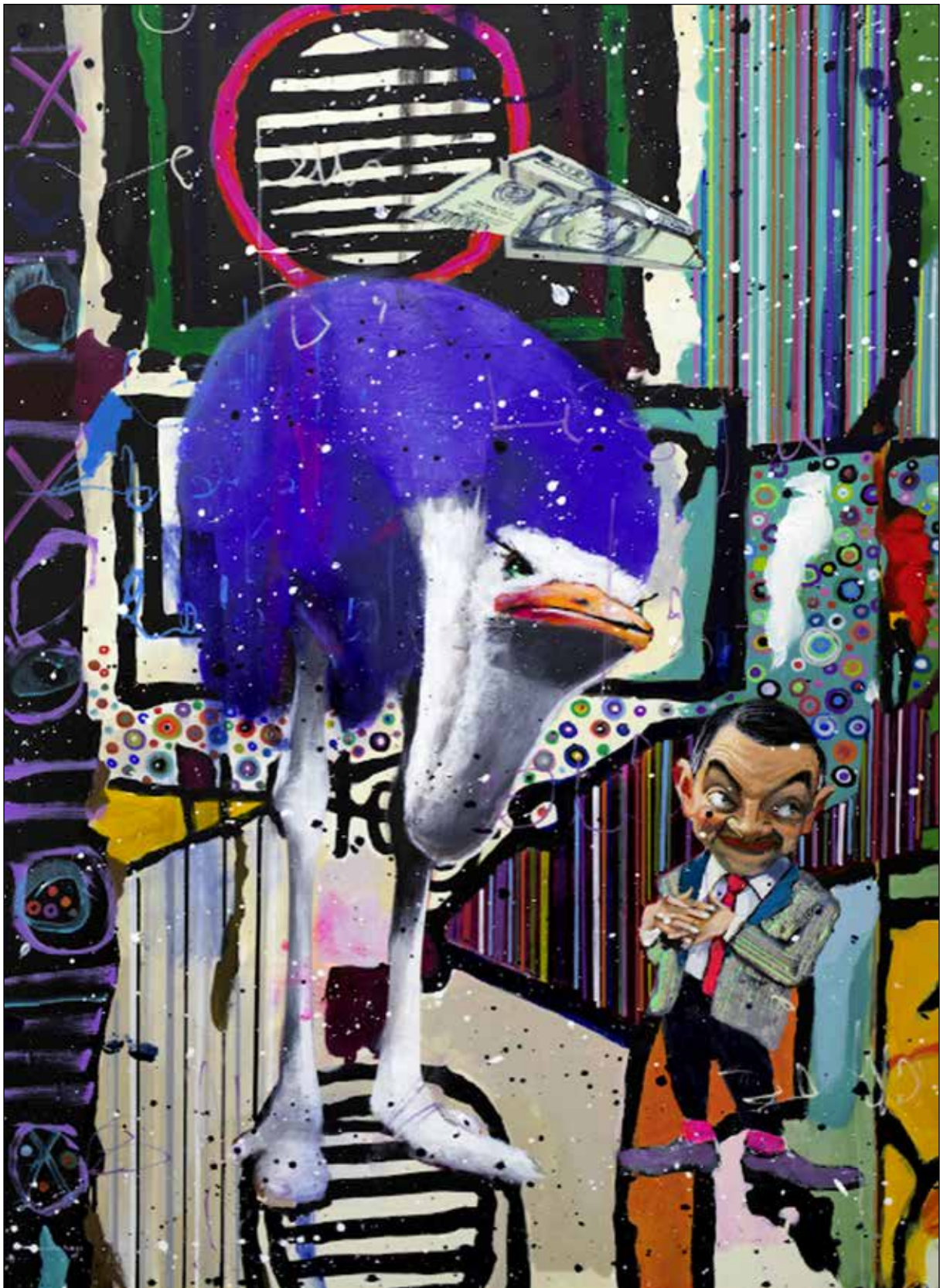
تصویر ۱۰. آنجلو، آکاردی ۲ ، نقاشی من سواری می خواهم (URL16). تصویر ۱۱. (صفحه روبرو). گال یوسف ۳ ، نقاشی اردک با گوشواره مروارید (URL17).