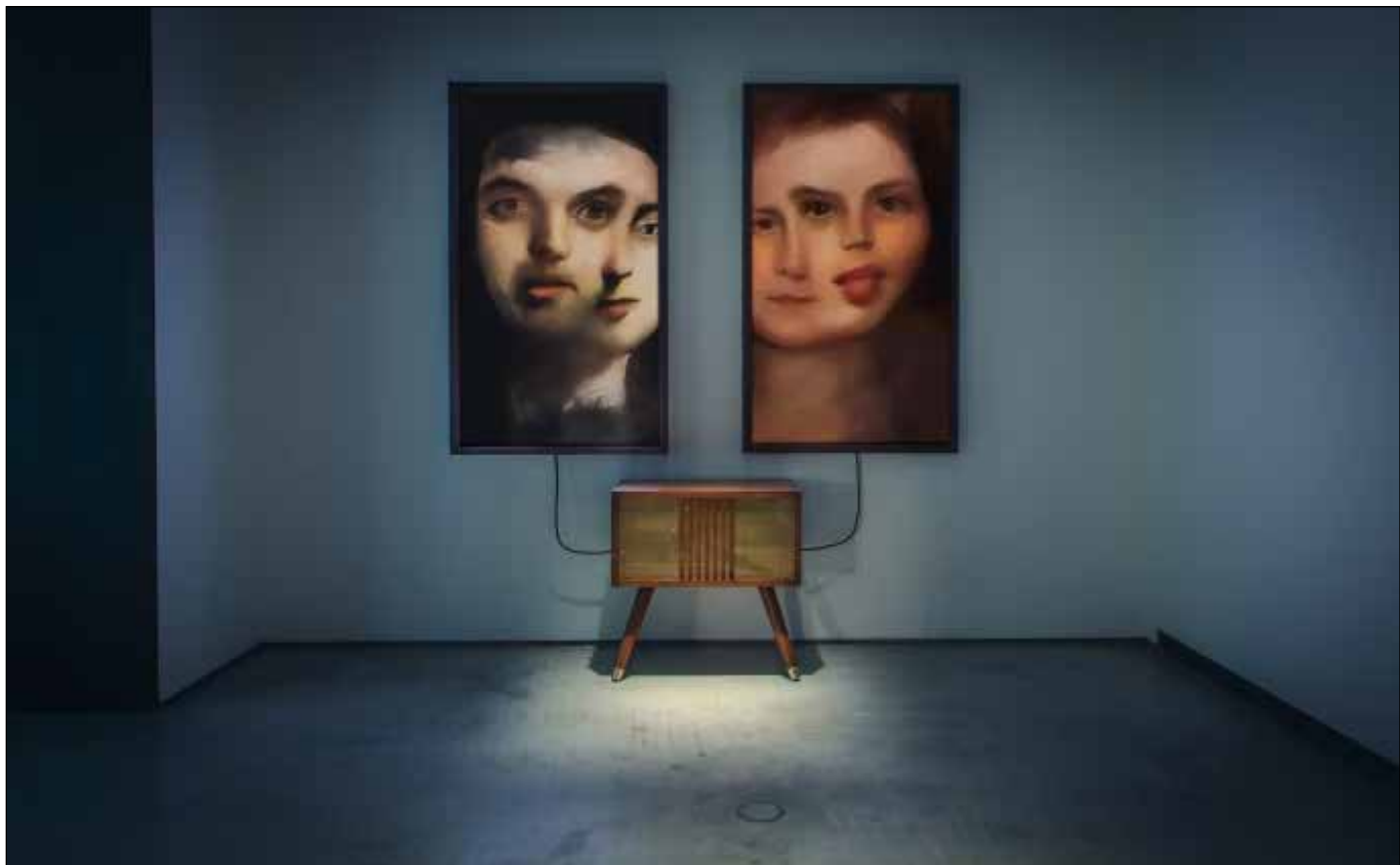
تصویر ۷. ماریو کلینگمن [Mario Klingemann]، خاطرات رهگذران (URL11).

هنر تجلی ناب خلاقیت و نبوغ انسان است. این همیشه چیزی بوده که ما انسان‌ها ذاتاً مال خودمان می‌دانستیم. هیچ موجود دیگری در این سیاره نمی‌تواند هنر خلق کند! این ماهیت صمیمی‌ترین افکار، احساسات ما است. هنر به ما این امکان را می‌دهد که منحصر به فرد بودن خود را بیان کنیم و نشان خود را در جهان به اصیل‌ترین شکل ممکن بگذاریم. اما در کمال تعجب، هوش مصنوعی سال‌هاست که برای خلق آثار هنری استفاده می‌شود. برخی از اولین نمونه‌ها به اواخر دهه ۱۹۷۰ برمی‌گردد. زمانی که آثار هنری تولیدشده توسط کامپیوتر در گالری‌ها و موزه‌ها ظاهر شدند. در دهه‌های اخیر، هوش مصنوعی به‌طور فزاینده‌ای پیچیده شده و از قابلیت‌های آن برای خلق آثار هنری واقعی‌تر و استفاده شده است (URL8). با هوش مصنوعی، عصر جدیدی از هنر معاصر در حال ظهور است. هوش مصنوعی توانایی تولید آثار هنری‌ای را دارد که هنجارهای دنیای هنر را به چالش می‌کشد و