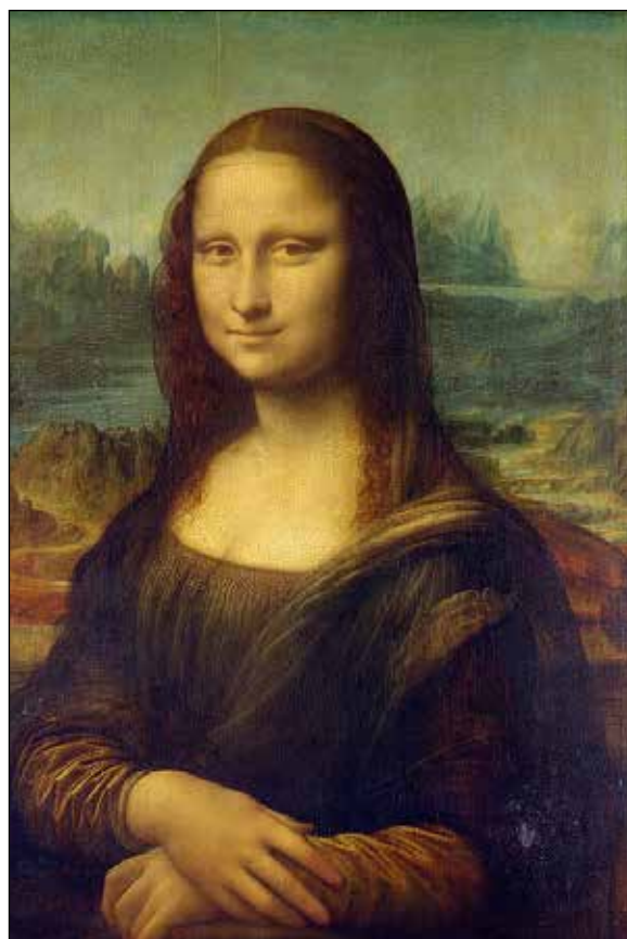
تصویر ۳. لئوناردو داوینچی، مونالیزا (URL3).

عصر رنسانس یک تغییر اساسی در درک هنر را رقم زد. هنرمندانی مانند لئوناردو داوینچی ۵ ، میکل آنژ ۶ و رافائل ۷ شروع به ادغام اومانیزم ۸ در آثار خود کردند، با تأکیدی تازه بر فرد، احساسات و دقت آناتومیک. مفهوم اصالت با تلاش هنرمندان برای به تصویر کشیدن دیدگاه‌های منحصر به فرد گسترش یافت. به بیان دیگر، استادان دوره رنسانس پیشرفته حرفه‌های تازه‌ای آفریدند که حق بیان خاص خود، شخصیت محترمانه خود و ادعاهای خاص خود را برای تأیید شدن از سوی بزرگان داشت (همان: ۴۱۶). معرفی پرسپکتیو و تکنیک‌های طبیعت‌گرایانه امکان ترکیب‌بندی‌های پیش‌گامانه و تصاویر واقعی‌تر را فراهم کرد. به طور قابل توجهی، «مونالیزا» اثر لئوناردو داوینچی نمونه‌ای از انحراف از پرتره است و موضوعی رموز را با ظرافتی بی‌سابقه به نمایش می‌گذارد (تصویر ۳).