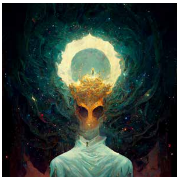
تصویر ۹. هنر هوش مصنوعی میدجرتی، آخرین تفنگچی بادوستش (URL14).