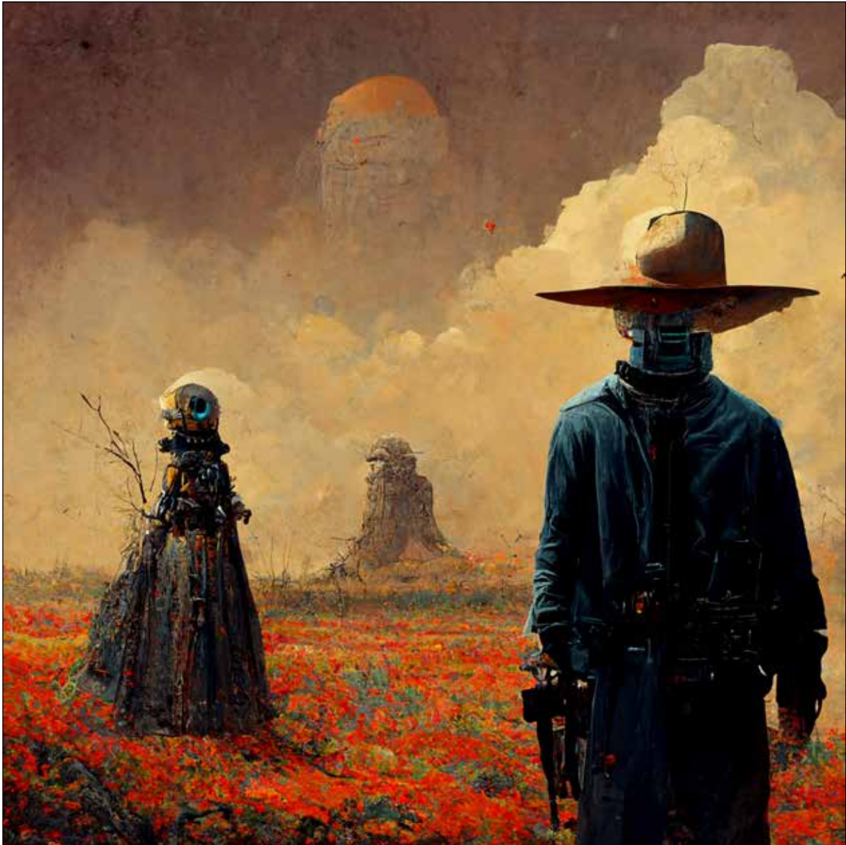
تصویر ۸. هنر هوش مصنوعی میدجرتنی ۳۴ ، آخرین تفنگچی با دوستش (URL13)