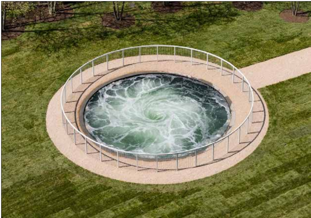
تصویر ۴. انیش کاپور، هبوط، بروکلین آمریکا (URL4).

ماهیت هنر پست‌مدرن ۲۱ ارجاع به عناصری است که پیش از این موجود بوده‌اند. اصالت در هنر دوران پسامدرن، نتیجه دیدگاه جهان هنر به اثر است. پس مفهوم یگانگی عینی به‌عنوان شاخصه ارزیابی اصالت برای این آثار جایگاهی ندارد (درخشانی، ۱۳۹۸: ۹۵).