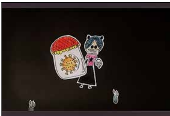
تصویر ۵. روشنا کنعانی، Being saved from covid-19 ، انیمیشن دو بعدی، ۱۳۹۸.