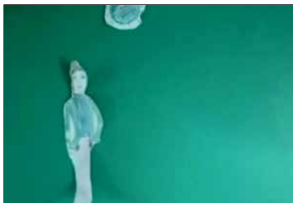
تصویر ۶. آرنوش خلیقی، Soap against covid-19، انیمیشن دو بعدی، ۱۳۹۸، (عکس از نگارنده).

مهم توسعه در هر کشور به‌شمار می‌روند، از عوامل مؤثر در موفقیت برنامه‌های توسعه شناخته می‌شوند. ویروس کرونا یکی از مواردی است که نه تنها فراموش نمی‌شود، بلکه می‌تواند تجربه‌ای همگانی برای زمان‌های بعد و به‌کارگیری در بسیاری از شرایط سخت باشد. تغییرات و دگرگونی‌های به‌وجود آمده در شیوه‌ها، عادات و به‌طور کلی سبک زندگی مردم و خانواده‌ها در دوران کرونا و به‌ویژه قرنطینه و استفاده از رسانه‌ها و فضای مجازی از موارد مهم و تاثیرگذار این رویداد بود.