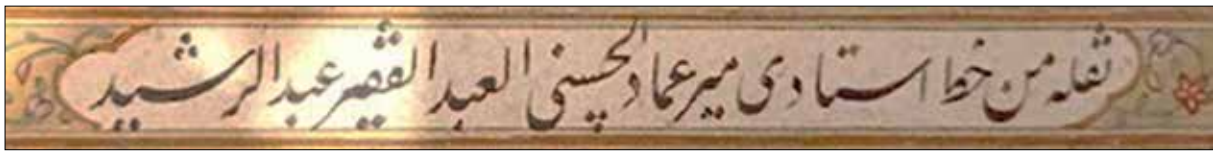
تصویر ۲. رقم «نقله» در اثری از عبدالرشید دیلمی، (آرشیو تصاویر نگارنده).

قلم کوچک و شبها در زیر نور چراغ، کتابت با قلم بزرگ انجام پذیرد.