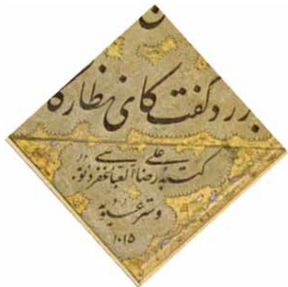
تصویر ۳. رقم «کتابه» در اثری از علی‌رضا عباسی، (آرشیو تصاویر نگارنده)

شیمیل، با مراجعه به فتوت‌نامه‌ها، درمی‌یابیم که از گذشته، «فروتنی» و «خلق نیک» می‌بایست از ویژگی‌های تمام علاقه‌مندان به هنرهای سنتی باشد. وی براساس گفته میرعماد که «بی طهارت مباحش یک ساعت»، داشتن وضو برای کتابت را لازم دانسته است. امروزه نیز هنوز سنت وضو گرفتن پیش از آغاز خوشنویسی در میان برخی اساتید رایج است.