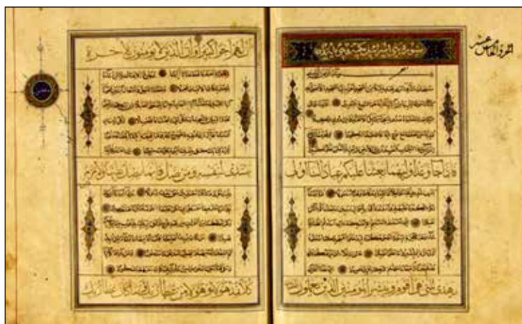
تصویر ۷. خوشنویسی نسخه خطی، (آرشیو تصاویر نگارنده).