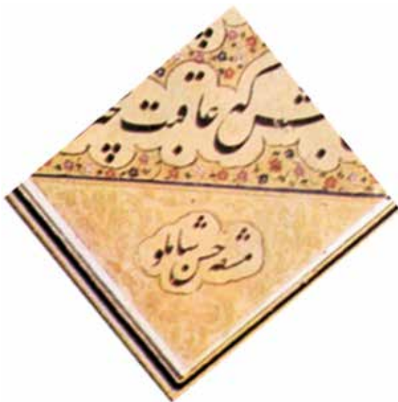
تصویر ۴. رقم «کتابه» در اثری از حسن شاملو، (آرشیو تصاویر نگارنده).