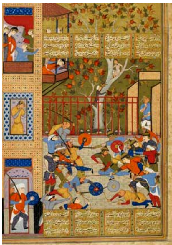
تصویر ۵. نگارگری در کنار خوشنویسی در شاهنامه بریتانیا.

خوانا، هنر یا حرفه خلق نوشتار خوانا یا زیبا؛ ۲) دست خط. وی اظهار می کند که تعریف نخست، دقیق تر است چرا که بر کیفیتی زیباشناسانه دلالت می کند نه هم چون تعریف دوم بر خصوصیتی فطری و ذاتی. در خصوص اظهار نظر وی درباره تعریف خوشنویسی، می توان گفت که تعریف اول صحیح تر است اما نه فقط به خاطر دلالت بر کیفیت زیبایی شناسانه زیرا خوشنویسی علاوه بر زیبایی، رعایت اصول و قواعدی را نیز شامل می شود. بلر در کتاب «خوشنویسی اسلامی»، در پی تعریف مشخص تری از خوشنویسی است یعنی خطی که نگارنده اش قصد دارد تاثیری زیباشناسانه در بیننده ایجاد کند. نوشتاری که نه تنها به واسطه محتوای معنایی اش پیامی را منتقل می کند، بلکه از طریق نمود ظاهری اش نیز سخن می گوید. هم چنین عقیده دارد که اهمیت کلام در تمدن اسلامی از پنج آیه نخست سوره علق آشکار می شود که عموماً آن را نخستین کلمات نازل شده بر پیامبر اسلامی دانسته اند. ۱ به بیان دیگر، معرفت نگارش، انسان را از دیگر آفریده های خداوند متمایز می کند و این دقیقاً همان توصیفی است که