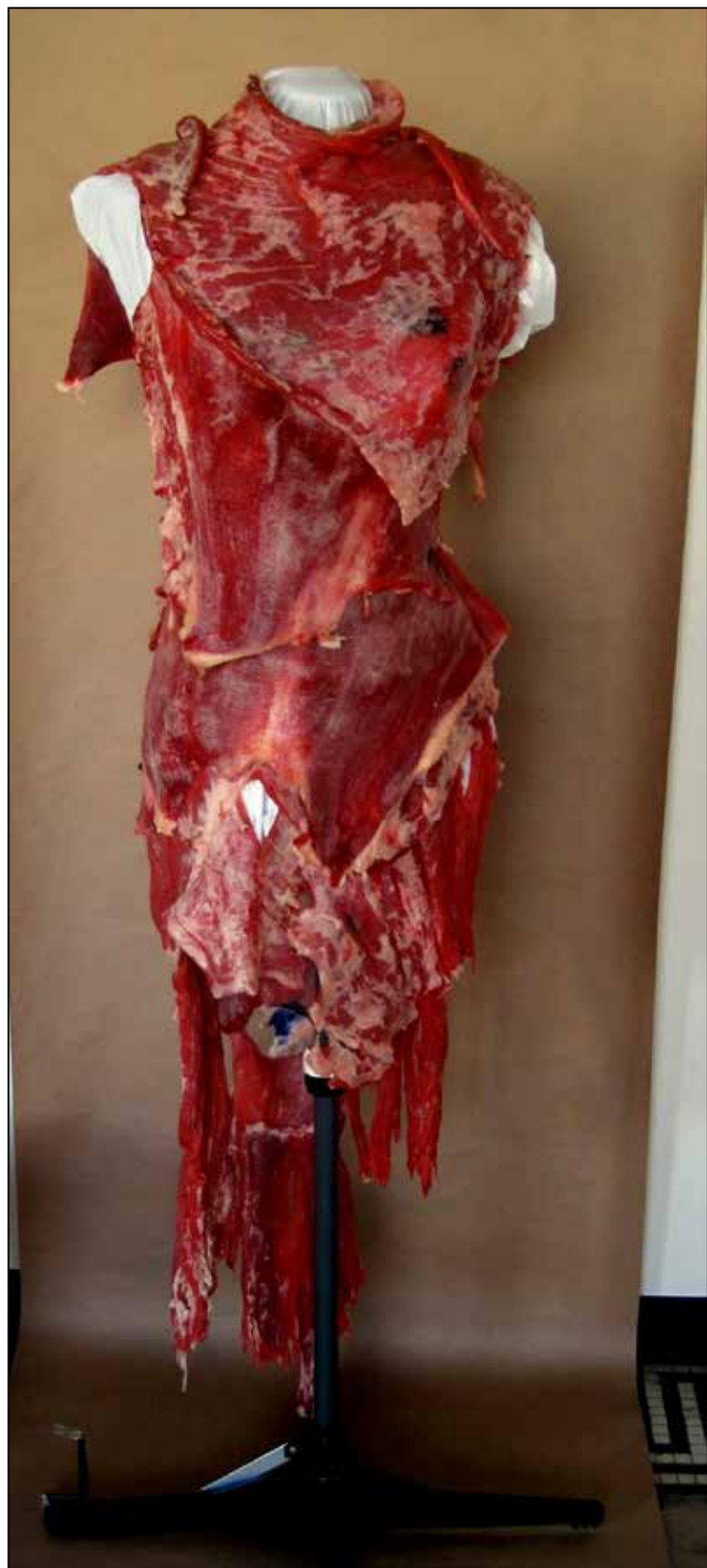
این صفحه و صفحه روبرو: تصویر ۱-۸ و ۲-۸ و ۳-۸: فرانک فرناندز، لباس گوشت خام برای لیدی گاگا، ۲۰۱۱م. (URL 3).

در قرن بیست‌ویکم، اما سلبریتی‌ها از جمله بازیگران، خوانندگان و ورزشکاران مشهور نیز از جمله افرادی هستند که با استایل‌های خاص خود تأثیر بسیاری در تغییر مسیر دنیای مد گذاشته‌اند. قطعاً در این میان لیدی گاگا ۲۴ خواننده پاپ، با استایل‌های جسورانه خود در سال‌های گذشته تأثیرات شگرفی داشته‌است. یکی از شوکه‌کننده‌ترین لباس‌هایی که لیدی گاگا به تن کرد، لباس گوشت خام از فرانک فرناندز ۲۵ ، طراح