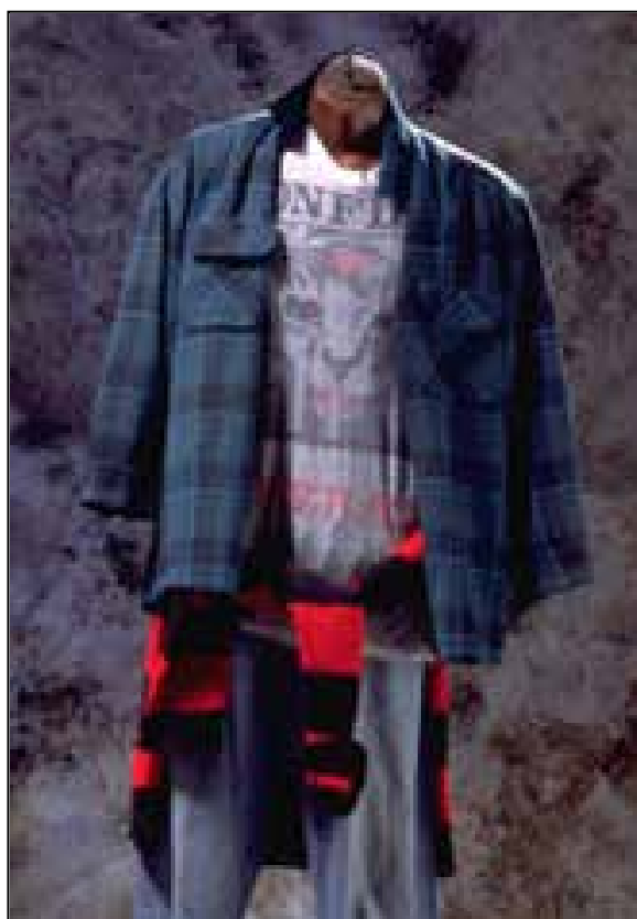
تصویر ۱۴: لباس گرانچ، موزه ویکتوریا آلبرت لندن، تاریخ نامعلوم، (مکنزی، ۱۳۹۴: ۱۲۲).

فلسفه اصلی کارهای مارتین مارجیلا، طراح بلژیکی، برمبنای ساختارشکنی شکل گرفته است. «تفکر ساختارگشایی در طرح‌های وی برگرفته از ترکیبی انتقادی است از نشانه‌ها و ایده‌های مختلف برای یک جدل مفهومی در باب سه عنصر اساسی طرح یعنی بدن، پارچه و لباس. شهرت او ابتدا در دهه ۱۹۹۰م. با ایده‌های مینی‌مالیستی چون آشکارسازی بافتار لباس و نمایش فرآیند ساخت لباس رقم خورد. نمایش کارهای او در این