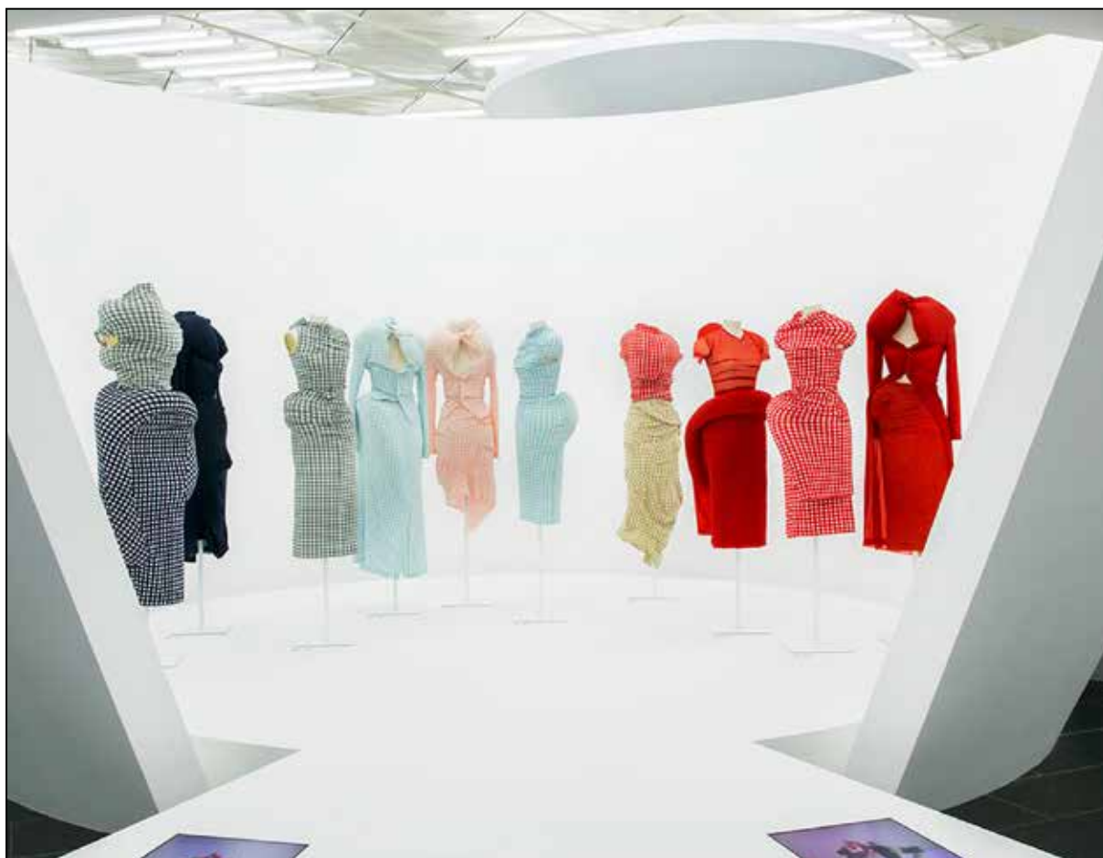
تصویر ۷: ری کاواکوبو، مجموعه مواجهه بدن با لباس و لباس با بدن، ۱۹۹۷م. (URL 2).

در مواقع غیرمنتظره می‌تواند پوشاننده را از شرایط ناگوار محافظت کند. (عابدینی‌راد، ۱۳۹۷: ۱۲۱-۱۲۲، تصویر ۵ و ۶).