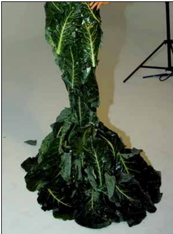
تصویر ۹ و ۱۰: گائو یوانیوان، لباس کاهو، ۲۰۱۱م. (URL 3).