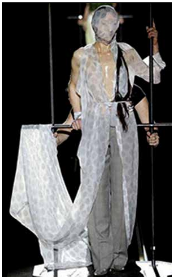
تصویر ۱۵: مارتین مارجیلا، مجموعه بهار و تابستان، ۲۰۰۶م.، (عابدینی‌راد، ۱۳۹۷: ۱۷۳).

فرهنگ‌ها، قومیت، نژاد و جنسیت) و حتی فرد تأکید دارند (نورانی و دیگران، ۱۳۹۳: ۵۶).