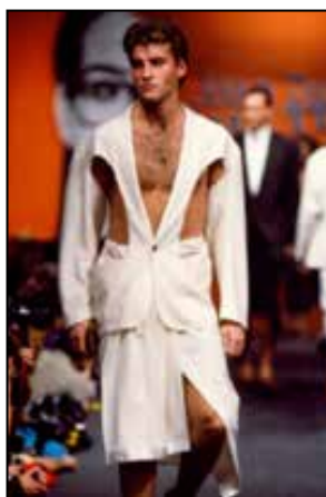
تصویر ۳ و ۴. ژان پل گوتیه، مجموعه ...و خدا مرد را آفرید، او در این مجموعه دامن را برای کت مردانه معرفی کرد، ۱۹۸۵م، (URL 1).

حقوق مدنی، ضد نژادپرستی، فمینیسم و غیره بود. در این میان خرده فرهنگ‌های چون هیپی‌ها ۱۵ در دهه ۱۹۶۰م. و پانک‌ها ۱۶ در دهه ۱۹۷۰م. در شکل‌گیری لباس مفهومی سهم به‌سزایی داشتند که در ادامه به آن‌ها پرداخته می‌شود.