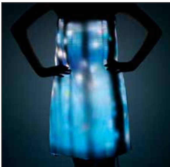
تصویر ۱۳: حسین چالایان، مجموعه هوابرد، ۲۰۰۷م. (عابدینی‌راد، ۱۳۹۷: ۱۵۶).

واکنشی در برابر سلطه‌یابی و زیاده‌روی در گرایش به مادیات دهه ۱۹۸۰م. بود. لباس گرانش متشکل از چندین لباس نامرتب و ناهمگون بر روی هم برای مردان و زنان بود (مکنزی، ۱۳۹۴: ۱۲۲، تصویر ۱۴).