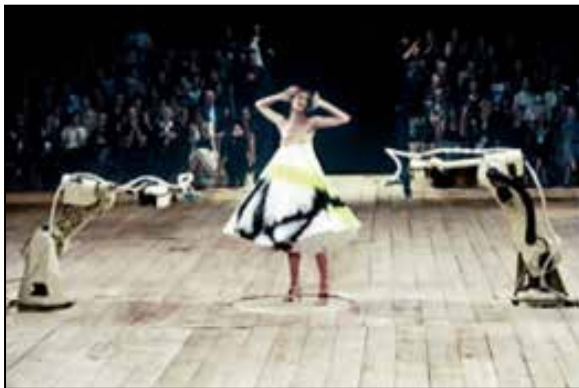
تصویر ۲. الکساندر مک کوئین، مجموعه بهار و تابستان ۱۹۹۹م. (Knox, 2010: 15).

و طراحان در عصر پست‌مدرن بدل شد. غارت بی‌امان و همیشگی سبک‌های «گذشته»، فرم اثری التقاطی به خود. ازدیاد تعداد نشریات مختص مد، پیشرفت‌های تکنولوژیک در زمینه تکنیک‌های سریع‌الوصول تولید لباس‌های حاضر و آماده، نیرومندی مدهای خیابانی، افزایش مجلات اختصاص یافته به خرده‌فرهنگ‌ها و تأثیر اینترنت، همگی به شکل‌گیری نظامی در مد انجامیده‌است که در آن توزیع و مصرف شتابنده، چندگانگی و پدیده‌های دوره‌گه فرهنگی حکمرانی می‌کند.