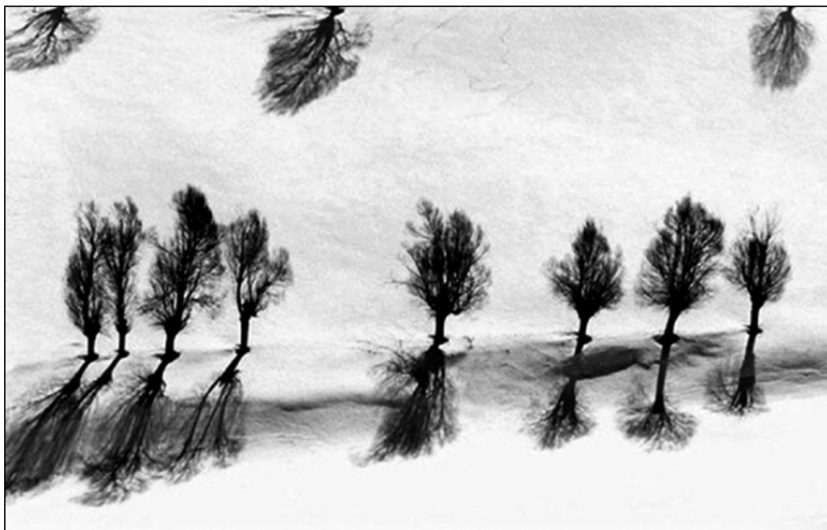
تصویر ۳. عباس کیارستمی، بدون عنوان، از مجموعه سفیدبرفی، دهه ۱۳۸۰ شمسی، چاپ دیجیتال روی بوم، ۲۳۰ در ۱۵۴ سانتیمتر، محل نگهداری: مجموعه شخصی هنرمند، مآخذ تصویر: (کیارستمی، ۱۳۸۵، ۸).

انسان‌ها در گذشته بر اساس نوع بافت محیطی یا اقلیمی و اجتماعی خود، ضمن استفاده عینی و عملی از موجودات بی‌جان و جان‌دار محیط (جماد، گیاه و حیوان)، روابط و مناسبات خیالی و نمادینی را هم نقش می‌زدند. در راستای این جریان، نشانه‌ها، نمادها، مفاهیم، باورهای اساطیری و کهن‌الگوها نیز رقم خوردند که به شکل‌گیری باورها و