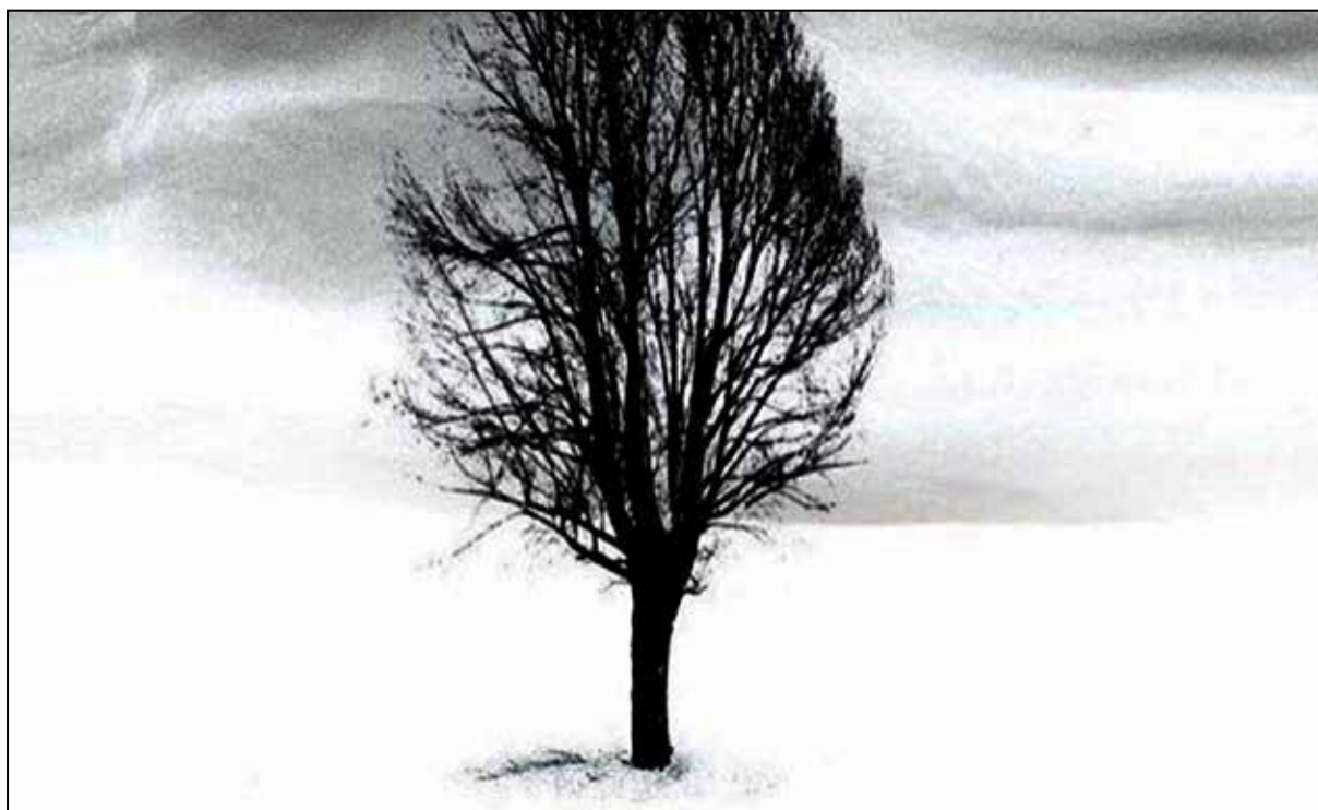
تصویر ۵. عباس کیارستمی، بدون عنوان، اواخر دهه ۱۳۸۰ شمسی، چاپ دیجیتال روی بوم، ابعاد: (نامشخص)، محل نگهداری: مجموعه شخصی هنرمند. (کیارستمی، ۱۳۸۵، ۳۱).

دارند که برخی از پیشوایان عرفان، به دلیل ایجاد رابطه‌ای سزّی با درخت، گاهی در زیر درخت به عروج و شهود می‌رسیدند (کلانتر و صادقی‌تحصیلی، ۱۳۹۵، ۷۰).