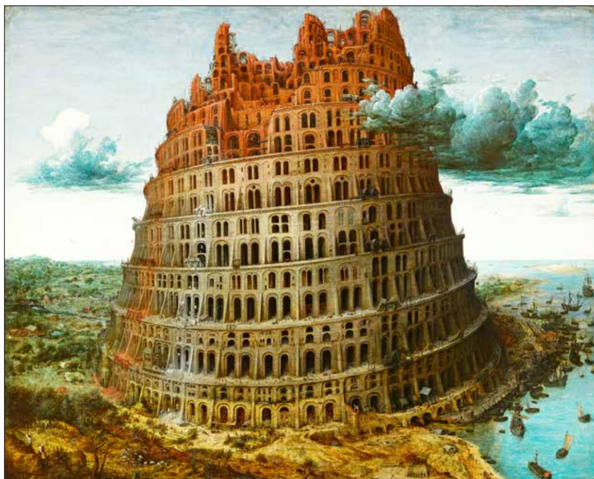
تصویر ۱. پیتر بروگل پدر، برج بابل، ۱۵۶۳، رنگ و روغن روی چوب، ۶۰ در ۷۴٫۵ سانتی‌متر.

است که دوست‌اش ابراهام اورتلیوس ۱۷ ، جغرافی‌دان، نقشه‌کش، و اومانیست شهیر قرن شانزدهم میلادی، پس از مرگ بروگل دربارهٔ او نوشت: «در تمام آثارش، همیشه چیزی بیش از آن‌چه به تصویر درآمده نهفته است» ۱۸ .