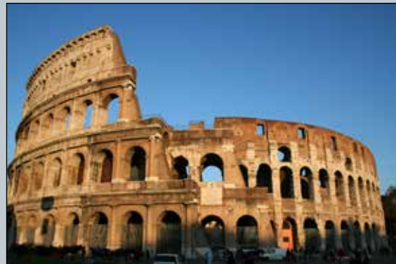
نمایی بیرونی کولوسئوم (ایتالیا/ رم).

نفر و ۸۰ درب ورودی داشته‌است. ساخت کولوسئوم توسط سپاسیان بین سالهای ۶۹ تا ۷۰ میلادی پایه‌گذاری شد. پس از آن پسرش تیتوس در سال ۸۰ میلادی کار ساخت آن را در زمین‌های باتلاقی میان تپه‌های اسکوتیلیا و کائین تمام کرد. البته پس از او دومیتیان (برادر تیتوس) در کولوسئوم تغییراتی اعمال کرد. به عنوان اولین آملی تئاتر دائمی در روم کامل کرد. امروزه بیش‌تر کولوسئوم را با تاریخ خونین نبرد گلادیاتورها در آن می‌شناسند. در کولوسئوم، گلادیاتور با یکدیگر یا با حیوانات وحشی می‌جنگیدند و اسباب سرگرمی تماشاچیان خود را (که اغلب از اشراف بودند) فراهم می‌کردند. برخی اعدام‌ها (مانند اعدام با رهاسازی حیوانات وحشی) نیز در کولوسئوم انجام می‌شده‌است.