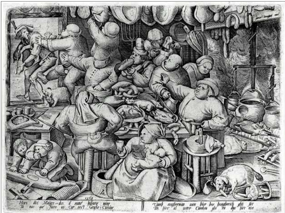
تصویر ۱. پیتر بروگل پدر، مطبخ فریه، ۱۵۶۳، رنگ و روغن.

شورای بازل در ۱۴۳۵ آن را ممنوع اعلام می‌کند ماهیت سکولار پیدا کرده، زمینه مذهبی خود را از دست می‌دهد، و مسئولیت برگزاری آن هم به انجمن‌های بلاغی سکولار واگذار می‌شود- نشان می‌دهد که تصویر بروگل تصویری از جشن ابلهان دومی، یعنی جشن ابلهان سکولار است، و سپس با بررسی نمادها و مقایسه این تصویر با طراحی دیگری موسوم به رقص ابلهان ۴۲ اثر فرانس هوگنبرگ ۴۳ و مشخص کردن وجوه تمایز دو تصویر، نتیجه مهمی می‌گیرد: این‌که در اثر بروگل فضیلت نه در گریز از نادانی، که در فهم آن است. و این نگاه را، که متفاوت است از نگاه هوگنبرگ، ماکسی نشئت گرفته از تنها یک منبع می‌داند: در ستایش دیوانگی [یا حماقت] ۴۴ ، نوشته اراسموس ۴۵ . ماکسی می‌نویسد: