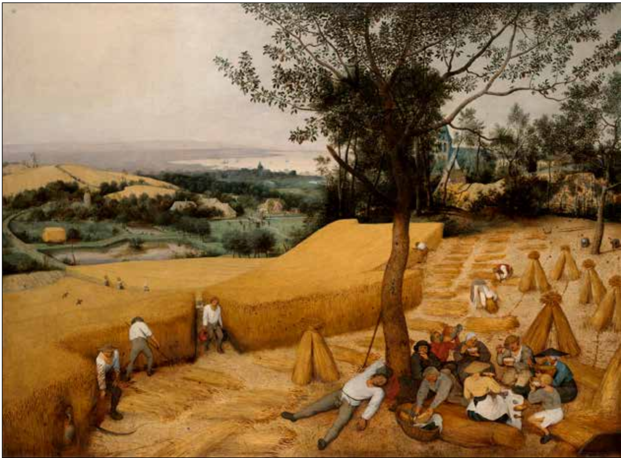
تصویر ۹. پیتر بروگل پدر، خوشه چینان، ۱۵۶۵، رنگ و روغن روی بوم، ۱۶۲ در ۱۱۹ سانتی‌متر.

فیوزلی گرفته، تا دیکنز و سوئیفت و بکت و کافکا و گراس، تجانس عنصر هیولایی و عنصر مضحک را به درجات مختلف می‌توان دید. گرچه گاه ممکن است وجه طنز غالب باشد و گاه وجه هولناک، اما هرگز یک‌سویه و محض نخواهد بود. اگر وجه هراسناک کاملاً بر اثر چیره شود، دیگر سروکارمان با جهانی گروتسک نیست. جهان گروتسک نباید چنان هراسی در ما برانگیزد که یارای مقابله با آن را نداشته باشیم. به بیان دیگر، «باید شبیه مؤمنانی باشیم که ایمان‌شان عمیقاً تکان خورده، اما یک‌سره از هم فرو نپاشیده است» (Harpham, 1976: 462). بدین ترتیب، می‌توان امر گروتسک را به‌طور خلاصه، این‌طور تعریف کرد: «امر گروتسک [از یک سو] احساس اضطراب برخاسته از [امر] کمیکی است که تا سرحد افراط پیش برده شده، و از سوی دیگر، غلبه بر اضطراب مواجهه با امور غیرقابل وصف است به کمک [امر] کمیکی» (Steig, 1970: 256). نهایتاً می‌توان چنین نتیجه گرفت که گروتسک نه یک ژانر یا گونه، بلکه نوعی ساختار است. ساختار جهانی که درباره وضعیت خود به پاسخ‌های درستی دست نمی‌یابد: «ساختار امر گروتسک متضمن واماندگی نظام‌های متعارف در فراهم آوردن راه حل‌های منطقی برای روابط متقابل بشری است» (Barasch, 1985: 6).