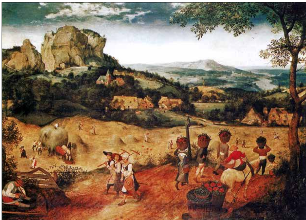
تصویر ۱۱. پیتر بروگل پدر، برداشت یونجه، ۱۵۶۵، رنگ و روغن روی بوم.

نقش اصلی را در تصویر گروتسک ایفا می‌کنند [...] این اعضا حتی قادرند خود را از بدن جدا کرده و حیات فی‌نفسه خود را داشته باشند، چرا که مابقی بدن را، هم‌چون چیزی ثانویه، پنهان می‌کنند (Denith, 1996: 226).