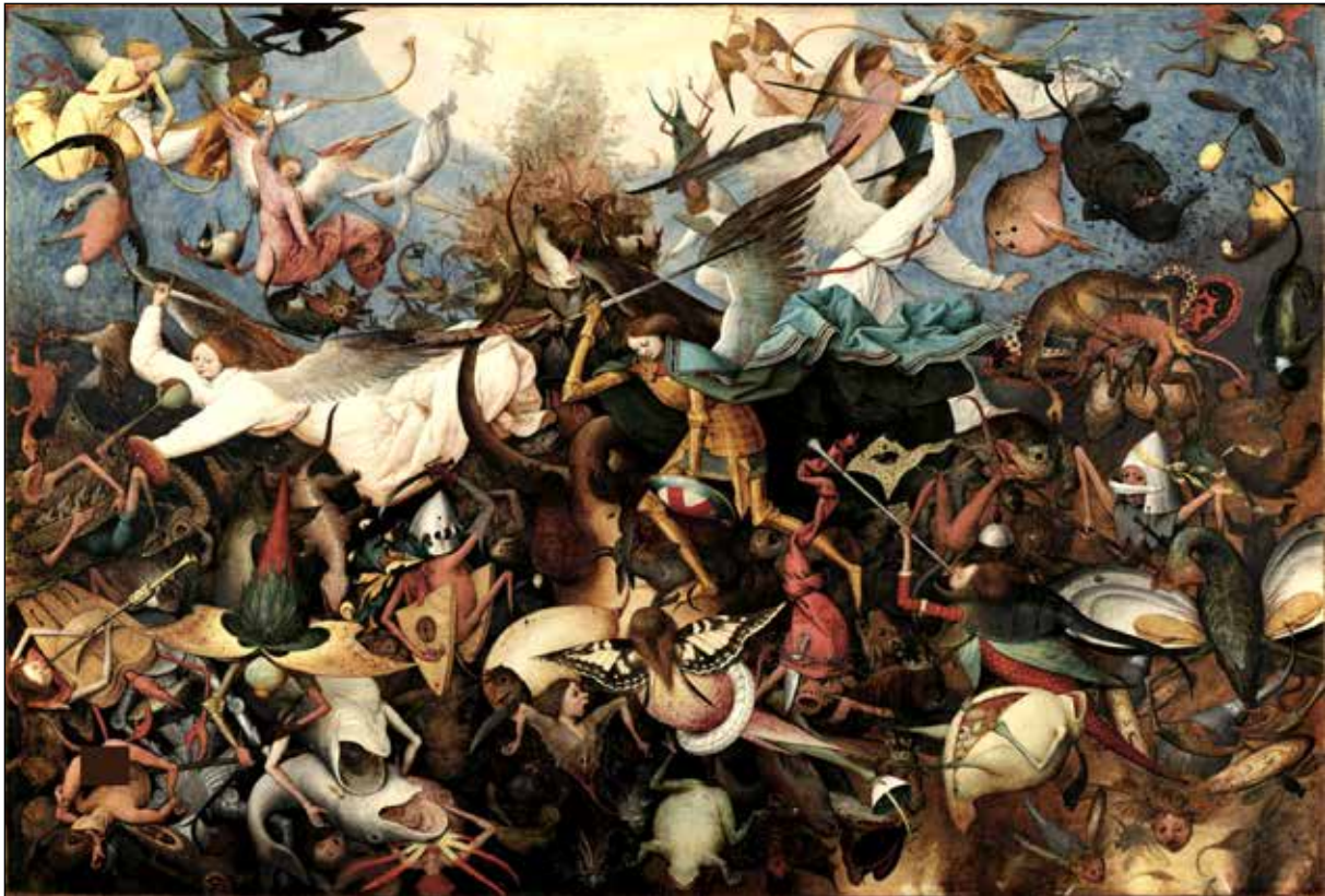
تصویر ۸. پیتر بروگل پدر، هبوط ملائکه یاغی، ۱۵۶۲، رنگ و روغن روی بوم، ۱۶۲ در ۱۱۷ سانتی‌متر.

جهان در امر گروتسک جایی است که حس آشنای امور که در اثر عادت در ذهن شکل‌گرفته کنار رفته و حضور هولناک خود را ناگهان آشکار و انسان را دچار نوعی هراس هستی می‌کند. «در امر گروتسک اعتماد و اتکای ما به جهان خویش از بین می‌رود و حس می‌کنیم که زندگی در این جهان دگرگون‌شده ناممکن است. امر گروتسک به جای ترس از مرگ، ترس از زندگی را القا می‌کند» (Harpham, 1976: 462). به این ترتیب ممکن است هر گونه اثر خیالی‌ای را چنین بپنداریم. اما در تمایز گروتسک با آثار خیالی [فانتزی]، کایزر اشاره می‌کند که «در مَثَل‌ها و قصه‌های پریان و امثالهم، جهان "بیگانه" نشده است، به این خاطر که عناصر موجود در آن‌ها، که برای ما طبیعی و آشنا هستند، ناگهان غریب و شوم نمی‌شوند» (ibid). و این تفاوت بسیار کلیدی است؛ چنان‌که مثلاً در مسخ کافکا ما با یک جهان خیالی مواجه نیستیم، بلکه با جهان هر روزه و عادی سروکار داریم. نویسنده حتی به جهت تأکید اشاره می‌کند که شخصیت اصلی خواب نمی‌بیند، بلکه در مختصات جهان هر روزه ما تبدیل به حشره شده است.