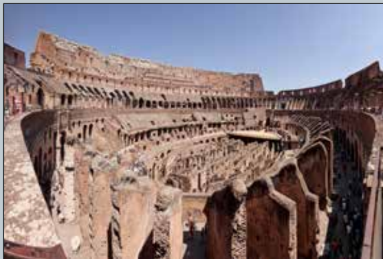
نمایی از داخل کولوسئوم (ایتالیا/ رم).