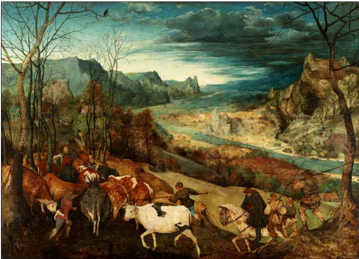
تصویر ۱۰. پیتر بروگل پدر، بازگشت گله، ۱۵۶۵، رنگ و روغن روی بوم، ۱۵۹ در ۱۱۷ سانتی‌متر.

به امری کمیک، که خندیدن به کل جهان، به هرچه در جهان رنگ‌وبویی از جدیت دارد: