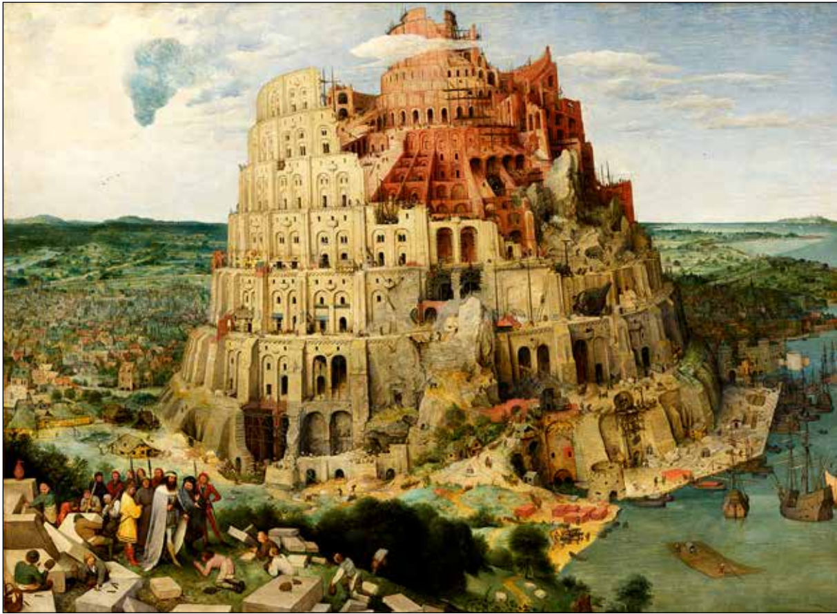
تصویر ۲. پیتر بروگل پدر، برج بابل، ۱۵۶۳، رنگ و روغن روی چوب، ۱۵۵ در ۱۱۴ سانتی‌متر.

نهانی هنرمند راه یابد» و «نقاب از چهره او برگردد تا فلسفه وی را دریابد». یا فرنکستل که در کتابش اذعان داشت بروگل هنرمندی مستلزم «رمزگشایی» است (Zagorin, 2001: 77,79).