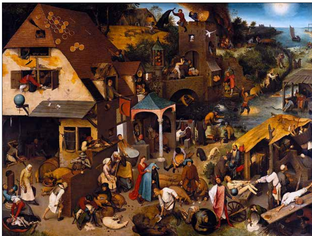
تصویر ۵. پیتر بروگل پدر، ضرب‌المثل‌های هلندی، ۱۵۵۹، رنگ و روغن روی چوب، ۱۶۳ در ۱۱۷ سانتی‌متر.

تُلّنی که این تابلو را نزاعی میان فضیلت و رذیلت می‌دانست، بروگل در این نزاع کارناوال و لنت، میان کاتولیک‌ها و پروتستان‌ها، در جایگاهی بی‌طرف و انتقادی نسبت به هر دو ایستاده است؛ یعنی در جایگاه یک اومانیسست (Stridbeck, 1956: 96-109).