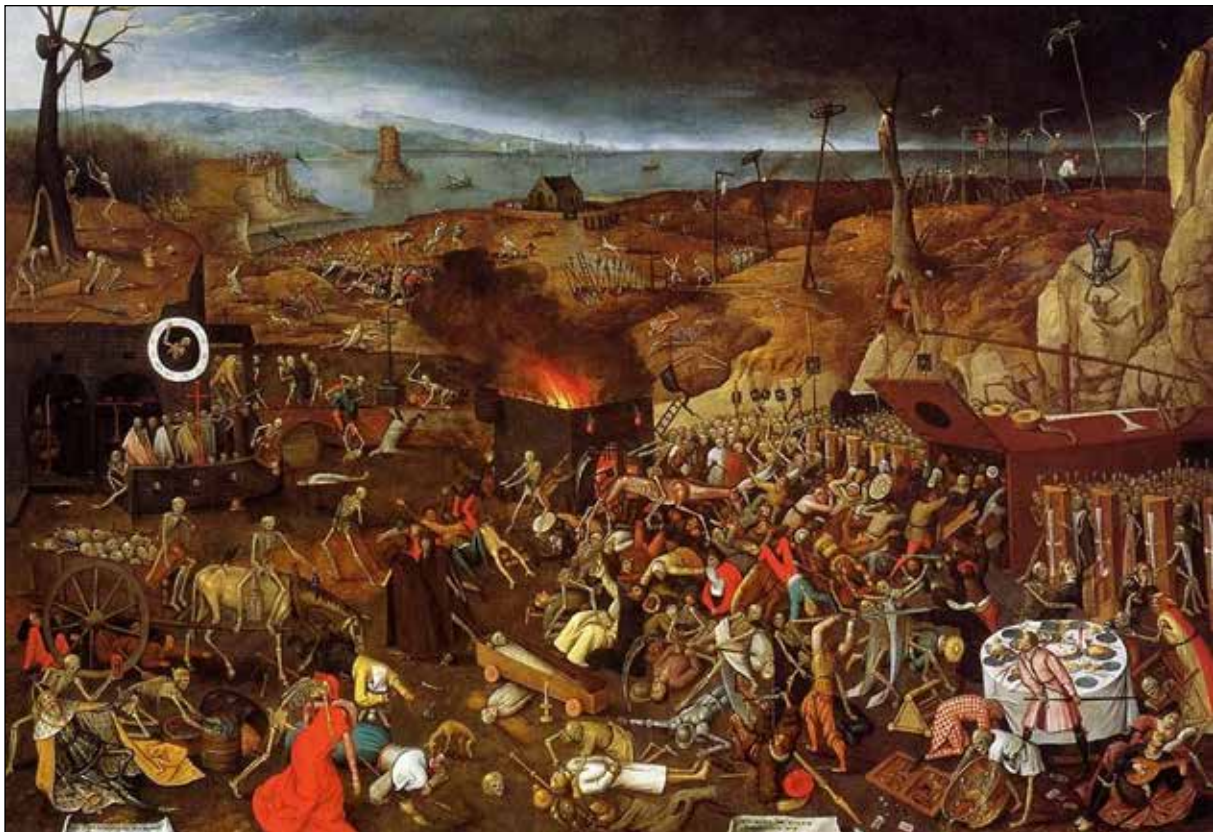
تصویر ۱۶. پیتر بروگل پدر، ظفرمندی (پیروزی) مرگ، ۱۵۶۲، رنگ و روغن.

بروگل چگونه این کار را در قالب تصویر درآورده و نتیجه‌اش به لحاظ بصری و مفهومی چیست؟