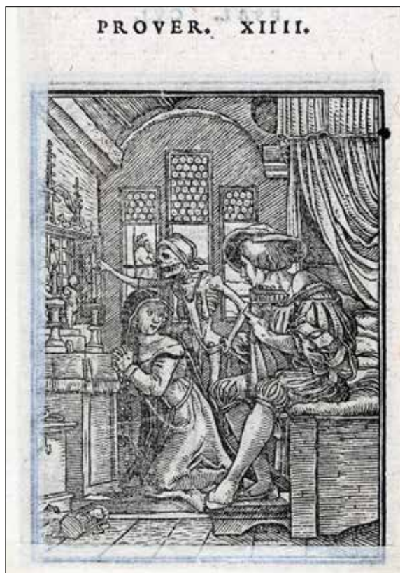
تصویر ۱۸. هانس هولباین، راهبه و مرگ، ۱۵۳۸.

از مفاهیمی که در مطالعه آثار بروگل به کار رفته، مفهوم امر گروتسک است. جهان در امر گروتسک جایی است که حس‌های آشنا را در اثر عادت در ذهن شکل گرفته کنار رفته و حضور هولناک خود را ناگهان آشکار و انسان را دچار نوعی هراس هستی می‌کند. در امر گروتسک اعتماد و اتکای ما به جهان خویش از بین می‌رود و حس می‌کنیم که زندگی در این جهان دگرگون شده ناممکن است. امر گروتسک به جای ترس از مرگ، ترس از زندگی را القا می‌کند، چنان‌چه در آثار بروگل می‌تواند چنین باشد. هراس و ترس اما تنها وجه امر گروتسک نیستند. عامل لازم دیگر مضحکه و طنز است، همان‌گونه که با ظرافت تمام، در بیشتر آثار بروگل دیده می‌شود. برخی از مفسران عرصه هنر، مفاهیم میخائیل باختین و قرآنتی شخصی او از امر گروتسک دارد را در برخی تفاسیر بروگل به کار برده‌اند. با وجود این‌که بسیاری از عناصر گروتسک باختینی نقاب، مرگ، جنون، دهان‌های باز، فعل‌وانفعالات بدنی، اندام‌های تحتانی و غیره در کار بروگل یافتنی است، اما تفسیر به اصطلاح «باختینی» بروگل، مشکل‌ساز است.