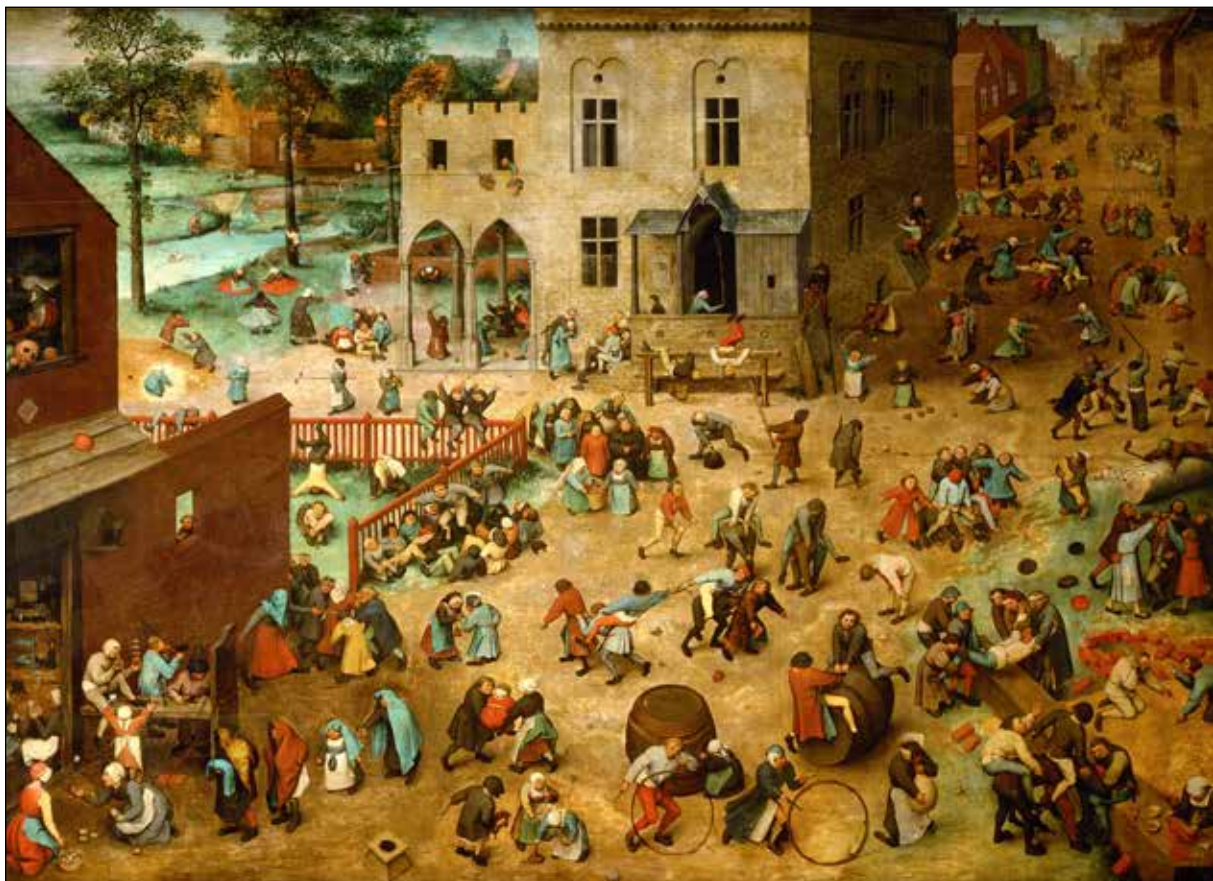
تصویر ۱۵. پیتر بروگل پدر، بازی‌های کودکان، ۱۵۶۰. رنگ و روغن روی تخته، ۱۶۱ در ۱۱۸ سانتی‌متر.

بنابراین تنها برشمردن نشانه‌های باختینی امر گروتسک در آثار بروگل ۸۳ بی‌معناست. مهم نتیجه‌ای است که باختین از نشانه‌ها می‌گیرد و باید دانست که نسبت دادن مفاهیم باختین به بروگل، در نهایت، به این معناست که او فرهنگ عامیانهٔ روستاییان و دهقانان را برابر فرهنگ به اصطلاح «والا»ی رسمی قرار می‌دهد و بر آن پیروز می‌کند؛ یا دست کم قصدش چنین بوده است. اما با توجه به آن چه در بخش اول دربارهٔ بروگل گفته شد، و مهم‌تر از آن، با نگاهی به خود نقاشی‌ها، می‌شود دید که این مسئله بسیار بعید است. به صرف وجود هیولاها و دهان‌های گشوده و اندام‌های تحتانی، دربارهٔ تابلوهایی مثل هبوط ملائکهٔ یاغی، نزاع کارناوال و لنت، و ضرب‌المثل‌های هلندی ۸۴ ، از منظر باختین، چه می‌توان گفت؟ چه نشانه‌ای مبنی بر تفوق فرهنگ عامیانه بر فرهنگ رسمی در این نقاشی‌ها می‌توان یافت؟ تقریباً هیچ. به موضوع تابلوها هم باید توجه کرد. حتی در خصوص تابلوهای دهقانی، مانند رقص دهقانان، عروسی روستایی [عروسی دهقانی]، و رقص عروسی، باید شواهد مستحکم اگر نه تاریخی، دست‌کم بصری داشت که بروگل جدا از «ثبت» و «فهم»، به «ستایش» آن چه تصویر کرده، و نیز «تقبیح» فرهنگ رسمی، که خودش هم احتمالاً عضوی از آن بوده است، می‌پردازد.