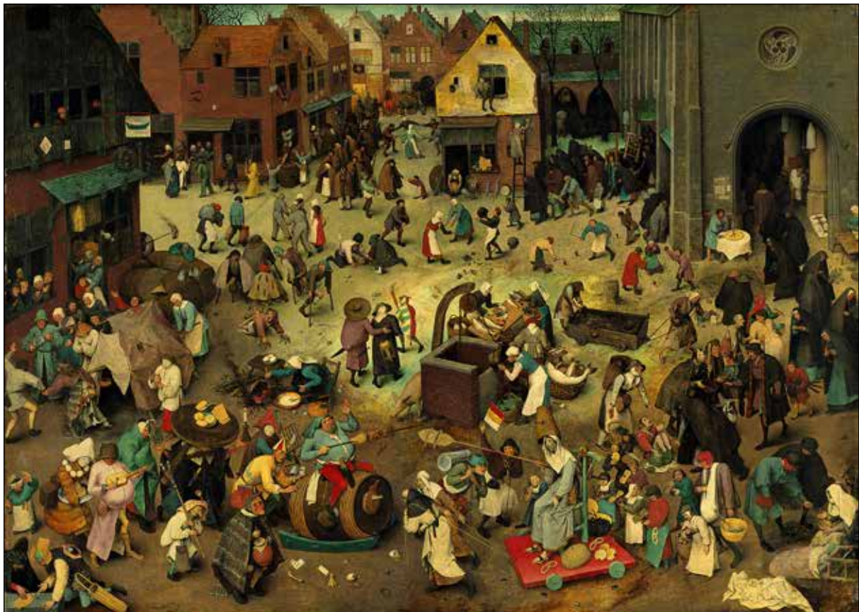
تصویر ۱۳. پیتر بروگل پدر، نزاع کارناوال و لنت، ۱۵۵۹، رنگ و روغن.

گفتیم که همین وضعیت خاص اشیاء، رویدادها، چهره‌ها و