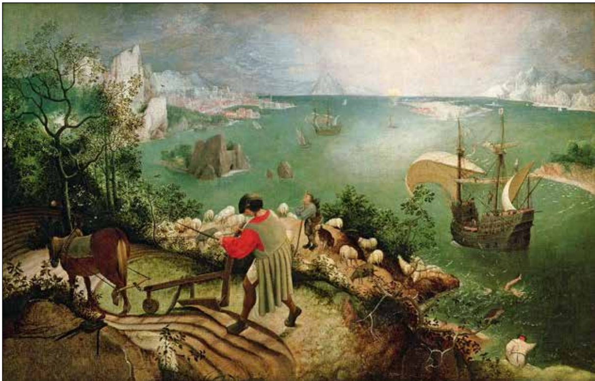
تصویر ۱۴. پیتر بروگل پدر، سقوط ایکاروس، ۱۵۵۸، رنگ و روغن روی بوم، ۷۳،۵ در ۱۱۲ سانتی‌متر.

شخصی خواندن کتابی است که به کارناوال پرداخته، و با در نظر گرفتن این امر می‌گوید که قیاس مبحث کارناوال در فرهنگ و ادبیات نباید به صدور احکام قطعی مانند آنچه باختین مطرح کرده بینجامد (این مطلب را می‌توان به هنرهای بصری نیز تعمیم داد). آخرین انتقاد او به باختین نیز مربوط به درهم‌آمیختن تاریخ واقعی و تغییر و تحولات تاریخ ادبیات با اسطوره است، و «با آن که هر کشمکش تاریخی از جنس کارناوال نیست، این که باختین همه کشمکش‌ها را تعمیم می‌دهد، به خارج از الگوی تغییر شکل‌های ادبی می‌کشاند و تکرارها را یکی می‌کند و در قالب مقوله‌ای ثابت و ساکن محصور می‌سازد، شگرد نقادانه‌اش را به شگردی مکانیکی بدل می‌کند» (همان: ۳۴-۳۵).