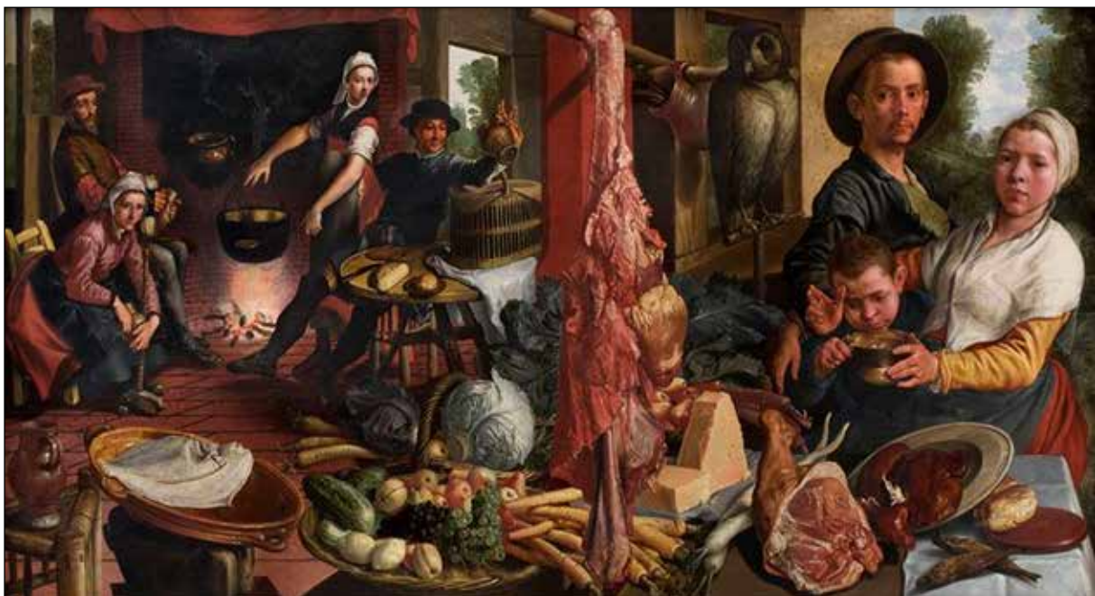
تصویر ۷. پیتر آرتسن، مطبخ فریه، ۱۵۶۵-۱۵۷۵، رنگ و روغن.

کمیک جنبه‌ای از انسان است که از آن نظر همانند یک شیء می‌شود، وجهی از رخدادهای انسانی است که انعطاف‌ناپذیری