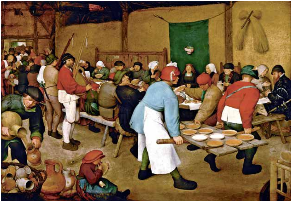
تصویر ۳. پیتر بروگل پدر، عروسی روستایی [عروسی دهقانی] ۱۵۶۸، رنگ و روغن روی چوب، ۱۶۴ در ۱۲۴ سانتی‌متر.

بودن طبقات فرودست، دهقانان و مراسم جشن و کارناوال ایشان. گفتیم که هنر بروگل را بسیاری از پژوهندگان، هنری تمثیلی و واجد وجوه قوی اخلاقی و پیام‌های آموزنده، نقدهای تند و تیز سیاسی و مذهبی دانسته‌اند. مثلاً سالیوان در مقاله‌اش به سال ۱۹۷۷ با مقایسه تطبیقی گریت سبک‌مغز ۲۸ (تصویر ۴) با یکی از طرح‌های خود بروگل به نام خشم ۲۹ از مجموعه هفت گناه کبیره ۳۰ ، شخصیت گریت را تمثیلی از دیوانگی (و معادل بصری شخصیت خشم در طراحی مذکور) دانسته و اشاره کرده که در متون و فرهنگ قرن شانزدهم، خشم لجام گسیخته و دیوانگی معادل هم بوده‌اند؛ دیگر پیکره اصلی تابلو، زنی که قایقی بر پشت گرفته، را نیز تمثیل نادانی برشمرده و ارتباط این دو (دیوانگی و نادانی) را طبق این دیدگاه اراسموسی شرح داده که نهایت دیوانگی را در مسیحیان ریاکاری می‌بیند که برای ارضای حرص و طمع خویش به جنگ می‌روند، و نقاشی را در نهایت هجو زمانه تلخ نقاش دانسته است (Sullivan, 1977: 55-66). او هم چنین در مقاله بلندبالای دیگری به سال ۱۹۹۱، ابتدا به این مطلب پرداخته که هنر بروگل در قرن شانزدهم کاملاً مطابق با ذوق مخاطبان اومانیزست زمانه بوده که اولاً باسواد بودند، و ثانیاً مراجع ادبی مورد استفاده بروگل را می‌شناختند و می‌توانستند بخوانند. سپس نشان می‌دهد که ضرب‌المثل‌های بروگل تنها محدود به ضرب‌المثل‌های مرسوم در ناحیه فلاندر نیست و متون کلاسیک و لاتین را نیز برای تفسیر آن‌ها باید جست‌وجو کرد (Sullivan, 1991: 431-46). سالیوان