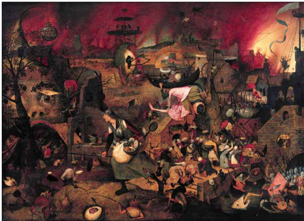
تصویر ۴: پیتر بروگل پدر، گریت سبک‌مغز [Dulle Griet (Dull Gret) also known as Mad Meg]، ۱۵۶۲، رنگ و روغن.

دیوید کونزل ۳۱ در مقاله‌ای چاپ ۱۹۷۷ به دو موضوع پرداخته؛ ابتدا تفاوتی قائل شده میان ضرب‌المثل‌های هلندی (تصویر ۵) بروگل (که شماری آن را تصویری از جهان باژگون دانسته‌اند و در قدیم نیز به این نام شناخته می‌شد) با مضمون «جهان باژگون» ۳۲ که در آثار چاپی و نقاشی آن دوره موسوم بوده و شرح داده که در آثار دسته‌آخر معمولاً موضوع یا قراردادی پذیرفته شده به شکل معکوس نشان داده می‌شود؛ مثلاً بچه‌ها در حال تنبیه پدر و مادر خود دیده می‌شوند، یا الاغی بر کالسکه نشسته و انسان‌ها مشغول کشیدن کالسکه‌اند. پس از اشاره به این اشتباه لفظی در مورد نقاشی بروگل که خودش عقیده دارد ناشی از وجود کره زمین معکوسی بر سر در یک ساختمان است به این مطلب می‌پردازد که آن دسته از نقاشی‌های بروگل که دهقانان و طبقات فرودست جامعه را به تصویر کشیده‌اند، «به هیچ عنوان واجد وجوه هم‌دلانه نیست و اتفاقاً برعکس، این تصاویر دقیقاً طبقات فرودست را از منظر اخلاقیات ماکیاولی‌وار [عبارت از خود کونزل است] طبقات فرادست جامعه بازتابی می‌کند» ۳۳