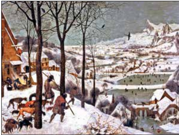
تصویر ۱۲. پیتر بروگل پدر، شکارچیان در برف، ۱۵۶۵، رنگ و روغن روی بوم، ۱۶۲ در ۱۱۷ سانتی‌متر.

متعلق به انتهای قرون وسطی و آخرین «بدوی» است، بروگل، در مقابل، نخستین «مدرن» است. ۶۸ یکی از مهم‌ترین وجوه تمایز کار آن‌ها، وجه بازی‌گوشانه و کمیک آثار بروگل، در مقابل جدیت تعلیمی بوش است. البته نه آن‌که جدیت در بروگل یافت نشود و بوش یک‌سره فاقد وجه طنز باشد. مثلاً نگاه کنید به حال‌وهوای مجموعه فصل‌های بروگل و حزنی که در فضای برخی از آن‌ها حاکم است. حزنی که البته حاصل نگاهی هم‌دلانه است. مثلاً توجه کنید به این موتیف در چهار پرده از این مجموعه: تابلوی خوشه‌چینان ۶۹ (تصویر ۹) و نگاه یکی از فیگورهای نشسته در پای درخت به ما/نقاش؛ گاو که در تابلوی بازگشت گله ۷۰ (تصویر ۱۰) سرش را برگردانده و انگار به ما/نقاش چشم دوخته؛ فیگور زن وسطی در مرکز تابلوی برداشت یونجه ۷۱ (تصویر ۱۱) که باز رو برگردانده به سمت ما/نقاش؛ و شاید تاثیرگذارترین آن‌ها، یکی از سگ‌های تابلوی شکارچیان در برف ۷۲ (تصویر ۱۲) که سر چرخانده و نگاه محزونش به ما/نقاش است. در این تابلوی آخر تقریباً تمام فیگورها پشت به تصویر دارند.