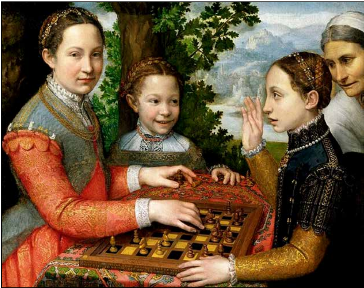
تصویر ۲. سوفونیزیا آنگوئیسولا، بازی شطرنج، ۱۵۵۵ م.، رنگ و روغن روی بوم، ۹۷*۷۲ سانتی‌متر، موزه ملی پرنان (URL 7).

عمر دارد، مردسالاری واژه‌ای قدیمی است که در یونانی حاکمیت پدر معنا می‌دهد. این واژه ابتدا برای توصیف اجتماعات شبانی تورات به کار رفت که در آن‌ها عملاً پدر بر اعضای خانواده حاکمیت مطلق داشت. معنای فمینیستی آن نسبتاً جدید و مربوط به زمانی است که کیت میه، در کتاب خود با عنوان «سیاست جنسی» (۱۹۷۰ م.)، آن را برای توصیف سلطه مردان بر زنان به کار برد» (لگیت، ۱۳۹۵، ۲۰).