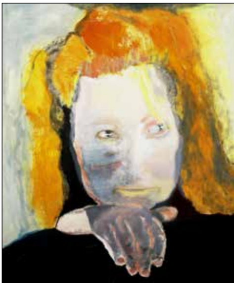
تصویر ۱۰. مارلین دوما، شیطان معمولی است، ۱۹۸۴ م، رنگ و روغن روی بوم، ۱۰۵×۱۲۵ سانتی‌متر، موزه وان آمبوزیم (URL 13).