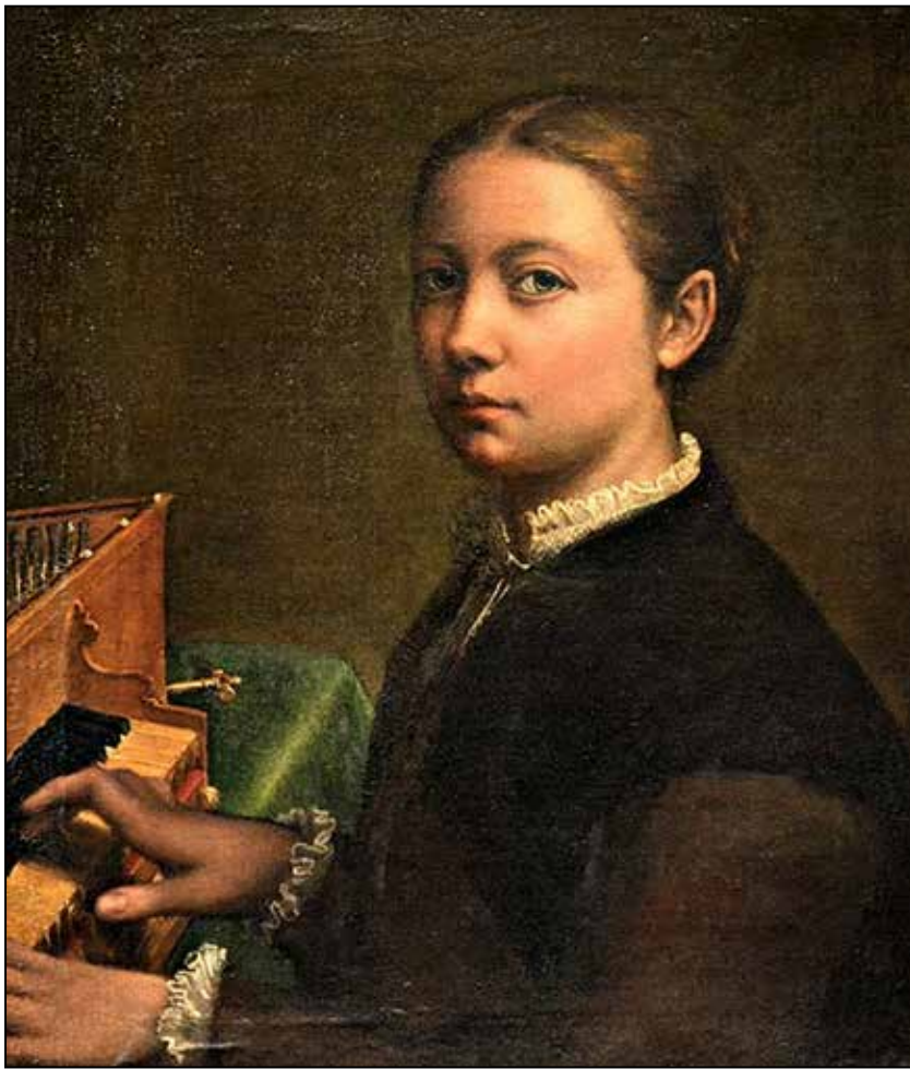
تصویر ۵. سوفونیزبا آنگوئیسولا، خودنگاره پای ارگ کوچک، ۱۵۵۵ م. رنگ و روغن روی بوم، موزه ملی کاپودیمونت (URL 10).