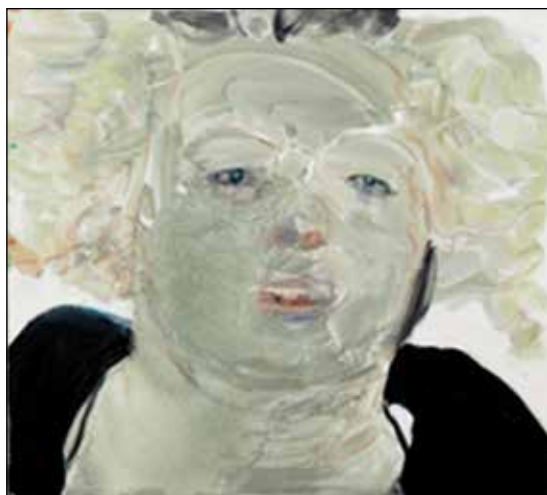
تصویر ۱۳. مارلین دوما، خودنگاره در ظاهر، ۲۰۰۸ م.، رنگ و روغن روی بوم، ۱۰۰*۹۰ سانتی‌متر، موزه دو پونت (URL 16).