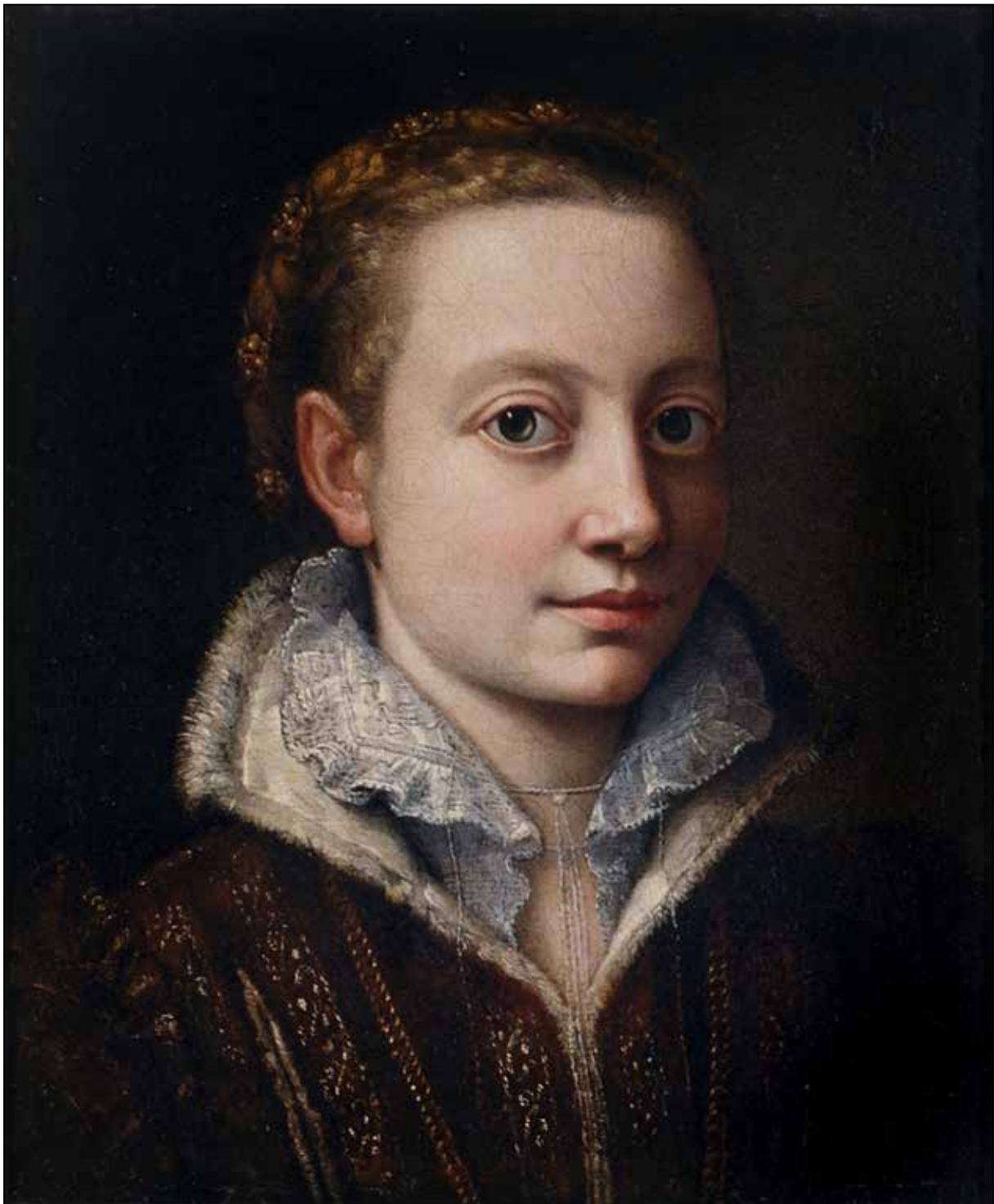
تصویر ۷. سوفونیزبا آنگوئیسولا، خودنگاره، ۱۵۶۰ م، رنگ و روغن روی بوم، ۲۹*۳۶ سانتی‌متر، گالری پیناکوتکا دی بررا (URL 11).

کشورهای دیگر اشاره دارند که موانع قابل توجهی بر سر راه خود ندارند. این زنان جوان مدرسه را به ظاهر در نهایت تساوی گذرانده‌اند، والدین و دوستانی دارند که مشوق آنها در رسیدن به موفقیت در هر زمینه‌ای که در آن تلاش می‌کنند هستند، برای مثال، ورود به کالج و دانشگاه یا