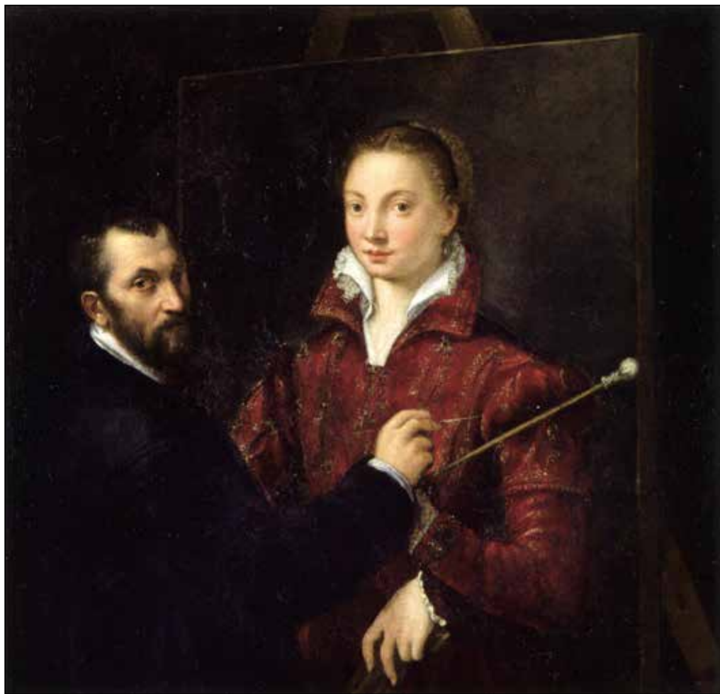
تصویر ۲. سوفونیزبا آنگوئیسولا، برناردینو کمپی در حال نقاشی از سوفونیزبا آنگوئیسولا، ۱۵۵۹ م، رنگ و روغن روی بوم، ۱۱۱*۱۱۰ سانتی‌متر، موزه پیناکوتسا نازیونال، (URL 8).

به معنای عدم وجود رنگ بود. و در ونیز اگر یک کارمند قصد سیاه پوشیدن در محل کار داشت می‌بایست اجازه رسمی برای آن می‌گرفت. این مساله ادامه داشت تا زمان مراسم ازدواج دو اشراف‌زاده در سال ۱۴۷۳ م. که منجر به این شد که رنگ سیاه برای ایتالیایی‌ها تبدیل به نمادی از ثروت و رفاه گردد و وقتی یکی از عروس‌های اشراف‌زاده با خود لباس‌های شب مخملی آورد، رنگ سیاه تبدیل به یکی از شروط اساسی مد برای افراد مرفه گشت. با این حال در فلورانس اولیه رنگ سیاه همچنان تداعی تاریکی و گناه و مرگ را با خود به همراه داشت و عمدتاً سیاه‌رنگی بود که راهبه‌ها و بیوه‌ها از آن استفاده می‌نمودند (Frick, 2002, 175).