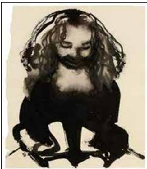
تصویر ۱۱. مارلین دوما، خودنگاره، ۱۹۹۴ م، جوهر و گواش روی کاغذ، ۴۰×۵۰ سانتی‌متر (URL 14).

دریافت مدرک تخصصی در زمینه مورد علاقه‌شان. آن‌ها در شغل‌های پر چالش و مفید پایه‌پای مردان استخدام می‌شوند و ظاهراً تا رتبه‌های بالا نیز به خوبی پیش می‌روند. چنین شرایطی بدون شک تنها به خاطر تلاش‌های سه موج قبلی از جنبش‌های زنان و مردانی که از قرن نوزدهم تا به امروز جنگیدند میسر شده است (Keohane, 1986, 156).