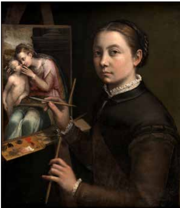
تصویر ۳. سوفونیزبا آنگوئیسولا، خودنگاره پای سه پایه، ۱۵۵۶ م.، رنگ و روغن روی بوم، ۵۷*۶۶ سانتی‌متر، موزه لانکات (URL 8).

«این حمایت‌ها متزلزل و همواره با محدودیت‌های سخت همراه بود. زنان تحصیل کرده موجوداتی خارق‌العاده بودند؛ گاهی از آن‌ها استقبال می‌شد و گاهی نیز مورد هتاکی و توهین قرار می‌گرفتند. آن‌ها محروم از فرصت‌ها و امکانات و پاداش‌هایی که به هم‌ترازان مردشان داده می‌شد، تمام انرژی خود را صرف پذیرفته‌شدن می‌کردند... زنان نقاش به شیوه‌هایی ظریف ابراز وجود می‌کردند؛ به موضوعات مورد پذیرش پناه می‌بردند یا از ژانرهای سنتی به سود خود بهره می‌گرفتند. حتی شجاع‌ترین آن‌ها برای ادامه زندگی و معاش خود می‌بایست حمایت لازم را کسب می‌کرد» (لگیت، ۱۳۹۵، ۱۱۱ و ۱۱۲).