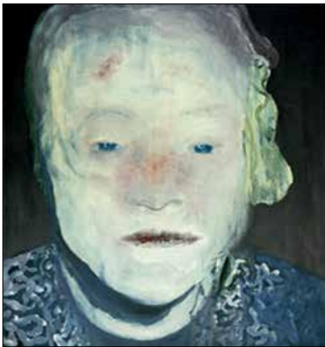
تصویر ۸. مارلین دوما، بیماری سفید، ۱۹۸۵ م، رنگ و روغن روی بوم، ۱۱۰،۵×۱۳۰،۵، گالری پل آندرس (URL 12).