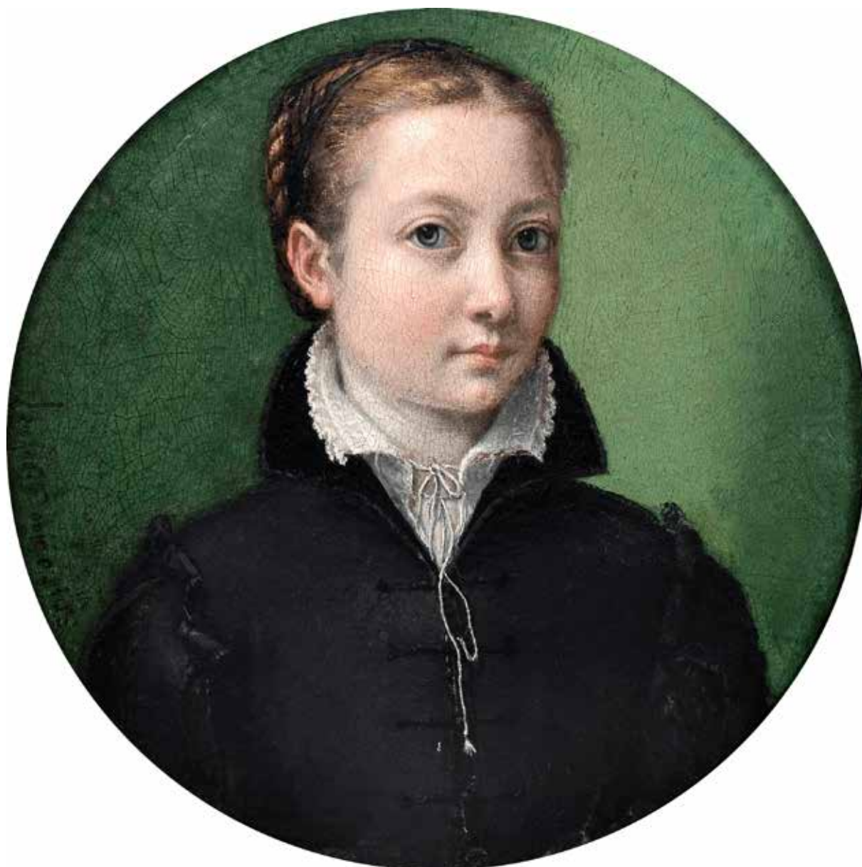
تصویر ۱۲. سوفونیزبا آنگوئیسولا، خودنگاره، ۱۵۵۸ م.، رنگ و روغن روی تخته چوبی، ۱۳،۲*۱۳،۲ سانتی‌متر، مجموعه هنری کاستودیا فاندریشن (URL 15).