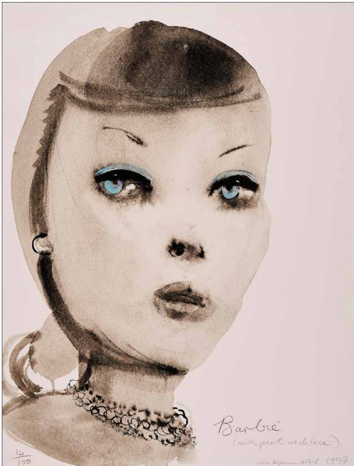
تصویر ۹. مارلین دوما، باربی اصل، ۱۹۹۷ م.، جوهر هندی و مداد روغنی روی کاغذ، ۲۷/۴۸*۶۶ سانتی‌متر، موزه جدید هنرهای معاصر نیویورک (URL 7).