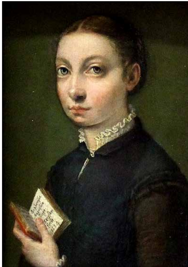
تصویر ۱. سوفونیزبا آنگوئیسولا، خودنگاره، ۱۵۵۴ م، رنگ و روغن روی تخته چوبی، ۰٫۸*۱۴٫۵*۱۹٫۵ سانتی‌متر، موزه تاریخ هنر وین، (URL 6).