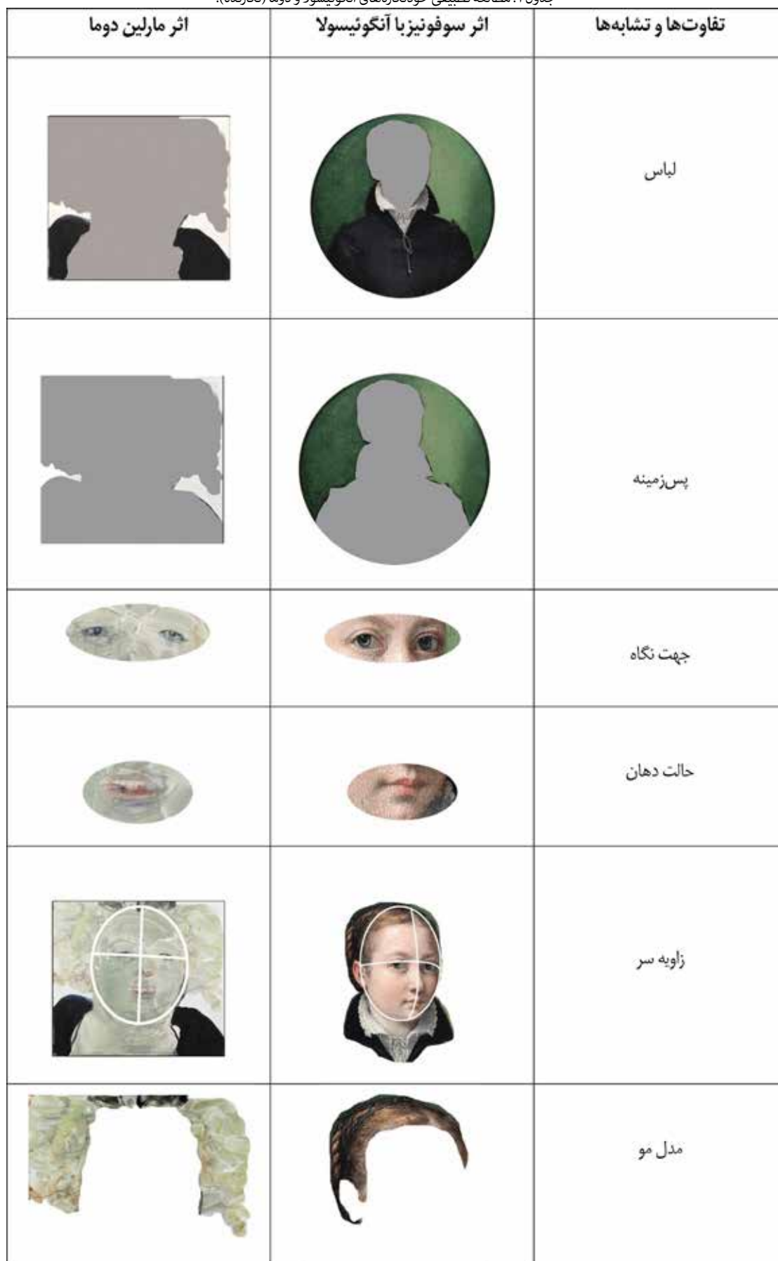
جدول ۱. مطالعه تطبیقی خودنگاره‌های آنکوئیسولا و دوما (نگارنده).