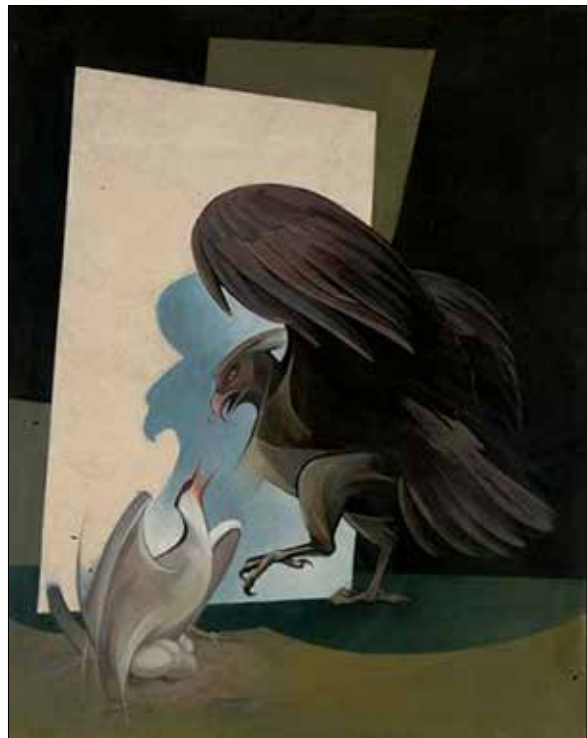
تصویر ۴. ایرج اسکندری، دفاع مقدس، ۱۳۶۷، رنگ روغن روی بوم، ابعاد نامشخص (URL).

پرده «اسارت» (تصویر ۶) اثر نمادینی از این هنرمند است که بر تمایل هنرمند به کم‌گویی و بی‌رنگی تاکید می‌کند. اسکندری در این اثر با سادگی تمام و فقط با چند پرنده مفهوم آزادی و اسارت را به نمایش گذاشته است. میله‌های سیاه یک قفس بر پس‌زمینه‌ای سیاه، راه آزادی را بر پرنده‌ای بسته است. کبوتر سفید و مغمومی با چشم‌های باز روی