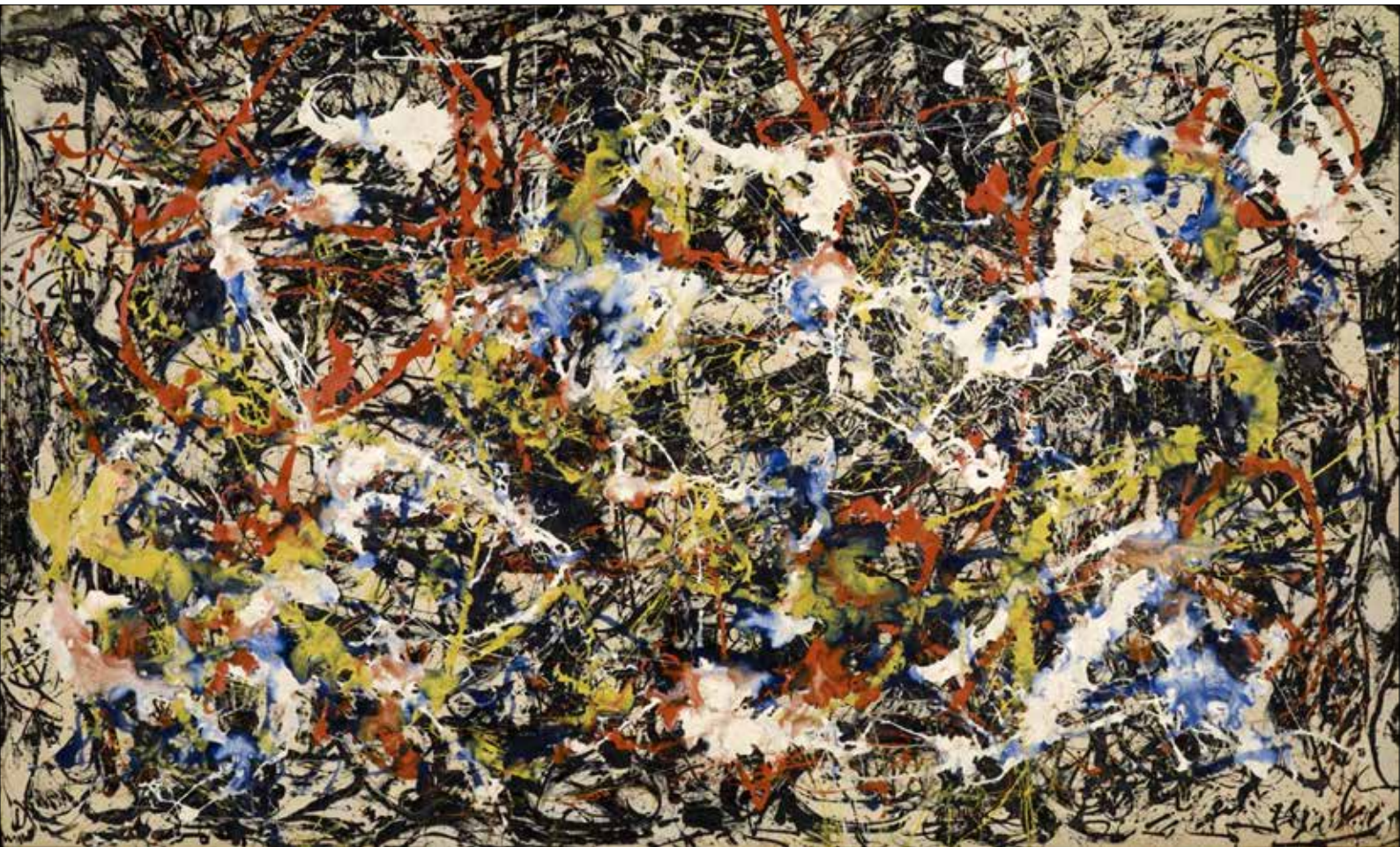
تصویر ۶. جکسون پولاک، هم‌گرایی، ۱۹۵۴، رنگ روغن روی بوم، ۲۳۷ در ۳۹۳ سانتی‌متر، (Collection Buffalo AKG Art Museu) (URL 5).

عقل‌گرایی دکارتی که ذهن را بر جسم و تأمل عقلانی را بر مهارت‌های حسی مقدم می‌شمارد، هم‌خوانی دارد. در نتیجه، هنرمند معاصر نه چیره‌دستی فنی، بلکه دست‌کاری‌کنندهٔ اشیاء و مفاهیم است که بر نگرش مفهومی تمرکز می‌کند. این تغییر، هنرمند را از قید تکنیک‌های آکادمیک رها ساخته و او را به متفکری تبدیل کرده که با زبان بصری، اجتماعی و گاه سیاسی با مخاطب ارتباط برقرار می‌کند.