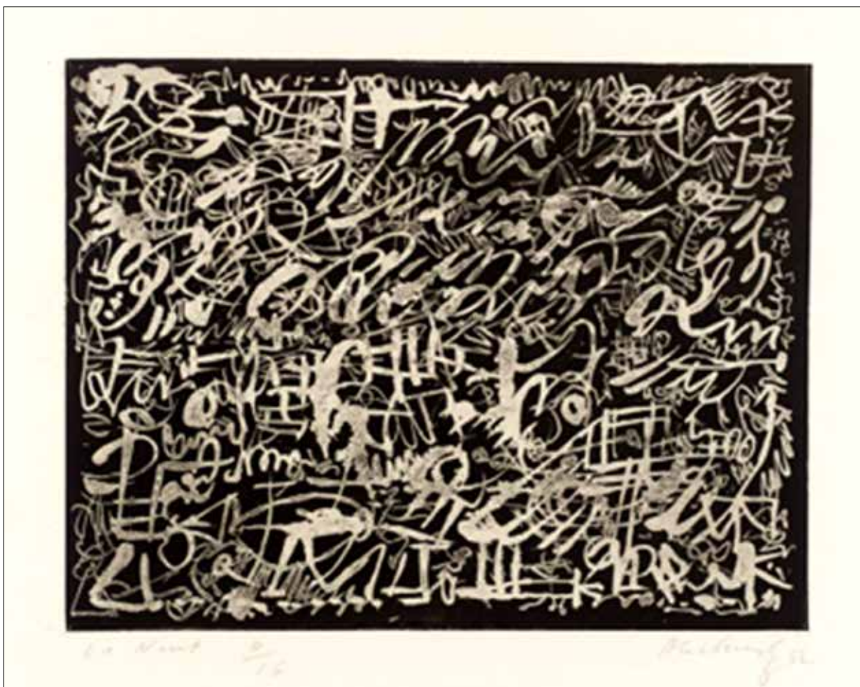
تصویر ۵. پیر آلشینسکی، شب [La Nuit]، ۱۹۵۲، چاپ گود روی کاغذ، ۲۳.۴ در ۳۰.۷ سانتی متر، گالری هنری تیت در لندن (URL 5).