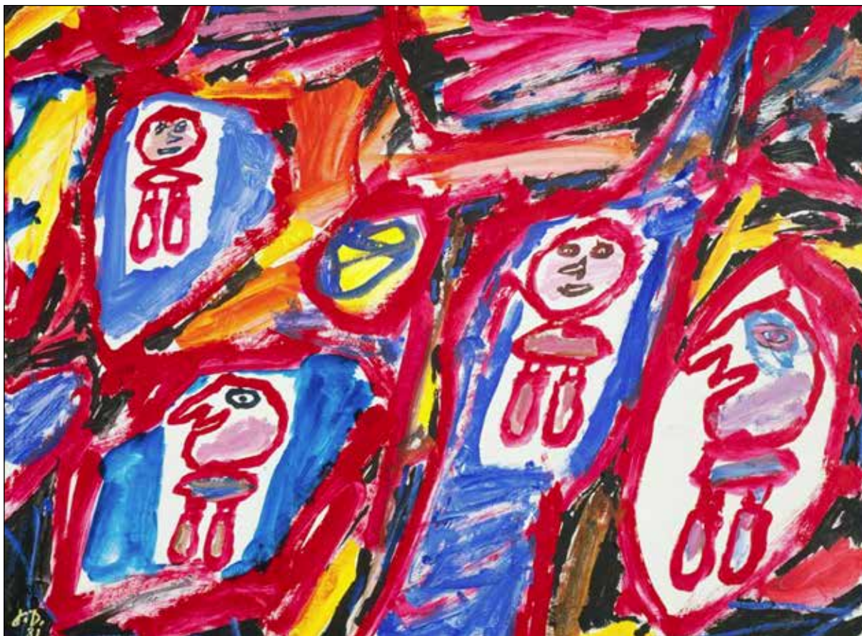
تصویر ۱. ژان دوبوفه، سایتی با ۴ شخصیت (Site avec 4 personnages)، ۱۹۶۶، اکریلیک روی کاغذ، نصب شده روی بوم، ۵۲/۴ × ۷۰/۲ سانتی‌متر، مرکز پمپیدو، پاریس (URL 1).