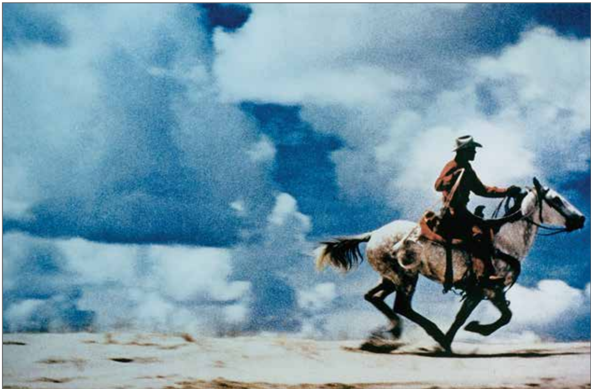
تصویر ۷. ریچارد پرنس، بدون عنوان، کابوی‌ها، ۱۹۸۹، عکاسی، ۱۲۷ × ۱۷۷ سانتی‌متر، موزه متروپولین، نیویورک، آمریکا (Ur17).

کاسوت ۴۹ یا دانیل بورن ۵۰ نیز، هرچند بیرون از سنت نقاشی عمل می‌کردند، نشان دادند که پرسش از مرز هنر همچنان به شکلی غیرمستقیم بر نقاشی سایه می‌اندازد.