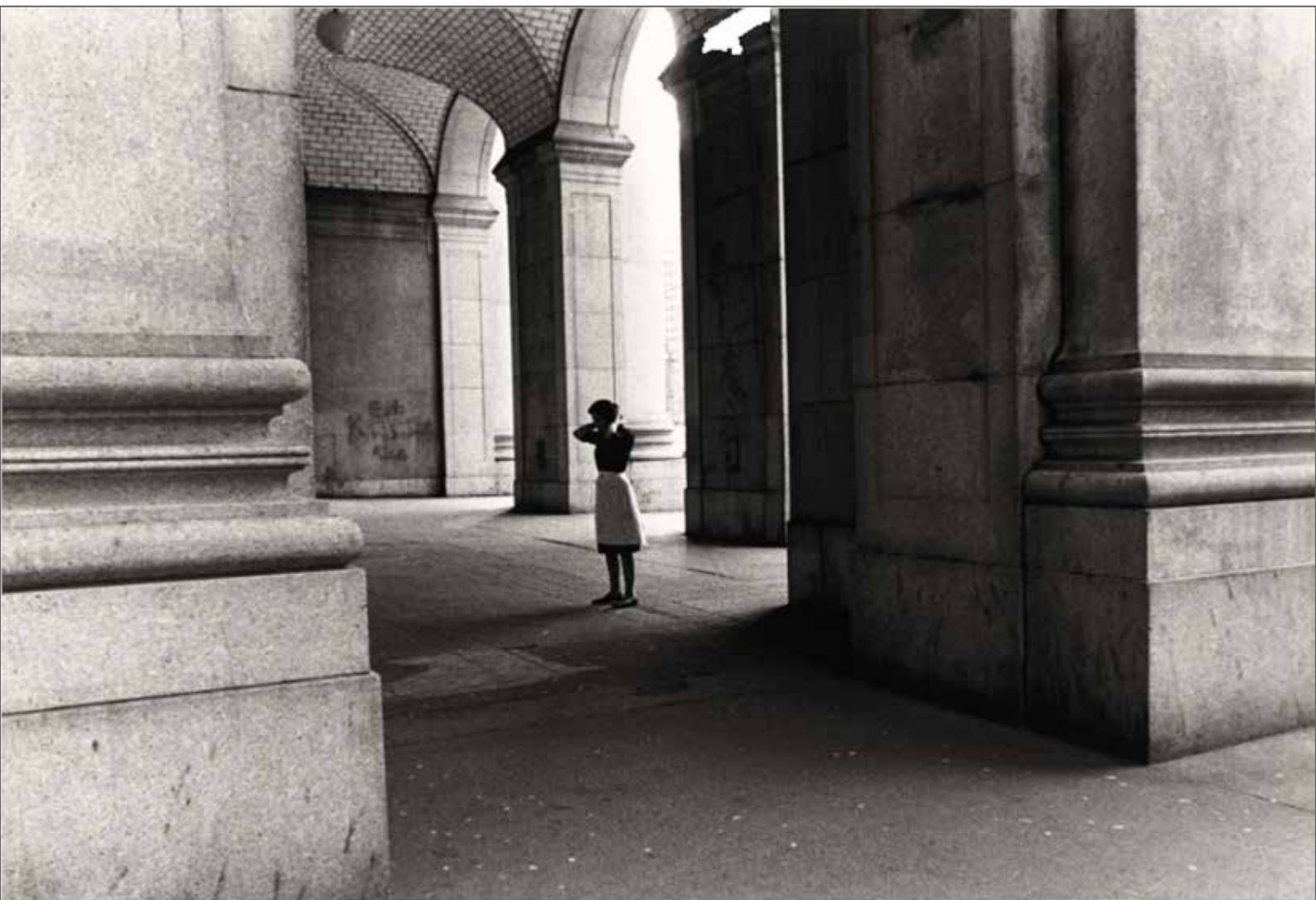
تصویر ۶. سیندی شرم، بدون عنوان، فیلم استیل شماره ۶۴، ۱۹۸۰، چاپ زلاتین نقره‌ای بر روی کاغذ عکاسی، ۶۸/۶ × ۴۶/۵ سانتی‌متر، موزه هنر مدرن نیویورک، آمریکا (Url6).

مدیوم خاص آن، بلکه در شیوه تولید معنا و نسبتش با زمان و زمینه نهفته است. در چنین وضعیتی، نقاشی نه پایان یافته و نه برتر از سایر رسانه‌هاست، بلکه یکی از میدان‌های فعال در شبکه چندمدیومی هنر معاصر به شمار می‌رود. این دیدگاه به ما اجازه می‌دهد تا جایگاه نقاشی را در نسبت با بحران بازنمایی نه به‌مثابه فقدان، بلکه به‌مثابه امکانی برای بازتعریف و بازتداوم هنر در نظر بگیریم.