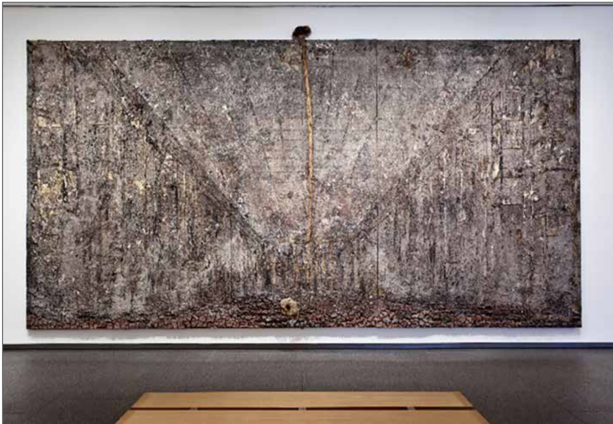
تصویر ۵. آنسلم کیفر، گل خاکستر، ۱۹۹۷-۱۹۸۳، روغن، امولسیون، رنگ اکریلیک، خاک رس، خاکستر، خاک و گل آفتابگردان خشک روی بوم، ۳/۴۰۱ در ۲/۷۶۱ سانتی‌متر، موزه هنر مدرن فورت وورث، ایالت تگزاس، آمریکا (Ur15).

کلمنت گرینبرگ، نقطه آغاز مناسبی برای فهم موقعیت مدرنیستی نقاشی است. گرینبرگ با تأکید بر خودآیینی رسانه‌ها، هنر مدرن را بر پایه نفی سنت‌ها و برجسته‌سازی ویژگی‌های درونی هر مدیوم تعریف می‌کند. در نگاه او، نقاشی زمانی اصیل است که به ماهیت خاص خود، یعنی سطح دو بُعدی و رنگ، وفادار بماند. این رویکرد در نیمه قرن بیستم راهی برای حفظ استقلال نقاشی در برابر ظهور رسانه‌های جدید تلقی شد، اما در نهایت به چرخه‌ای از نفی مداوم انجامید که خود به بحران تداوم و هویت نقاشی منجر شد.