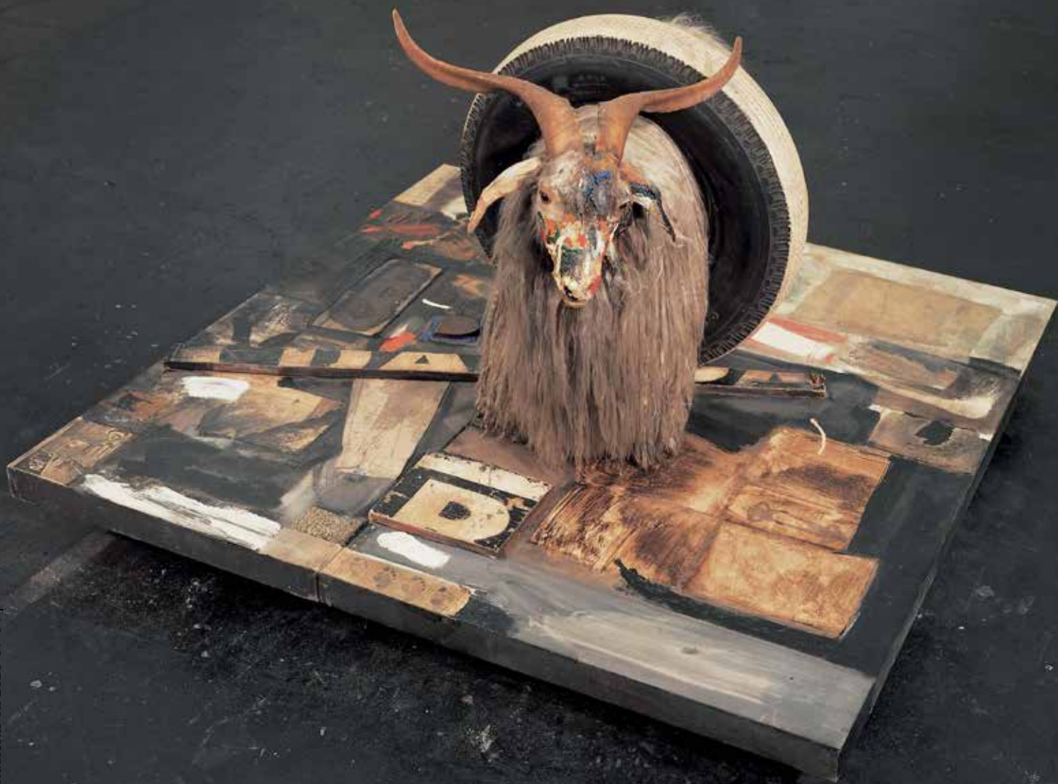
تصویر ۳. رابرت راشنبرگ، مونوگرام، ۱۹۵۵-۱۹۵۹، رنگ روغن روی بوم، کاغذ، پارچه، و استفاده از ابژه واقعی (یک بز تاکسیدرمی، تایر اتومبیل، توپ تنیس، چوب). ۱۰۶.۷ × ۱۳۵.۲ × ۱۶۳.۸ سانتی‌متر، موزه مدرن استکهلم، سوئد (Ur13).