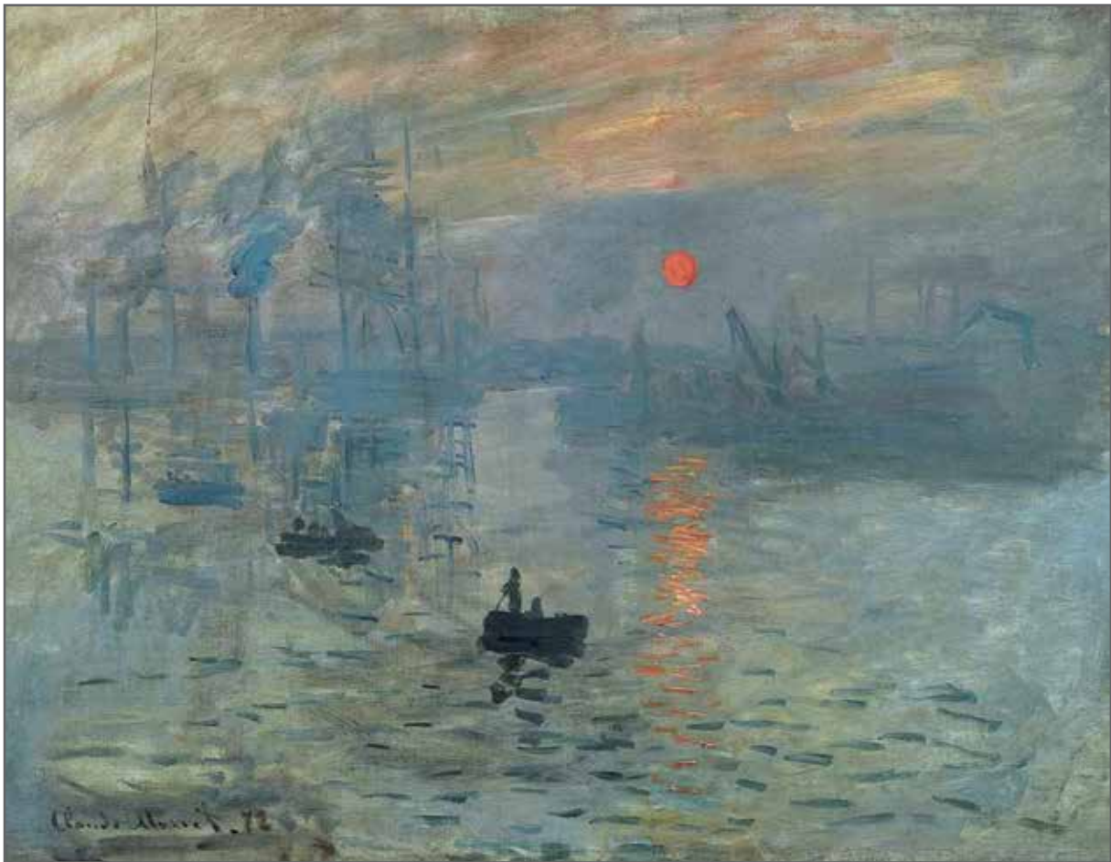
تصویر ۱. کلود مونه ۵۲ ، طلوع خورشید، ۱۸۷۲ (اولین نمایش ۱۸۷۴ در نمایشگاه گروه مستقل نقاشان)، رنگ و روغن روی بوم، ۴۸ × ۶۳ سانتی متر، موزه مارموتان مونه، پاریس، فرانسه (Url1). تصویر ۲ (صفحه روبه‌رو). پابلو پیکاسو ۵۳ ، دوشیزگان آوبنیون [بخشی از اثر]، ۱۹۰۷، رنگ و روغن روی بوم، ۲۴۴ × ۲۳۴ سانتی متر، موزه هنرهای معاصر، پاریس، فرانسه (Url2).