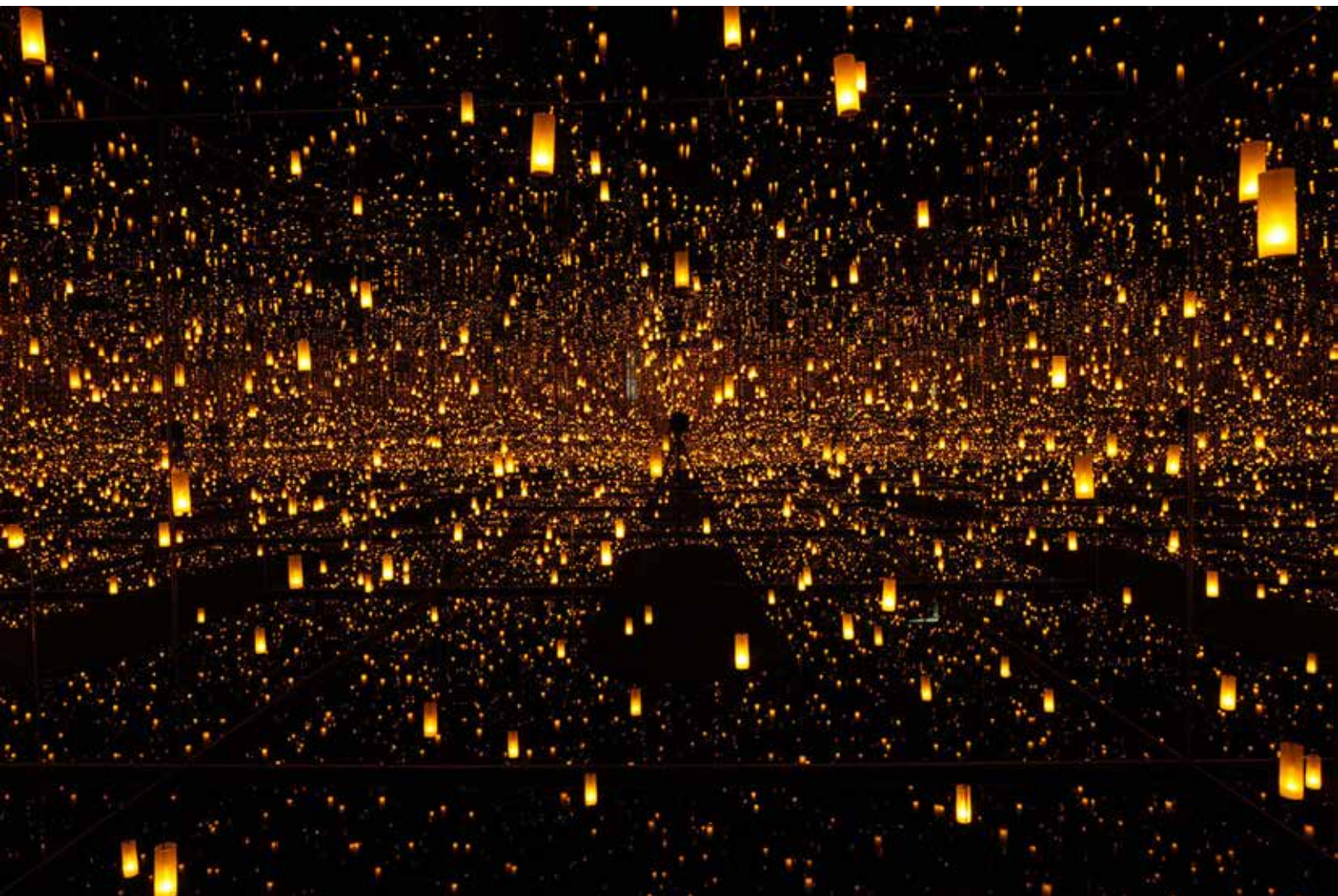
تصویر ۸. یاگوی کوساما، اتاق آینه بی‌نهایت - ارواح میلیون‌ها سال نوری دورتر، ۲۰۱۳، اتاق پوشیده از آینه، چراغ‌های LED آویزان، آب (برای بازتاب کف) و چیدمان نوری/فضایی، ۲۳۳ × ۴۱۲ × ۴۱۲ سانتی‌متر، موزه هنر معاصر لس‌آنجلس، آمریکا (Ur18).

علاوه بر این، بحران بازنمایی ماهیتی صرفاً زیبایی‌شناختی ندارد، بلکه به پرسش‌های اجتماعی و سیاسی نیز پیوند خورده‌است. آثاری چون پروژه‌های سیندی شرمَن دربارهٔ جنسیت یا ریچارد پرینس دربارهٔ فرهنگ مصرفی نشان می‌دهند که بازنمایی به ابزاری انتقادی برای واکاوی مناسبات قدرت، هویت و رسانه بدل شده‌است. در همین راستا، پژوهش‌های جدید دربارهٔ تصویر در زمان بحران نشان می‌دهند که هنر، بیش از بازنمایی زیبایی، به بستری برای مواجههٔ جمعی با بحران‌های اجتماعی و سیاسی بدل می‌شود.