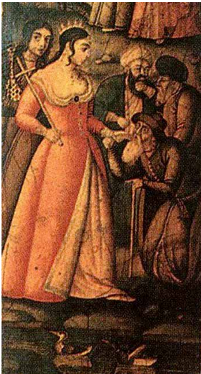
تصویر ۳. منسوب به محمدعلی بن محمد زمان، فاقد تاریخ، اواخر صفویه و اوایل افشاریه، دلدادگی شیخ صنعان به دختر ترسا، بخشی از وجه رویین قلم‌دان لاک‌ی (خلیلی، ۱۳۸۶: ۵۰).