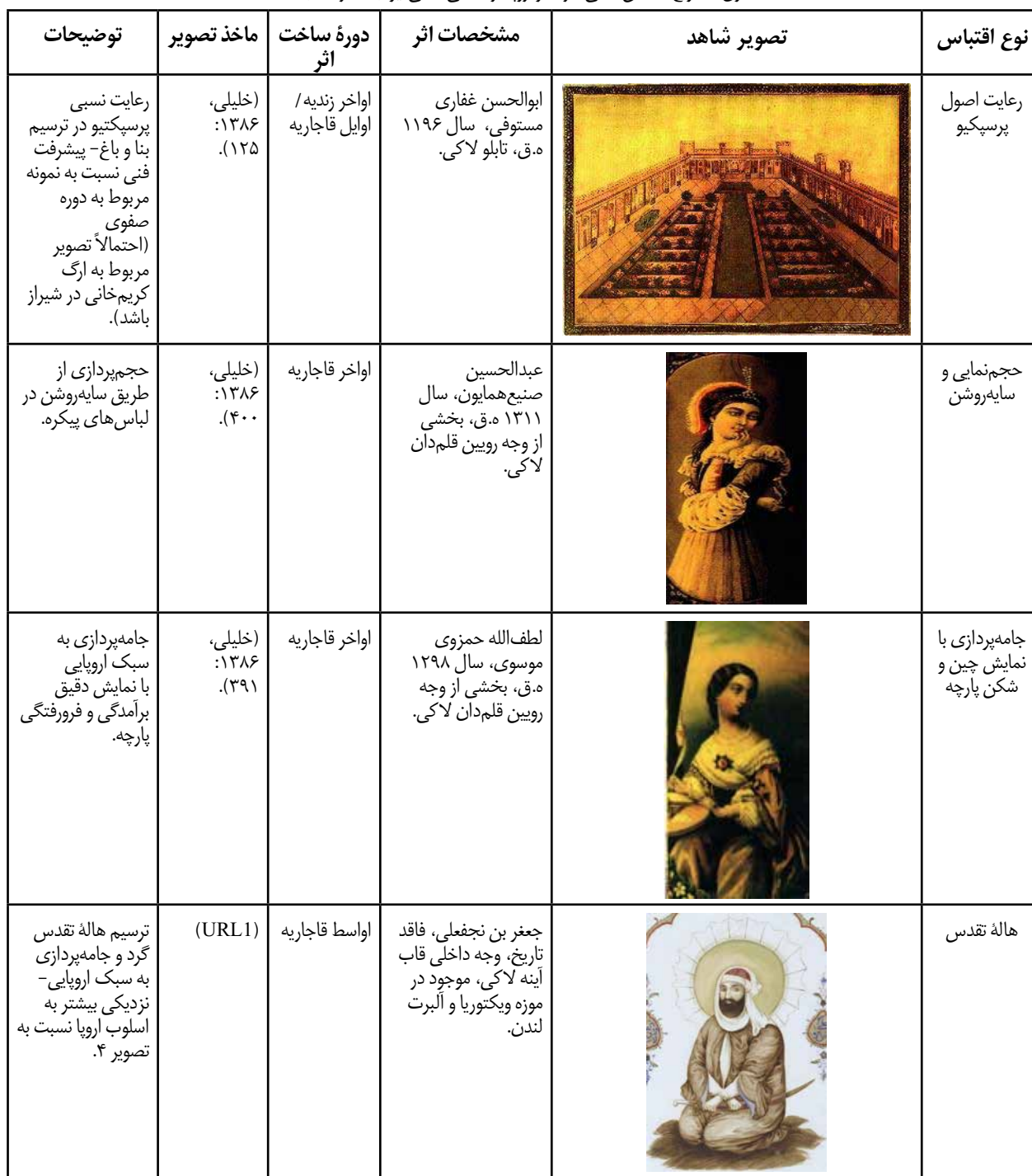
جدول ۱. انواع اقتباس «فنی» از هنر اروپا در نقاشی لاک‌ی ایران (نگارندگان).