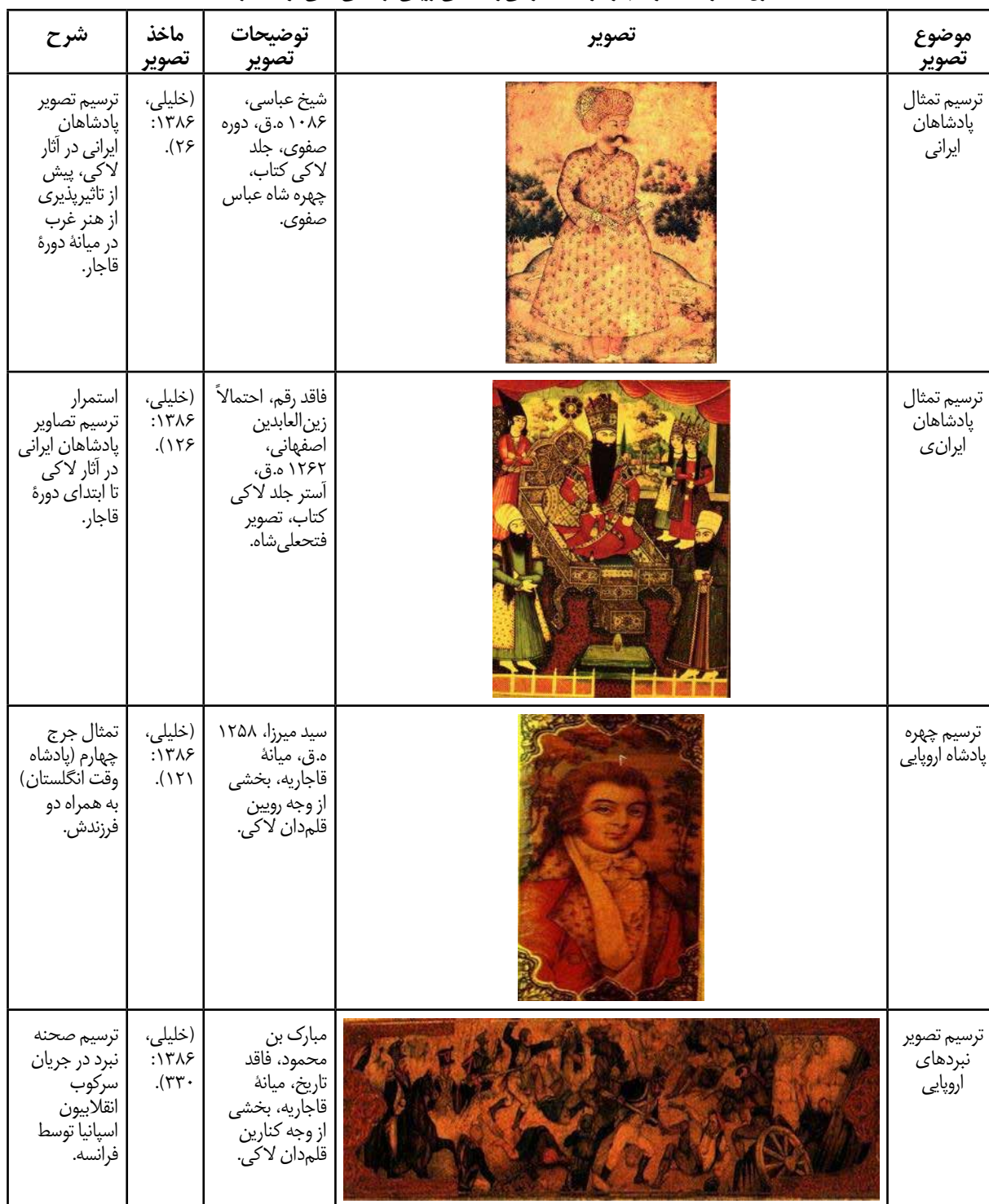
جدول ۷. نمونه‌های ترسیم موضوعات حکومتی و سلطنتی اروپایی در نقاشی لاک‌ای ایران (نگارندگان).