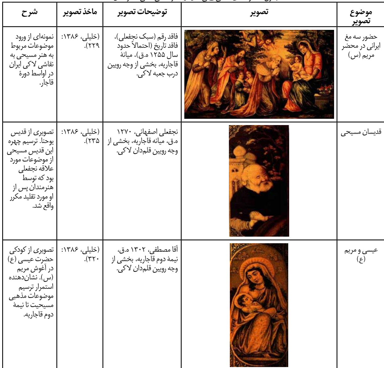
جدول ۶. نمونه‌های نقاشی آیینی مسیحیت در نقاشی لاک‌ی (نگارندگان).

نظامی اروپا و روسیه همواره مورد علاقه مقامات ایرانی بود، عباس میرزا، ولیعهد فتحعلی شاه، به تجددگرایی تمایل داشت و از دگرگونی‌های اساسی او در ارتش، تغییر لباس نظامیان بود. از این زمان، به تبعیت از روسیه، انگلیس و اتریش، یونیفورم نظامی مخصوص ایران شکل گرفت (شهبهانی، ۱۳۹۶: ۱۱۴). بنابراین، در حالی که در آثار کهن‌تر نقاشی لاک‌ی، نظامیان و جنگاوران ایرانی با لباس‌های ایرانی ترسیم می‌شدند، از اواسط دوره قاجار به این سو، ترسیم یونیفورم نظامی در آثار لاک‌ی رایج شد. قدیمی‌ترین نمونه این موضوع که در این پژوهش شناسایی شد، تصویری از جوانی محمدشاه قاجار با یونیفورم اروپایی