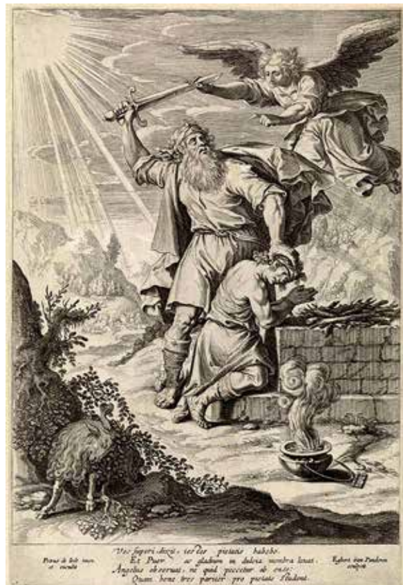
تصویر ۸. اگبرت وان پندرن ۲ ، فاقد تاریخ، قرن شانزدهم و هفدهم م.، قربانی کردن اسحاق ۱ ، چاپ فلز روی کاغذ (URL 4).

هنر نقاشی لاکه، یکی از شاخه‌های مهم نقاشی ایرانی است که در قرن نهم ه.ق ابداع و به یکی از مهم‌ترین جلوه‌گاه‌های هنرهای تزئینی ایران تبدیل شد. بازه زمانی نیمه دوم دوره صفوی تا پایان دوره قاجار را به دلایل متعدد، از جمله جایگزینی هنر لاکه به جای کتاب‌آرایی، افزایش کمی خلق آثار لاکه و هم‌زمانی با آغاز و گسترش جریان فرنگی‌سازی در هنر ایران، باید مهم‌ترین دوره تولید آثار لاکه در ایران دانست. در این دوران، هنر لاکه ایران شاهد تحولات عظیم در نقوش و شیوه اجرای آن بود که مهم‌ترین نمود آن، تمایل به هنر اروپا و اقتباس از آن است. بر اساس یافته‌های این پژوهش، هنر لاکه ایران در بازه زمانی یاد شده، در سه حوزه «تکنیکی»، «نقوش» و