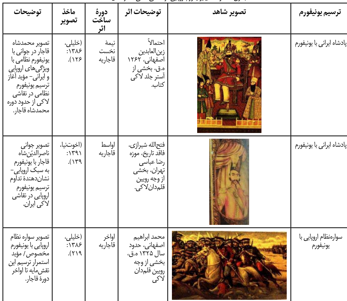
جدول ۵. نمونه‌های یونیفورم اروپایی در نقاشی لاک‌ی (نگارندگان).

زمینه، نقش قلم‌دان‌های روسی که مورد تقلید هنرمندان ایرانی واقع می‌شد، حائز اهمیت است (احسانی، ۱۳۶۸: ۴۲). به نظر می‌رسد منظرپردازی قلم‌دان‌های روسی در نیمه دوم دوره قاجار، در کنار چاپ‌ها و گراورهای فرنگی، زمینه‌ساز گرایش به ترسیم مناظر اروپایی در آثار لاک‌ی ایران شده باشد (جدول ۴). قلم‌دان‌های ایرانی که به تبعیت از قلم‌دان‌های روسی در اواخر دوره قاجار ترسیم شده‌است، نشان‌دهنده نوعی تسلیم محض در برابر سنت نقاشی اروپایی در اواخر دوره قاجار است که از ابعاد گوناگون فنی، موضوعی و نقشی رخ داده‌است.