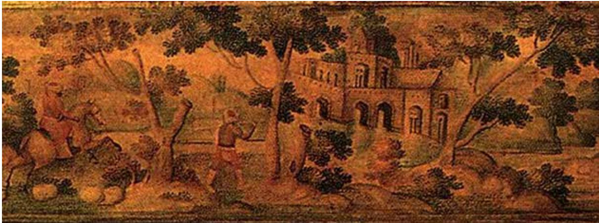
تصویر ۱. علیقلی جبادار، ۱۱۱۷ ه.ق، دوره صفوی، قسمتی از وجه کنارین قلمدان لاک‌ی (خلیلی، ۱۳۸۶: ۴۸).

باب تاثیرپذیری از هنر اروپایی در نگارگری مکتب اصفهان، دیوارنگاره‌های کاخ‌های سلطنتی و تابلوهای نقاشی در نیمه دوم قرن یازدهم ه.ق را گشود (جوانی، ۱۳۹۰: ۱۳۷) و بدین طریق، دورانی جدید در تاریخ نقاشی ایران پدید آمد که شامل الگوبرداری ناقص از نقاشی طبیعت‌گرایی اروپایی شد و در اصطلاح «فرنگی‌سازی» نام گرفت. از این پس و تا دو قرن (اواخر سده ۱۳ ه.ق)، نقاشی ایران در جدال میان سنت‌های پیشین و هنر اروپایی قرار داشت تا سرماخذ، نقاشی اروپایی فائق آمد (پاکباز، ۱۳۹۶: ۱۳۱). هرچند گفته شده که ریشه‌های فرنگی‌سازی به اقدامات شیخ محمد و صادقی‌بیگ افشار باز می‌گردد، در حقیقت آغاز رسمی این جریان با آثار بهرام سفره‌کش، شیخ عباسی، علیقلی جبادار و محمد زمان پدید آمد و گسترش یافت (پاکباز، ۱۳۹۹: ۱۰۰۶)