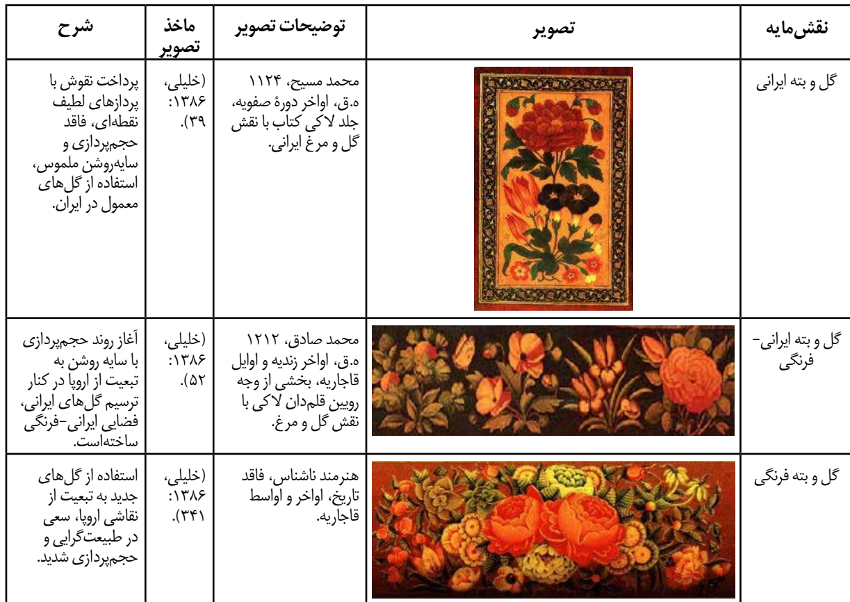
جدول ۲. روند تاثیرپذیری نقش مایه «گل و بته» از نقاشی اروپا (نگارندگان).

دو منبعث از هنر مسیحی و اروپایی است (تصویر ۴). مورد دیگر، ترسیم ساختمان‌ها به شیوه اروپایی است که مشخصه بارز آن، سقف‌های شیروانی، معماری گوتیک و بعضاً علامت صلیب بر فراز گنبد‌ها و سقف خانه‌ها است. در این مورد نیز اگرچه ترسیم ساختمان‌ها در دوردست، سنتی رایج در نگارگری ایران بوده است، ترسیم ساختمان‌ها با معماری اروپایی، از اواخر دوره صفوی به بعد پدیدار شد. در جدول ۱، برای تبیین بیشتر مطالبی که بیان گردید و هم‌چنین نمایش استمرار روند اقتباس تکنیکی از هنر اروپا، برخی از نمونه‌های تصویری متأخرتر ارایه شده‌است.