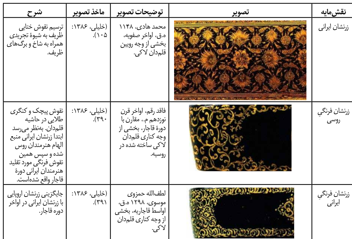
جدول ۳. روند تاثیرپذیری نقش مایه «زرنشان» از نقاشی اروپایی (نگارندگان).

آن نقش در آثار لاک‌ی رواج یافت. در ادامه، به‌طور جداگانه هر یک از نقوشی که نوع اروپایی آن به نقاشی لاک‌ی ایران وارد شده است، مورد بحث قرار می‌گیرد.