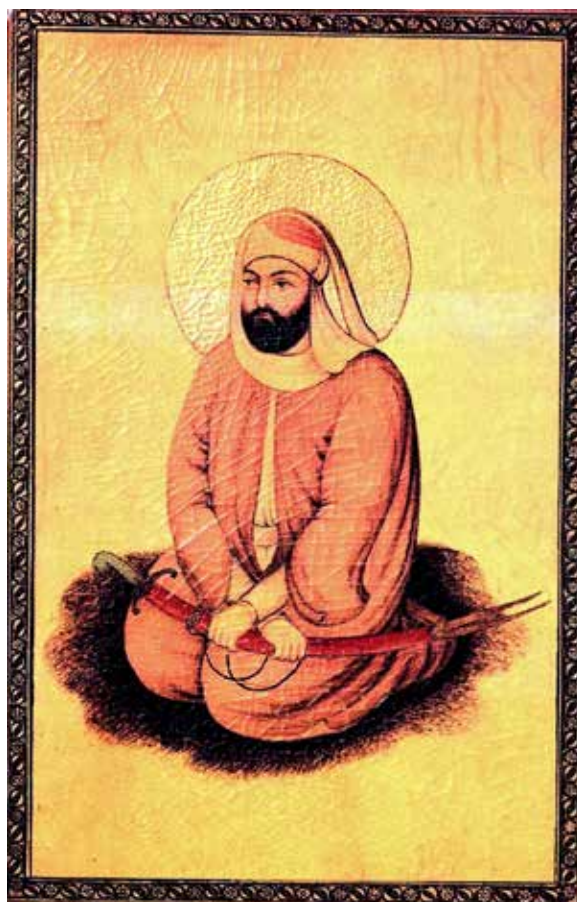
تصویر ۴. هنرمند ناشناس، فاقد تاریخ، احتمالاً دوره زندیه، شمایل حضرت امیرالمومنین، قاب آینه لاک (همان: ۶۰).

جامه‌پردازی پیچیده‌تر از طریق نمایش چین و شکن