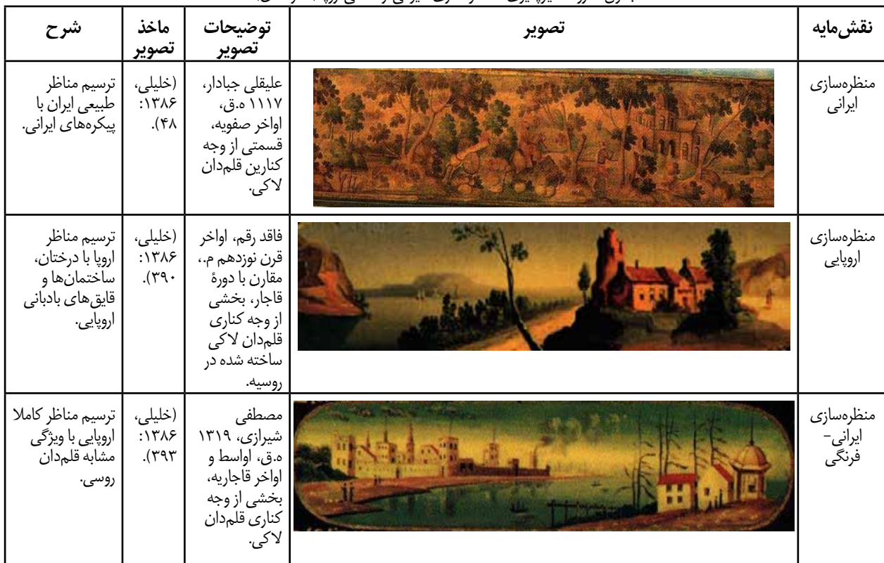
جدول ۴. روند تأثیرپذیری «منظره‌سازی» ایرانی از نقاشی اروپا (نگارندگان).

لاکی گفته می‌شود (ادیب برومند، ۱۳۶۶: ۷۶). از نقوش زرنشان در تزئین و تکمیل فضای مابین مدالیون‌ها و ترنج‌ها سطح آثار لاکی، به‌خصوص قلم‌دان‌ها، جعبه‌ها و جلد‌ها استفاده می‌شد (صنیع‌زاده، ۱۴۰۲: ۴۰-۵۵) و در اکثر موارد، شامل ترسیم نقوش تجریدی ختایی بر زمینه تیره رنگ بوده است. هم‌چنین در مواردی، در کاربری به‌عنوان نقش‌مایه اصلی، به‌تنهایی تمام سطح اثر را تزئین می‌نمود. در قلم‌دان‌های اواسط و اواخر دوره قاجار، نوعی جدید از زرنشان مشاهده می‌شود که شامل پیچک‌ها و برگ‌های کنگری به شیوه فرنگی است که با همان کاربرد زرنشان ایرانی، به‌عنوان نقش تزئینی در حواشی قلم‌دان‌ها به کار رفته و آشکارا در تماس با هنر اروپا، دچار تغییر شده است (جدول ۳).