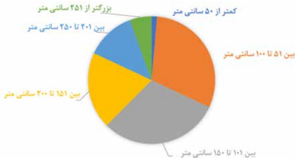
شکل ۳. نمودار فراوانی ابعاد آثار حاضر در پانزدهمین دوره حراج تهران (نگارنده).