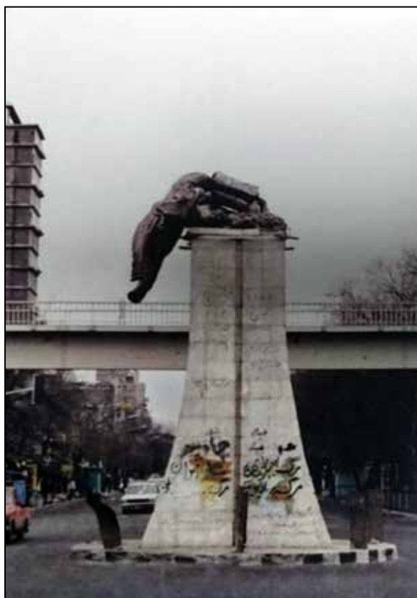
شکل ۵. شعارنویسی برگرفته از کتاب «دیوارنویسی‌های انقلاب»

در تهران است». مکان در این عکس خیابان مخبرالدوله قبل از انقلاب و خیابان استقلال پس از انقلاب است. مردم که از شنیدن خبر بازگشت امام به کشور مشعوف شده بودند به خراب کردن مجسمه‌ها و آثاری از دوران شاهنشاهی پرداخته و مجسمه شاه در مخبرالدوله را خراب می‌کنند. فرو نشستن و تخریب هر آن چه به دوران پهلوی وابسته است، یکی از راه‌های بیان اعتراض و گردش نفرت در اجتماع بوده که در این عکس به خوبی نمایش داده شده است. نوشتن عناوینی بر سکوی مجسمه همچون: مرگ بر بی بی سی و مرگ بر شاه، که در بیش‌تر نوشته‌های اعتراضی این دوران دیده شده، یادآور عدم علاقه مردم به حضور و نفوذ بیگانگان بر فرهنگ و سنت‌های آیینی و مذهبی ایران است. بنابراین در این عکس نیز چرخش احساس جمعی براساس خوشحالی از رفتن شاه و بازگشت امام دیده می‌شود.