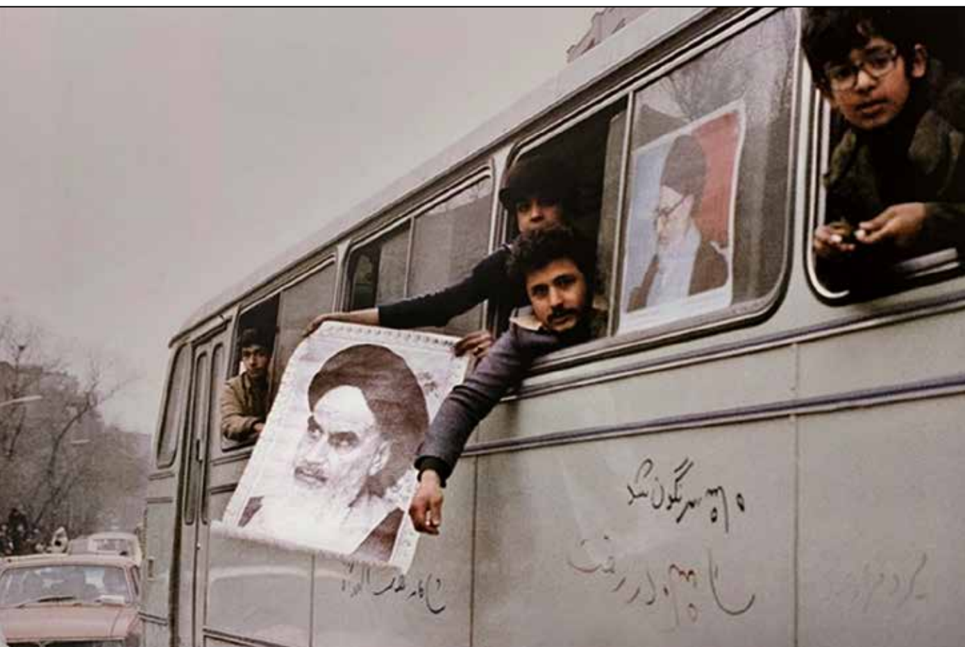
شکل ۳. شعارنویسی برگرفته از کتاب «دیوارنویسی‌های انقلاب»