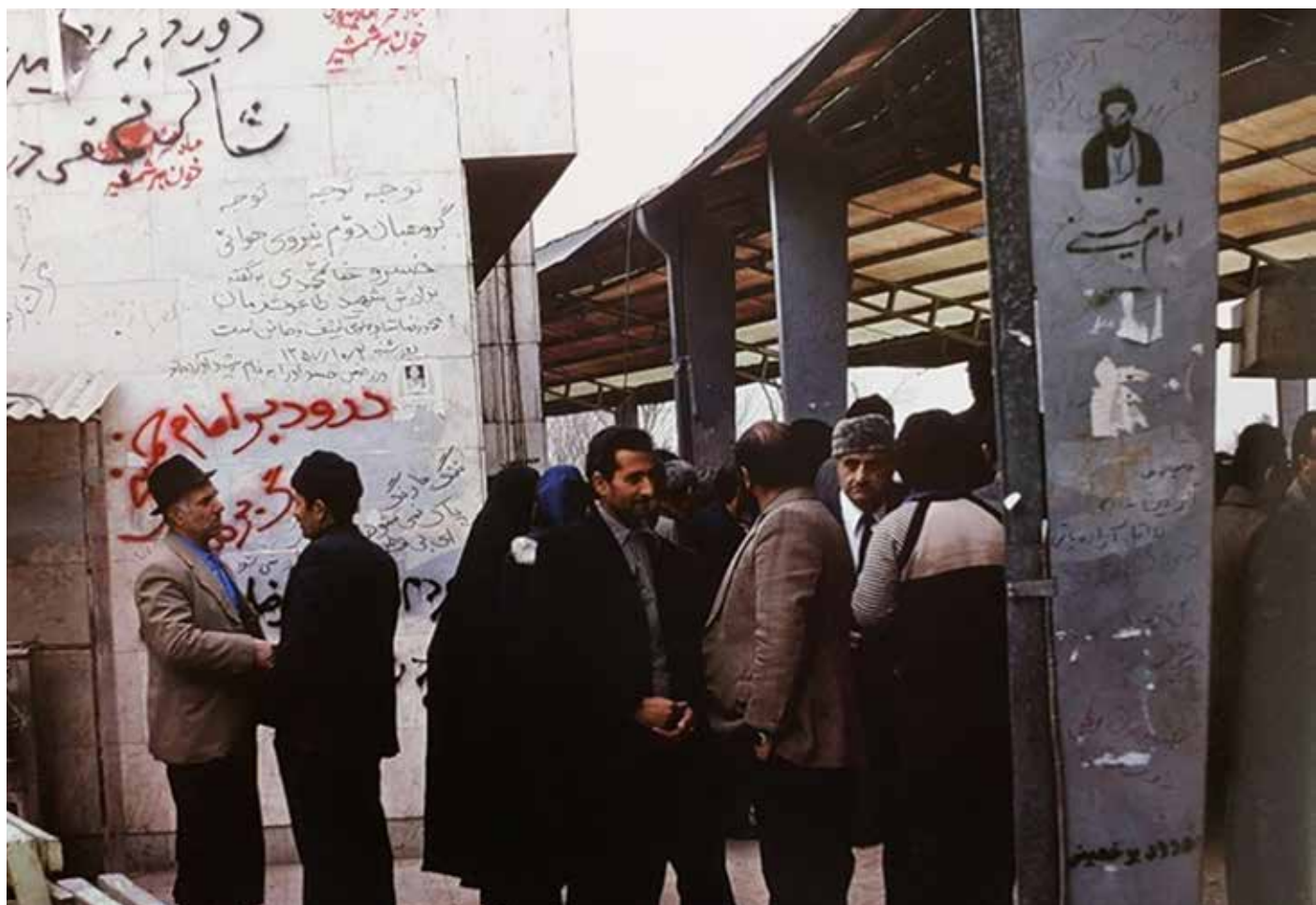
شکل ۲. شعارنویسی برگرفته از کتاب «دیوارنویسی‌های انقلاب»