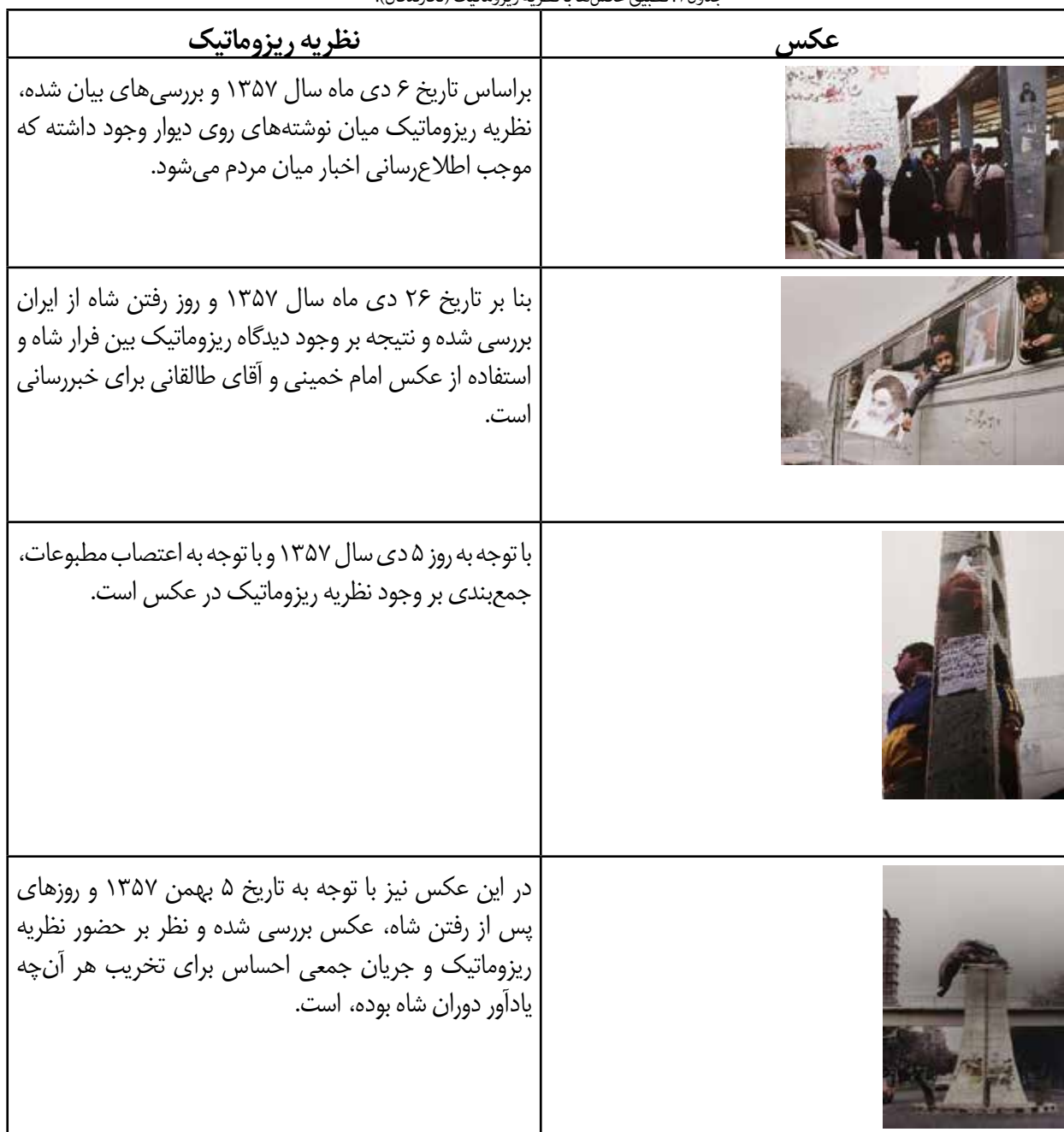
جدول ۱. تطبیق عکس‌ها با نظریه ریزوماتیک (نگارندگان).