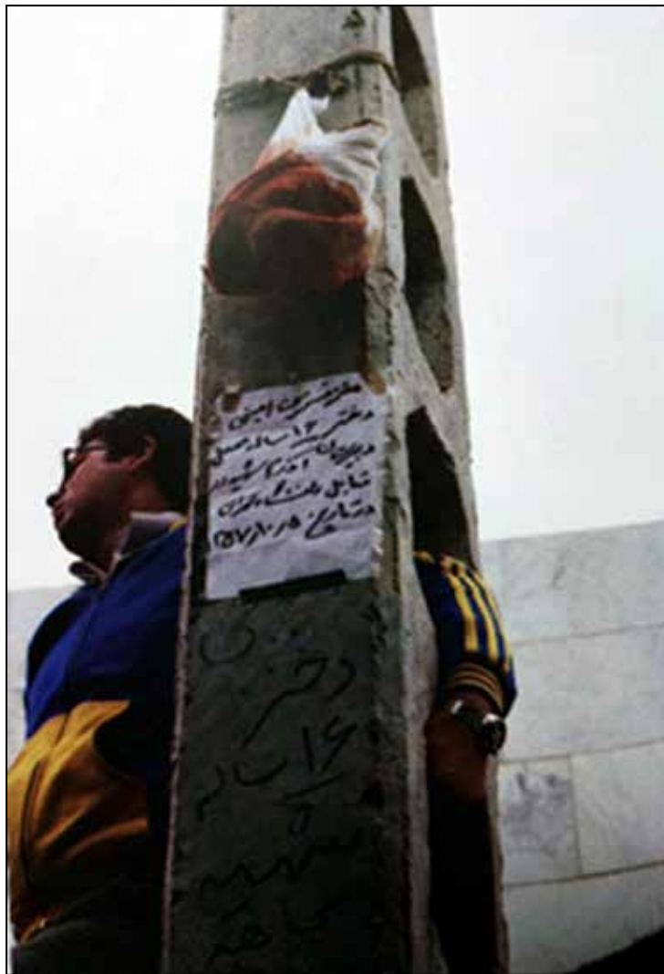
شکل ۴. شعارنویسی برگرفته از کتاب «دیوان‌نویسی‌های انقلاب»

(۱۳۹۷: ۲۴۹). طبق کنوانسیون حقوق کودک، فرد زیر ۱۸ سال از منظر قانونی کودک شناخته شده و حتی در صورت بروز جرم نیز حاکمیت باید تا ۱۸ سالگی او منتظر بماند. بنابراین این قانون‌شکنی و کشتن کودکی زیر ۱۸ سال، آن‌هم برای بیان دیدگاه خویش توسط ماموران دولتی، اتفاقی دردناک و نابخشودنی محسوب می‌گشت. مردم به صورت نمادین پارچه‌ای را از خون او گلگون ساخته و از تیر چراغ برق آویزان کرده‌اند. باید این نکته را یادآور شد که در این تاریخ به علت اعتصاب مطبوعات، هیچ روزنامه و مجله‌ای فعالیت نداشت؛ بنابراین هیچ تیتراژ مستندی از این روز در دست نیست. اما تیر چراغ برق حاوی پارچه خونین، به‌عنوان رسانه‌ای در آن روزگار بدون رسانه عمل کرده و خود نوعی خبررسانی برای مردم به حساب می‌آید. پس می‌توان این چنین برداشت کرد که حالات و اتفاقات شکل‌گرفته در اجتماع توسط مردم و اشکال گوناگون در