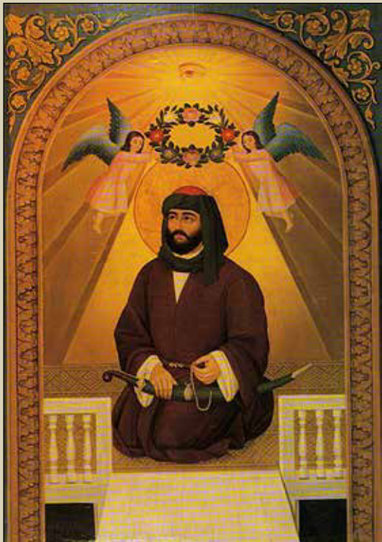
تصویر ۷: هاکوپ هوناتانیا، صورت حضرت علی بن ابی طالب (ع).

هاکوپ هوناتانیا [Hakob Hovnatanyan] (زاده ۱۸۰۹، تفلیس - درگذشته ۱۸۸۱، تهران)، ملقب به «رافائل تفلیس». از او به عنوان بنیان‌گذار مکتب مدرن هنر نقاشی ارمنی و از استادان نگارگری، چهره‌پردازی یاد می‌کنند.