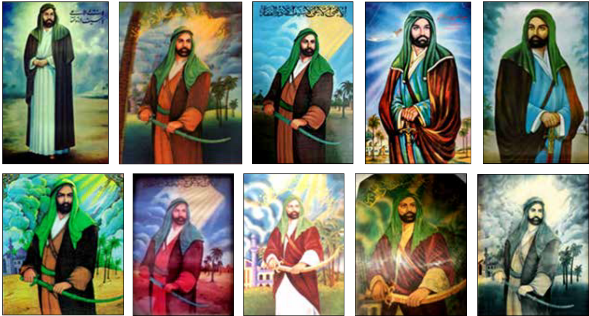
تصویر ۴: مجموعه‌ای از برخی پوسته‌های صُور ایستاده امام علی (ع) تحت تأثیر یحیی نصیری (URL 5).

صُور ایستاده حضرت علی (ع) در این پوسته‌ها، در حالت تنها، چهره به صورت سه‌رخ، بدن سه‌رخ اما عموماً صورت به سمت راست و بدن به سمت چپ مایل است. این پوسته‌ها دو گونه است: حضرت علی (ع) با ذوالفقار و حضرت علی (ع) بدون ذوالفقار. در مورد اول، در برخی شمشیر، حمایل شده است و جهت آن از چپ به راست است یعنی سر شمشیر سمت چپ تصویر و انتهای آن سمت راست تصویر است و در برخی دیگر تکیه حضرت (ع) بر شمشیر است. با توجه به این‌که نمونه تصویر ایستاده از حضرت علی (ع) از قوللرآقاسی و مدبر در دسترس نیست، به نظر می‌رسد نقاشان بعدی، حتی شاید هنرمندان مدرنیست معاصر نظیر جواد حمیدی (تصویر ۸)، تحت تأثیر نصیری و احتمالاً پوسته‌های وی بوده‌اند.