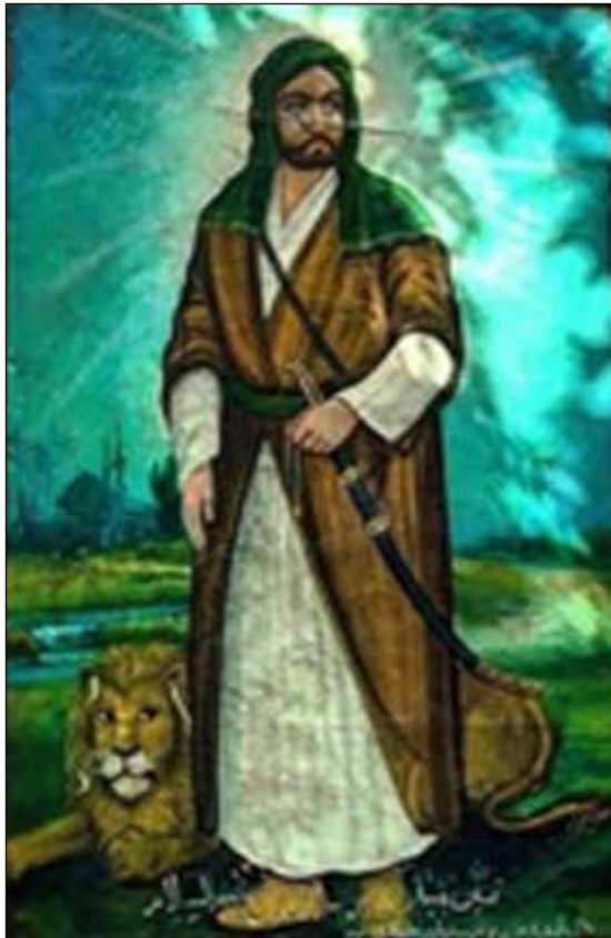
تصویر ۳/ب: تصویر ایستاده امام علی (ع)، حسن اسماعیل‌زاده (URL 4).