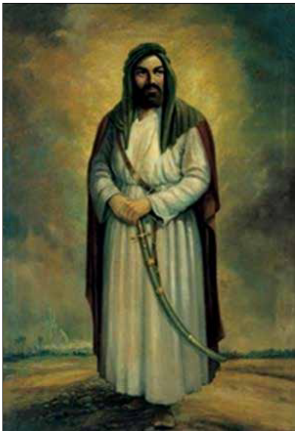
تصویر ۲: تصویر ایستاده امام علی (ع)، حجت‌الله شکیبا (URL 2).