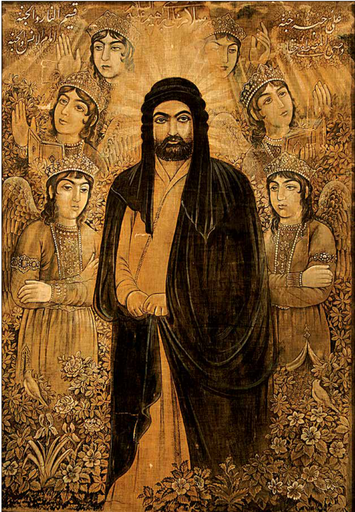
تصویر ۵: صورت ایستاده امام علی (ع)، اسماعیل جلائی، دوره قاجار (URL 6).