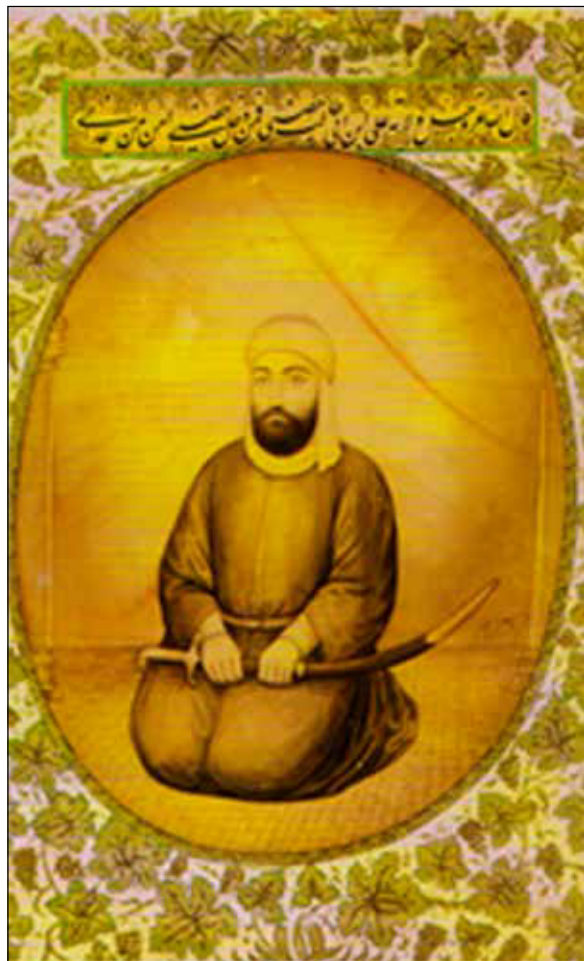
تصویر ۶: صورت نشسته امام علی (ع)، اسماعیل جلایر، دوره قاجار، (URL 7).

بنا بر روایتی، زمانی که نقاش در تبریز زندگی می‌کرده است، خواب‌ها می‌شود و سپس شمایل حضرت علی (ع) را می‌کشد. این نقاشی را یکی از اولین آثار موجود هاکوپ در ایران می‌داند. در این نقاشی، حضرت علی (ع) قبابی قهوه‌ای بر تن و دستاری سبز بر سر دارند. دست راست خود را بر روی غلاف شمشیر [ذوالفقار] قرار داده، در دست دیگر تسبیحی گرفته‌اند و بر روی حصیری که روی تخت انداخته شده، نشسته‌اند. نقاش تحت تأثیر نقاشی‌های مسیحی، علاوه بر ترسیم هاله نور دور سر، دو فرشته که بالای سر امام حلقه گلی را نگه داشته‌اند، کشیده است. بخش بالای شمایل دارای قوس تزئینی است که دور تا دور نقاشی را فراگرفته. این اثر در اندازه ۷۳×۱۰۳ سانتی‌متر، بدون تاریخ و امضا، در گنجینه هنرهای تزئینی اصفهان نگه‌داری می‌شود. به نظر می‌رسد این اثر متعلق به شمایل‌خانه ناصرالدین شاه بوده و پس از مرگ او، به دست حاجی محتشم السلطنه می‌رسد. برخی معتقدند وجود تابلویی با ابعاد کوچک‌تر از این اثر با قاب زرین الماس نشان در موزه جواهرات ملی ایران، دلیل ارتباط این دو اثر با دربار ناصری است.